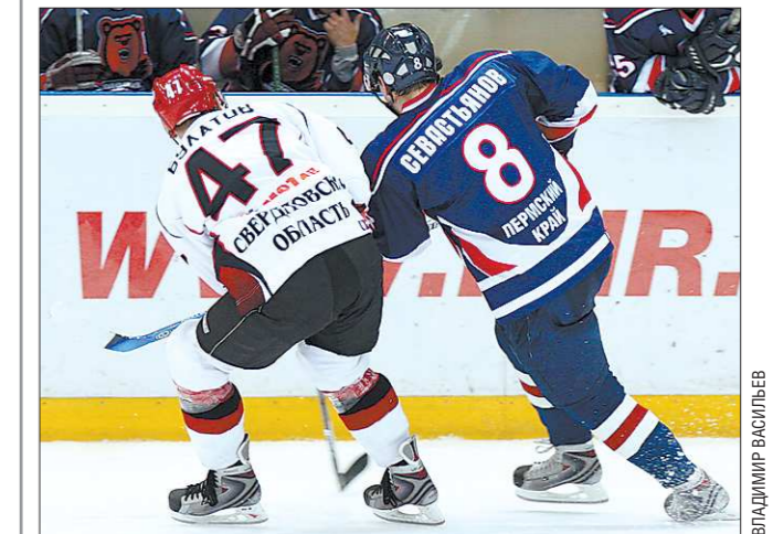
Вопрос «Кто главнее?» два региона выясняют до сих пор. Но сейчас — только на спортивных аренах

ИТОГО. 138 лет Екатеринбург был в подчинении Перми (с 1781-го по 1919-й), затем четыре года эти города были независимыми друг от друга, затем 15 лет Пермь подчинялась Екатеринбург и, наконец, с 1938 до нынешнего времени (74 года) — снова независимы.