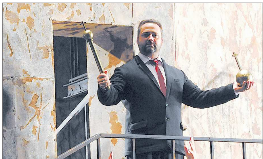
Не поверите: это — Борис Годунов в новой премьере Екатеринбургского оперного. Скипетр и держава — самые светлые пятна в спектакле, насыщенном современными аллюзиями