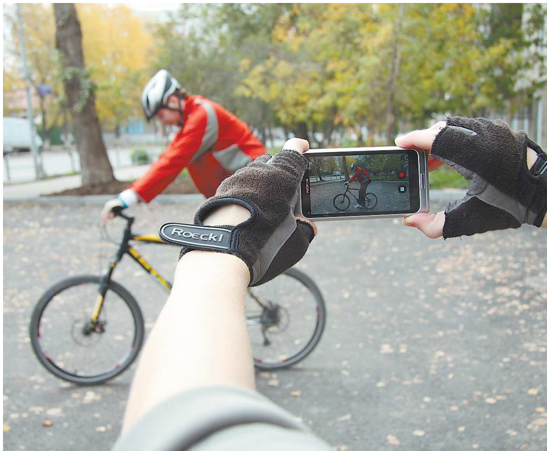
Самым первым видео, размещённым на Ютуб 23 апреля 2005-го был 18-секундный любительский ролик американца Джаведа Карима в зоопарке Сан-Диего. И до сих большая часть видео на ресурсе – это любительские ролики.

Многие известные личности, используя каналы Ютуб, рассказывают о новостях из своей жизни, оповещают о предстоящих гастролях и делятся мнением по тому или иному поводу. Ежедневное количество просмотров – четыре миллиарда. Молодёжь, которую оградят от вредных роликов, пусть их будет даже 40 процентов на Ютуб, потеряет доступ к 60 процентам важ-