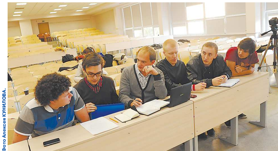
Отбор новых участников в команду – дело нешуточное. «Голоса» обсуждали каждого кандидата.

«По степени отполированности водосточных труб легко можно определить, где в общежитии университета живут самые сговорчивые студентки».