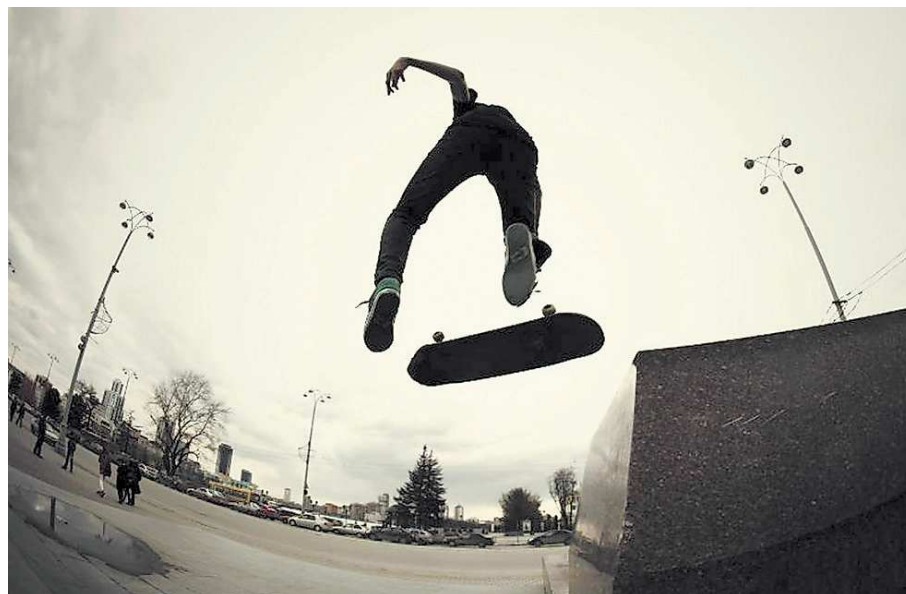
Упав со скейта, нужно суметь подняться.