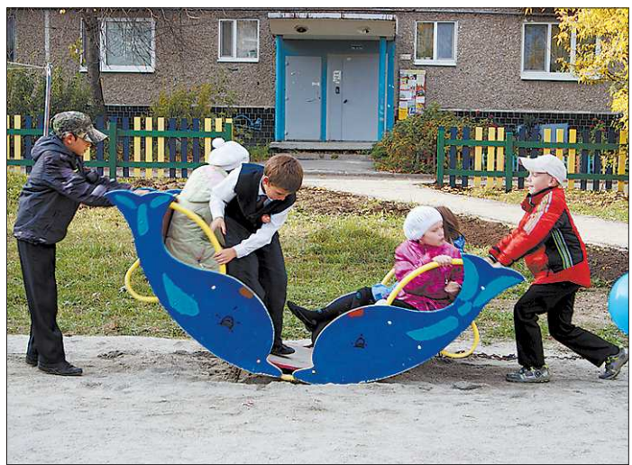
«Большое плавание» по инициативе в конце концов принесло результат: в Верхней Пышме на один уютный двор стало больше

Прежде чем деньги «пришли» во двор, родители сами разработали архитектурный проект, провели разметку во дворе, высадили деревья и цветы собственными силами. Профессиональные «граффитички» (такие нашлись в инициативной группе) продавали идею и расписали серую трансформаторную будку по мотивам мультфильма «Домовёнок». Более того, жильцам удалось на благотворительной основе привлечь одного из местных провайдеров связи, чтобы установить во дворе видеонаблюдение и оберегать созданное от вандалов. А на торжественном открытии площадки жильцы решили ещё и возобновить традицию проведения праздников двора.