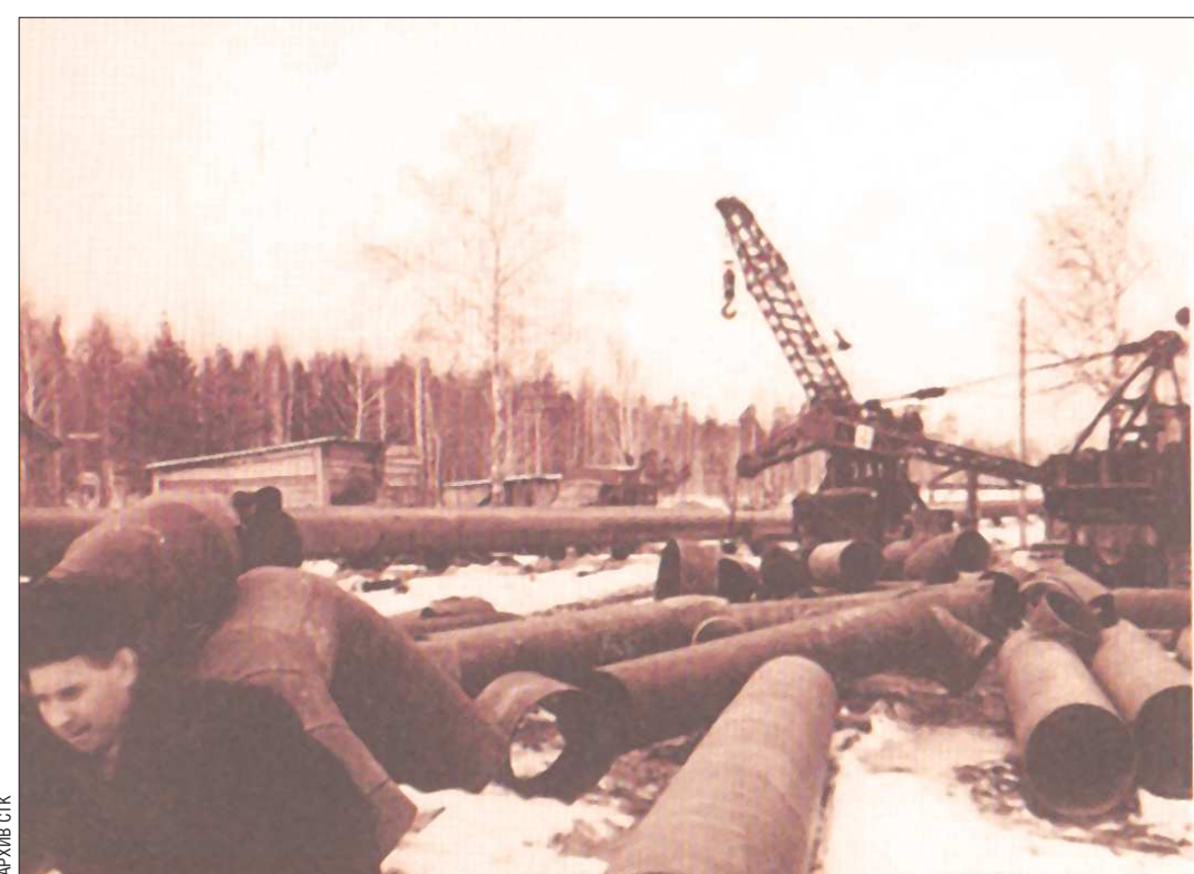
Магистраль, которую тянули от СУГРЭС до Екатеринбурга, не имела аналогов ни в стране, ни в мире

— По районному управлению «Свердловэнерго» издали приказ запустить теплотрассу. Мы включили насосы, стали подавать горячую воду в трубопроводы, и мощный комплекс заработал, — продолжает свой рассказ бывший директор Свердловских тепловых сетей. Как показала практика, этот способ теплоснабжения оказался одним из лучших. Между тем централизованная система представляет собой множество взаимосвязанных разнообразных и сложных объектов, каждый из которых влияет на качество работы