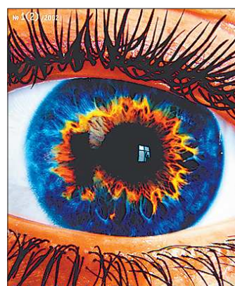
Журнал «Ю» – качественное глянецовое (по техническим характеристикам) издание, которое печаталось в Праге. В свет вышел всего один выпуск, хотя второй уже был полностью готов

«Микс – мы и культура сегодня» появился в 1989 году. Он содержал научные статьи, переводы и публицистику. Для умного литературного журнала «Микс» имел небывалый по современным меркам тираж – 25000 экземпляров. «Витта» – первый глянецовый журнал, появившийся в середине 90-х не только в Екатеринбурге, но и на Урале. Сейчас всё это уже не просто журналы, а история конкретных людей: изда-