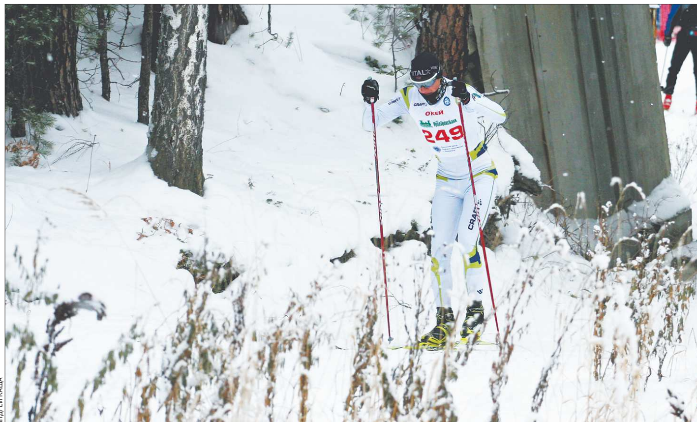
Трава по пояс стала антуражем Кубка России в Новоуральске в декабре прошлого года