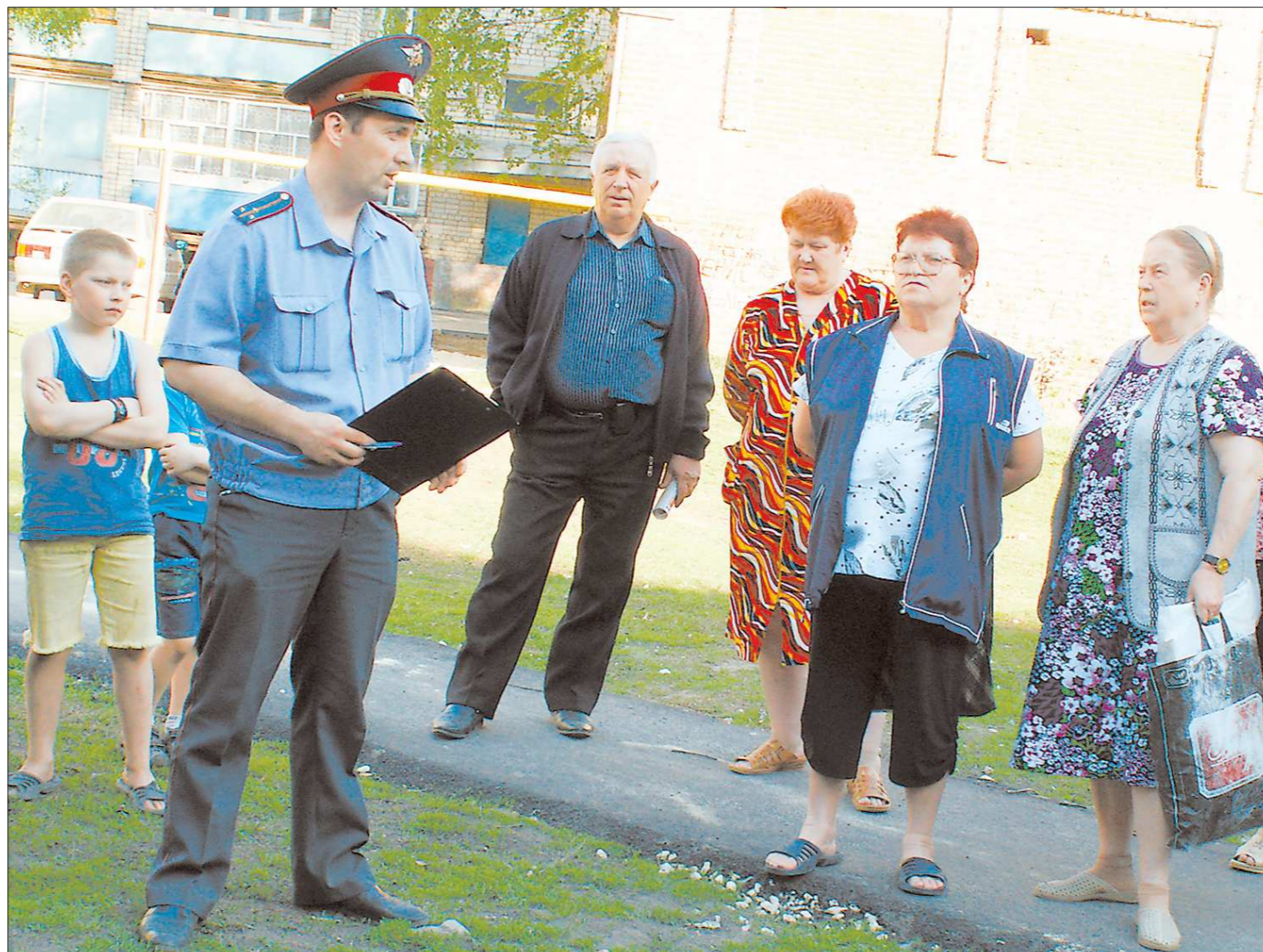
Кто станет лучшим, выбрать нам: если вы довольны работой своего участкового — голосуйте за него

На этот раз график движения (катер ходит три раза в неделю) совпал со сроком сдачи документов из местной ТИК в избирком. Вчера рано утром катером «Заря» доставили бюллетени через Тавду, а в полдень общие результаты голосования в Унже-Павинском сельском поселении были размещены в Государственной автоматизированной системе (ГАС) Российской Федерации «Выборы», и о них узнала вся страна.