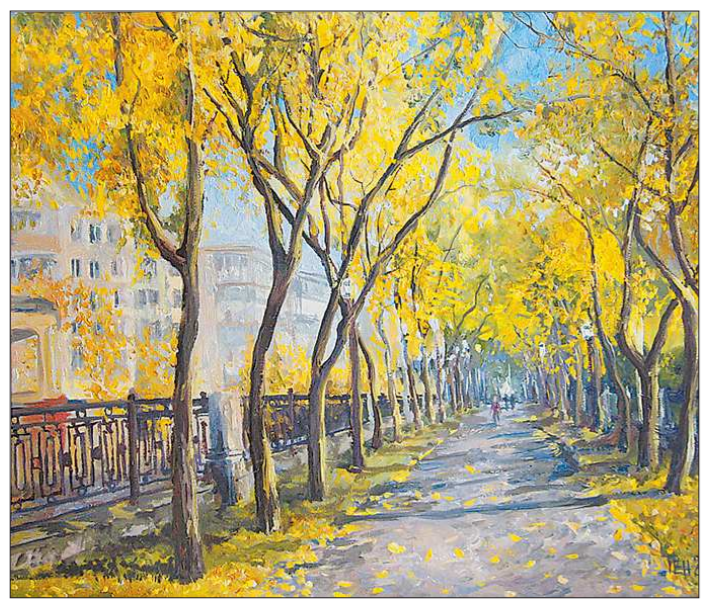
Работа Екатерины Тютини «Аллея. Сентябрь»