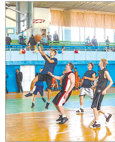
После торжественного открытия в обновлённом зале состоялась товарищеская встреча по баскетболу

В минувшие выходные состоялось долгожданное открытие зала спорткомплекса «Горняк». Он был закрыт на ремонт пять лет назад, сообщает портал Кушва-онлайн.ру.