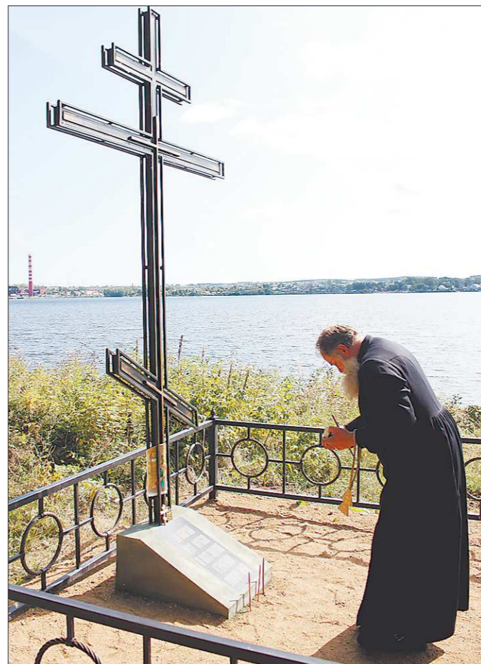
Надпись на постаменте гласит: «Сей крест поставлен на земле упокоения старообрядцев режевской земли».

Маленький городок Реж Свердловской области. Береговой склон у пруда в районе 7 Ветров.