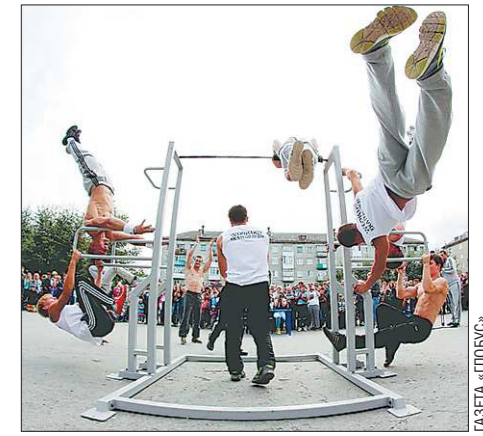
Любители воркаута считают главной составляющей занятий уличный дух свободы

Первый в Серове фестиваль силовых упражнений «Workout fest» прошёл у кинотеатра «Родина», пишет газета «Глобус».