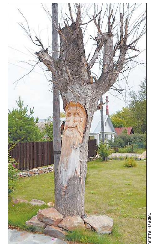
Старый тополь больше не нагоняет тоску на местных жителей

УЧРЕДИТЕЛИ И ИЗДАТЕЛИ: Губернатор Свердловской области, Законодательное Собрание Свердловской области.