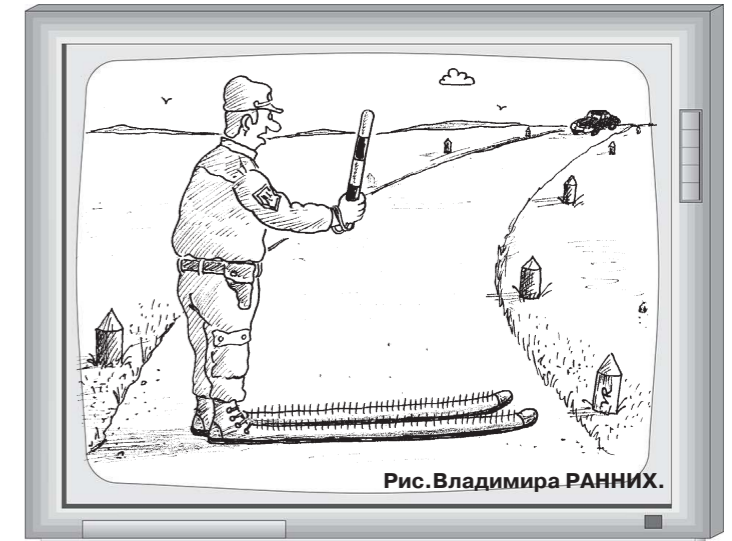
Рис. Владимира РАННИХ.