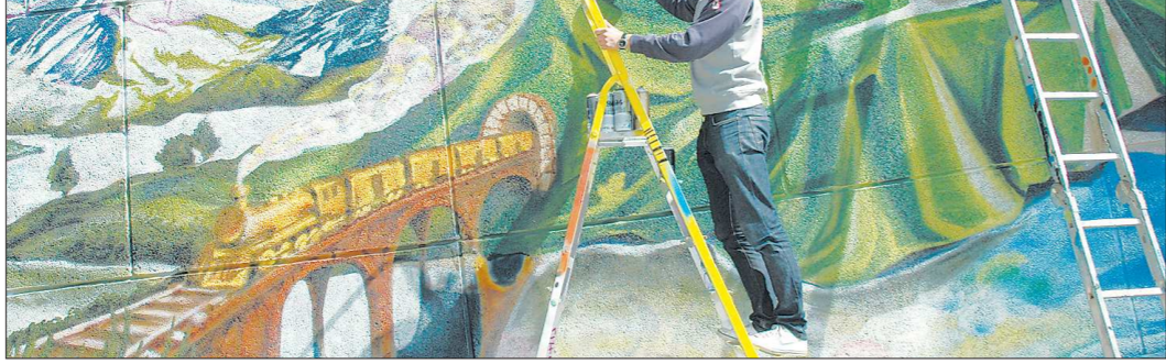
Опытный мастер жанра Константин Рахманов показывает стихийным художникам-граффити, как можно достойно выйти из тени.

Вчера уличные граффити (райтеры) получили легальную возможность нанести на стену здания железнодорожного вокзала свои замысловатые картинку. По старой привычке, опасно оглядываясь, парни водили струей краски из баллончика. А ведомственная охрана пристально взидала на их действия. На этот раз всё было легально: эскиз рисунка согласован с руководством РЖД, кроме того, железнодорожники предоставили для будущей картины почти сто баллончиков краски.