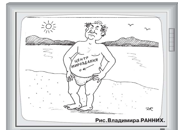
Рис. Владимира РАННИХ.