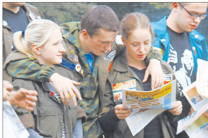
Многие студенты выросли на «Новой Эре» — знают газету со школы

С завершением лета заканчивают работу оздоровительные лагеря в Свердловской области. А значит, подходят к концу и вожатские смены педагогических отрядов. В конце целины студенты-педагоги традиционно собираются на берегу Исети в районе посёлка Палкино. Корреспонденты «Областной газеты» заглянули к студентам на прощальный костёр и разыграли среди них билеты на концерт группы «Корн».