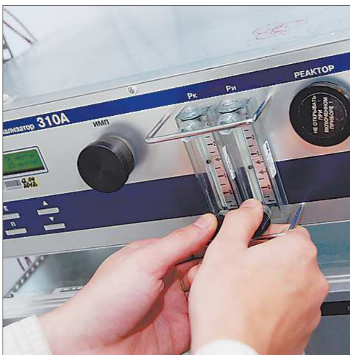
«Обоняние» в автоматическом режиме может улавливать выбросы даже заморских вулканов

Кстати, жители близлежащих домов, наверно, даже не догадываются, какой уникальный объект находится у них под боком. Это совсем неприметная металлическая будка, выкрашенная в