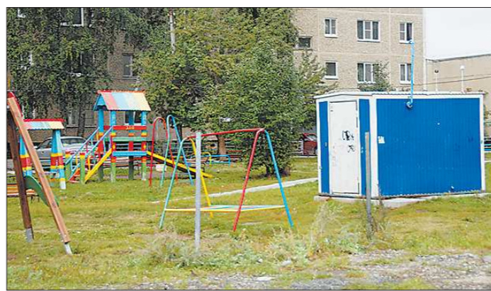
В этой неприметной будке, выкрашенной в синий цвет, трудно опознать уникальный объект