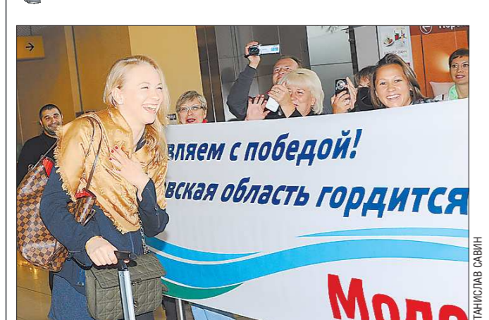
Анжелику Тиманину – первую в истории спорта Свердловской области золотую медалистку Олимпийских игр в синхронном плавании – на родине встречали как настоящего героя. Уже в аэропорту Кольцово несколько десятков её поклонников растянули поздравительный баннер и отметили появление нашей «русалочки» в зале ожидания градом аплодисментов. Но основные чествования Тиманиной ещё впереди.