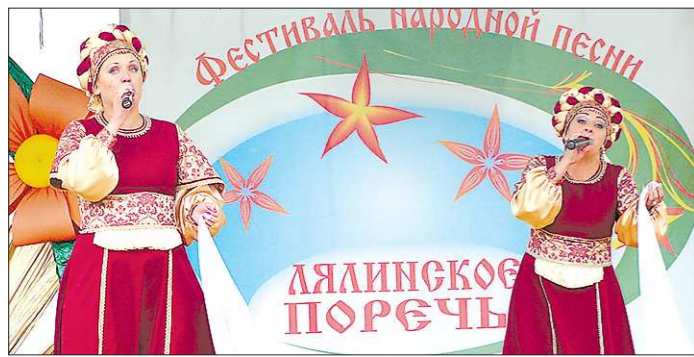
В выступлении артистов на «Лялинском порестье» немаловажную роль играли их костюмы