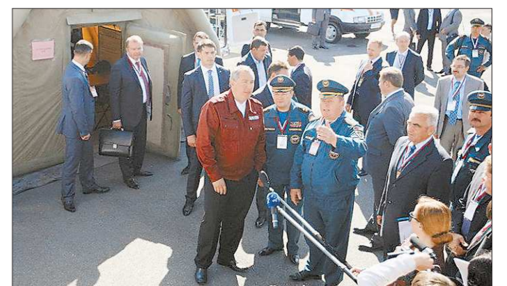
Один из снимков, которые вице-премьер выставил в Facebook

«Сегодня здесь много гостей из самых разных уголков нашей огромной Родины», — заявил Владимир Путин, приветствуя гостей праздника, посвящённого 1000-летию единения Мордовии с народами российского государства. — И сразу видно, что мы все очень разные, но только тогда, когда мы вместе, мы — Россия».