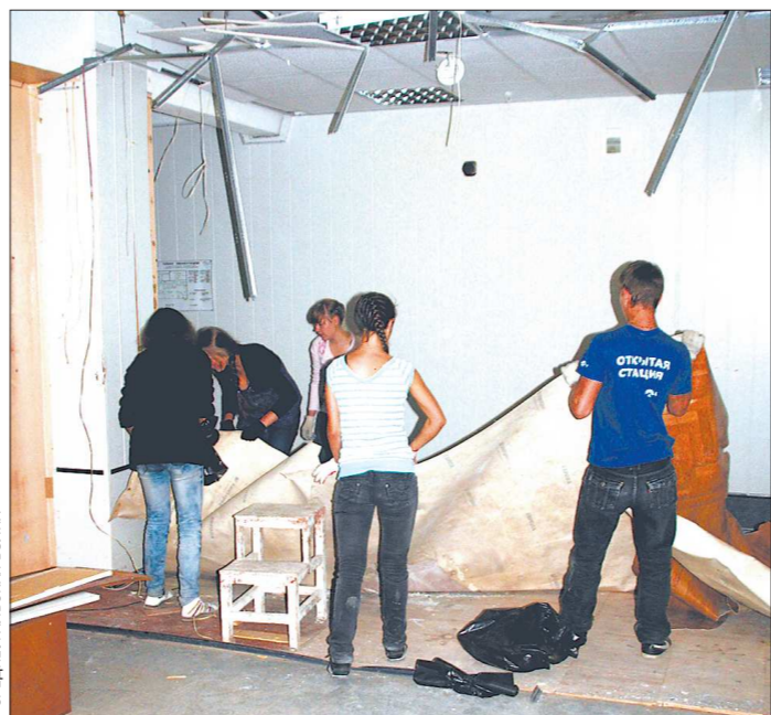
Воспитанники клуба «Молодые резервы» помогают с мелким ремонтом, чтобы скорее заселиться в новое здание

А ведь речь идёт даже не об одном десятке ребят. В восьми секциях клуба занимается 158 человек — от дошкольцев до подростков. В «Молодых резервах» работает военно-патриотический и краеведческий клубы, фольклорный ансамбль, клуб юных корреспондентов и семейный хоровой клуб. Кроме этого, здесь создана молодёжная биржа труда, которая находит работу ребятам с 14 лет. Все они активно занимаются благоустройством города: прибирают парки и улицы, сажают цветы, красят заборы. В секции приходят и проблемные дети. Некоторые из них не живут до-