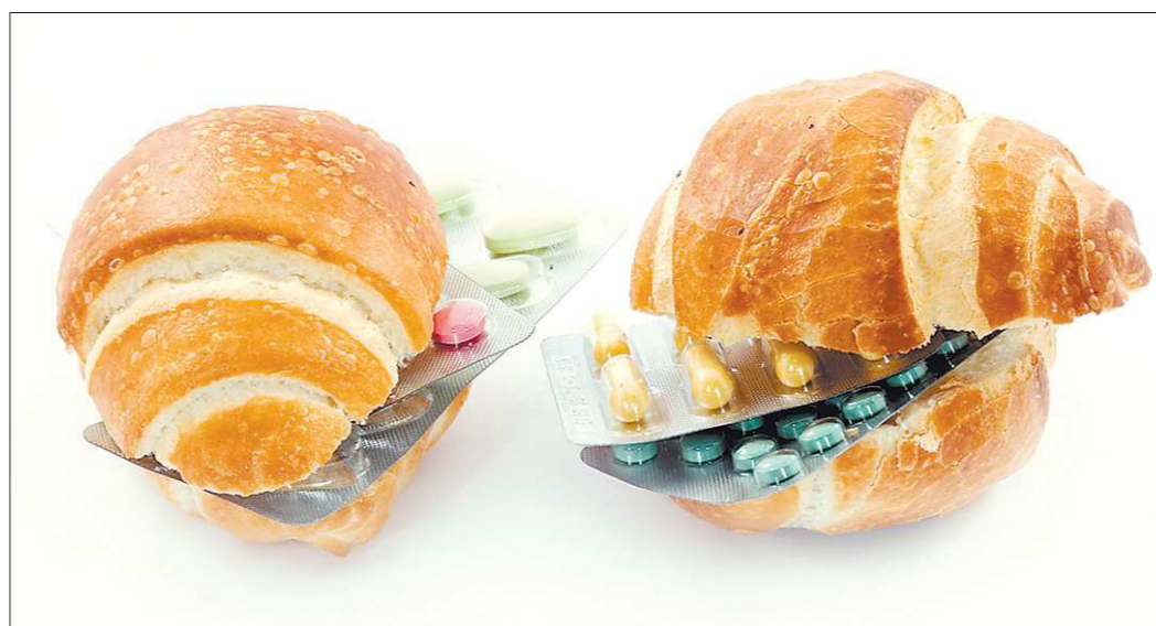
В рекламе БАДов производители частенько упирают на лечебные свойства своего продукта, хотя в реальности они могут быть полезны лишь для обогащения питания, получения недостающих витаминов и микроэлементов

На сайте Федеральной антимонопольной службы опубликованы поправки к закону «О рекламе» и Административному кодексу, которые обязуют рекламодателей предупреждать о нелекарственном характере биодобавок (до сих пор это требование жёстко распространялось лишь на упаковку добавок). Проект, который в осеннюю сессию рассмотрит Госдума, значительно повышает ответственность СМИ и прочих распространителей за ненадлежащую рекламу. Так, в сообщениях, распространяемых в телепрограммах, продолжительность предупреждения о том, что это не лекарство, должна будет составлять не менее пяти секунд, а на радио — не менее трёх. Что касается рекламы, распространяемой другими способами, предупреждение должно занимать не менее десяти процентов рекламной площади. За нарушение этих правил