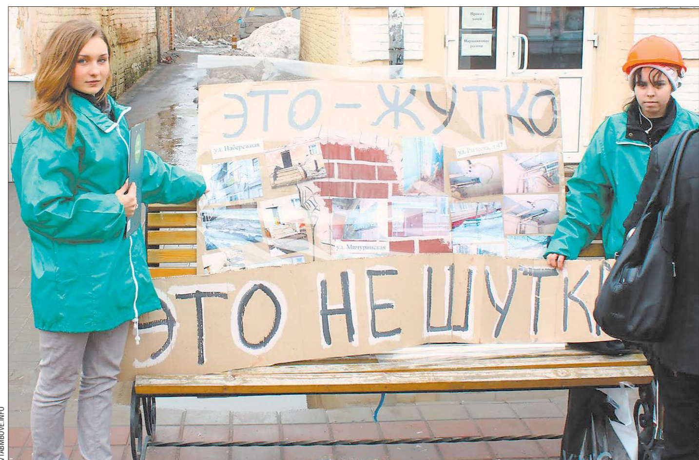
Решение предавать гласности имена недобросовестных УК вызвано ростом жалоб на жилищно-коммунальные проблемы

По его словам, новоуральские решили создать общественную комиссию, куда войдут участники инициативной группы, бывшие работники и люди, продолжающие работать на заводе. Они будут контролировать процесс поступления денег. Напомним, что общий же долг по зарплате перед бывшими сотрудниками «АМУРа» составляет порядка 34 миллионов рублей.