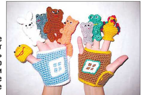
Эти вязаные персонажи помогут малышам развивать координацию движений и творческое мышление