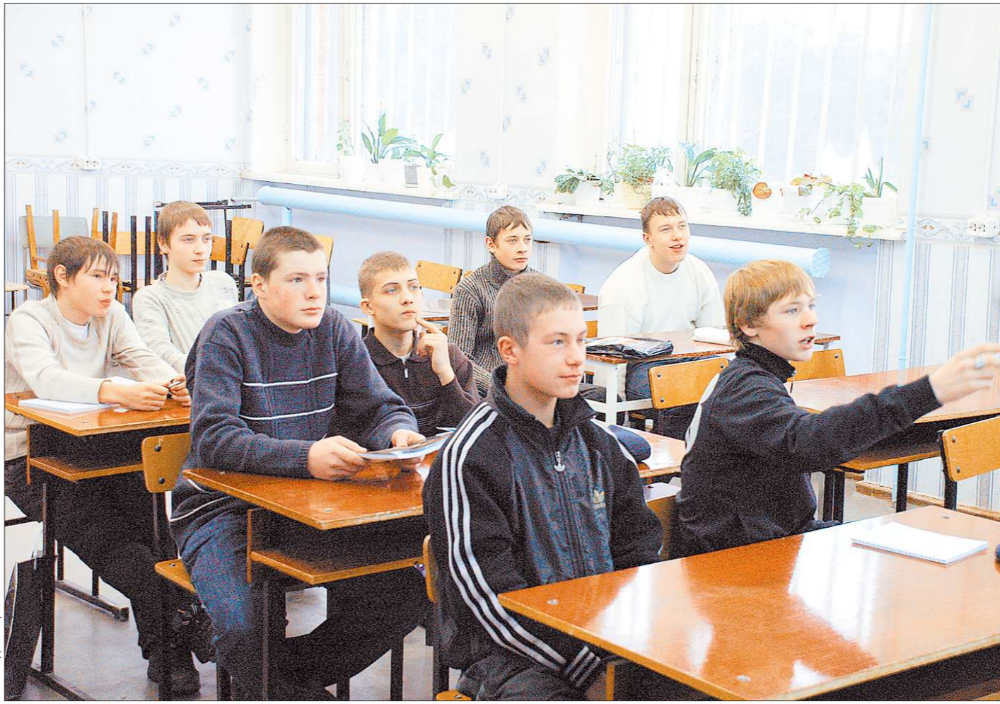
Этим ребятам предстоит несколько «репетиций» ЕГЭ