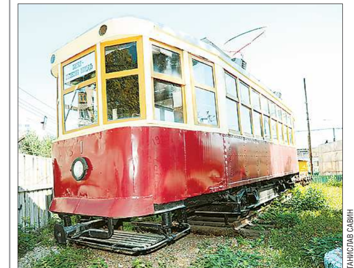
Вагон серии X, выпущенный в 1929 году — старейший из сохранившихся раритетов. На нём — табличка первого трамвайного маршрута в городе, Вокзал — Цыганская площадь (ныне — улица Фрунзе, где сейчас расположено Южное депо)

В 2006 году за экспозицию «Транспорт Екатеринбурга конца XIX — начала XX века» музей получил Гран-при в конкурсе «Лучший музейный проект года», организованном управлением культуры администрации столицы Урала.