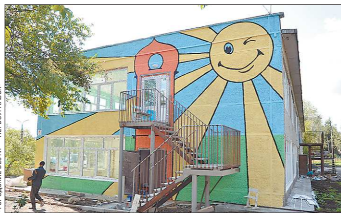
Ещё недавно эта типовая коробка в Первоуральске была не востребована...

В некоторых городах местные власти начали продуктивное сотрудничество с частными лицами, готовыми заняться организацией учреждений дошкольного образования. Нуж-