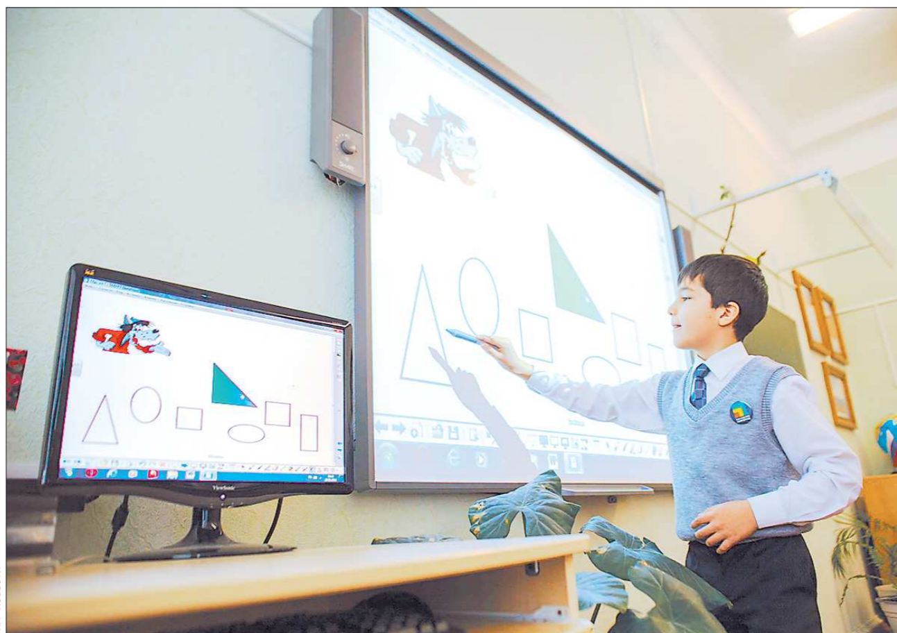
К такой доске выходить не страшно, а даже интересно

делает для улучшения благосостояния сотрудников образовательных учреждений. В частности, средний уровень зарплат педагогов в школах Среднего Урала уже превысил 27 тысяч рублей. До конца года позитивные изменения произойдут и в детских дошкольных учреждениях: зарплата их работников поднимется до уровня средней по системе образования.