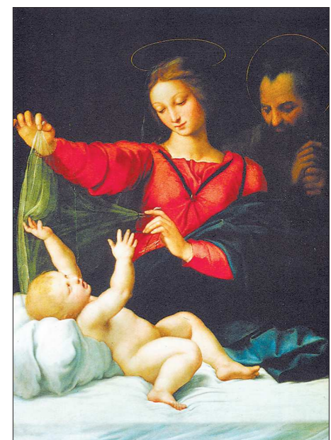
«Святое семейство». С этого полотна было сделано множество копий, а претендентов на оригинал в мире существует два. Один хранится в нижнетагильском музее, другой — в музее д'Орсе в Париже.

Минкульт готов платить телеканалам за пропаганду культуры