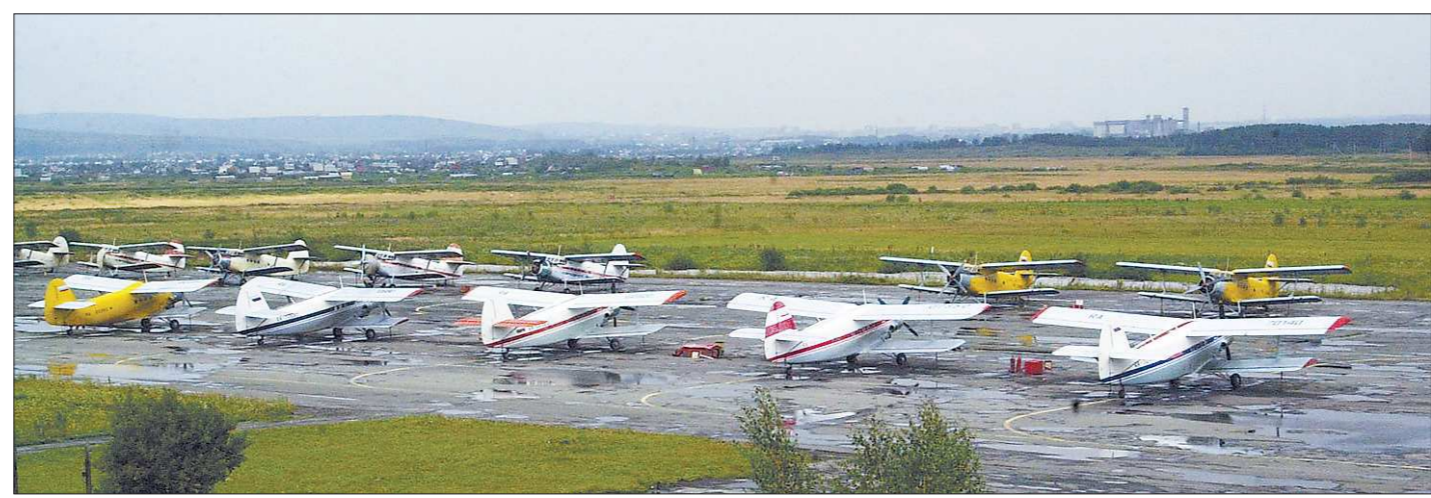
В советские времена летом из областного центра ежедневно выполнялось до 50 регулярных рейсов на самолётах такого типа