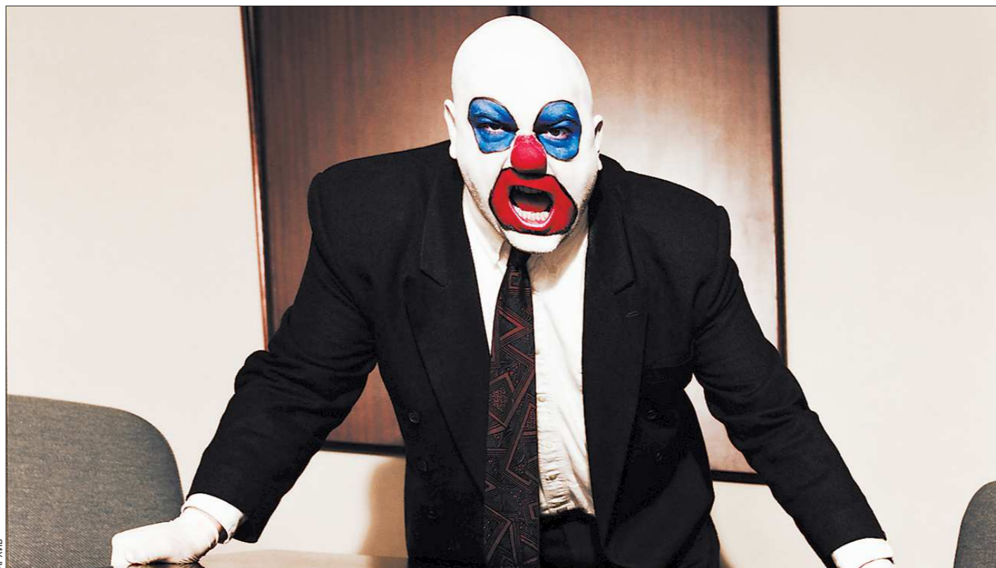
Нецензурно выражающийся политик выглядит не только смешно, но и глупо

А вчера стало известно, что руководитель аппарата правительства России Владислав Сурков назначен ещё и ответственным и за взаимодействие исполнительных власти с религиозными организациями.