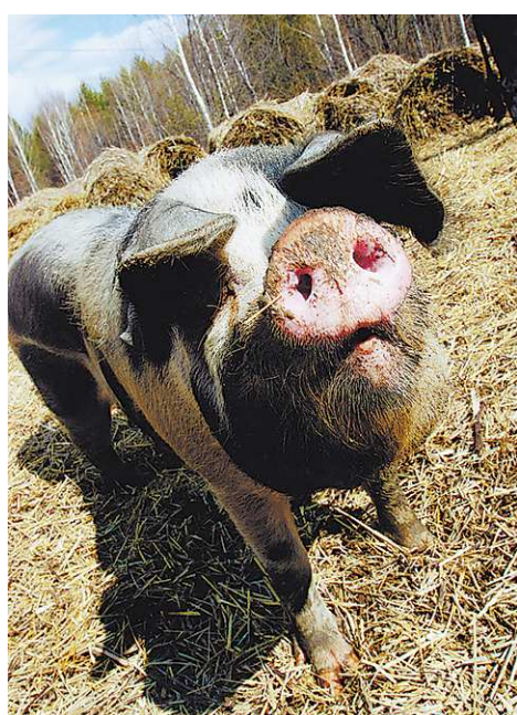
Иногда люди на отдыхе кое-кого напаивают...

Существует и другая, более веселая причина, зачем стоит тонуть в лужах – это неписанный закон любого отдыха на природе. Один мужчина озвучил его, когда спорил с другим по поводу места: «У меня тачка больше, вот и место моё!». Машина действительно была большой, а так как ехать ей пришлось через грязевую овраг, она оставила на траве за собой