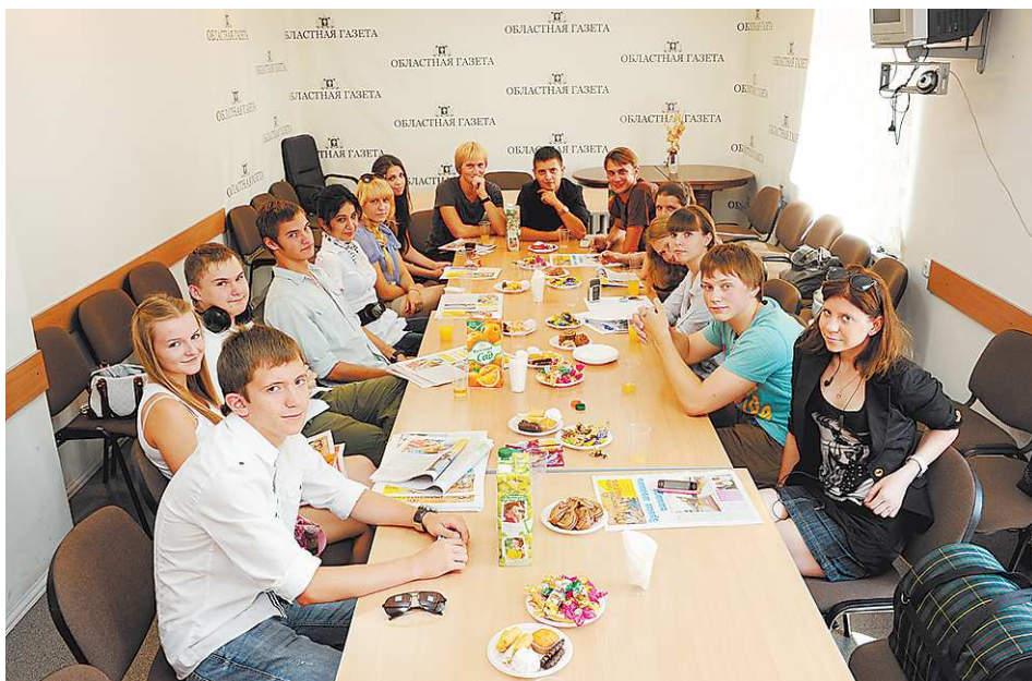
На этой фотографии далеко не все пришедшие гости – снимок сделан в самом начале встречи.

К сожалению, год от года сокращается количество бюджетных мест на журфаке, на который, как правило, нацелены наши авторы. «Новая Эра» дала в этом году около 30 харак-