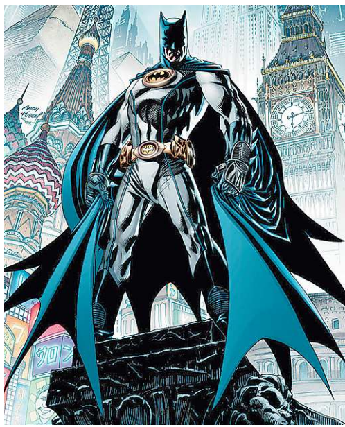
На картинке слева – герой комикса, как он выглядел примерно 50 лет назад. А справа – Бэтмен в представлении Кристофера Нолана в наше время.

Вернуть супергероев с пыльной полки решила киноиндустрия. И это действительно принесло ей большую кассу, правда, не сразу. Первые попытки экранизировать комиксы предпринимались ещё в 1970-е и оказались провальными. Первой большой удачей стала экранизация «Супермена» с Марлоном Брандо в главной роли в 1978 году. Фильм был удостоен премии «Оскар». Его смотрели не только подростки, но и их родители, которые и не подозревали, что из детских фантастических «картинок» мо-