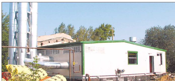
Специалистам придётся устранить «водный дефицит», чтобы блочные котельные заработали