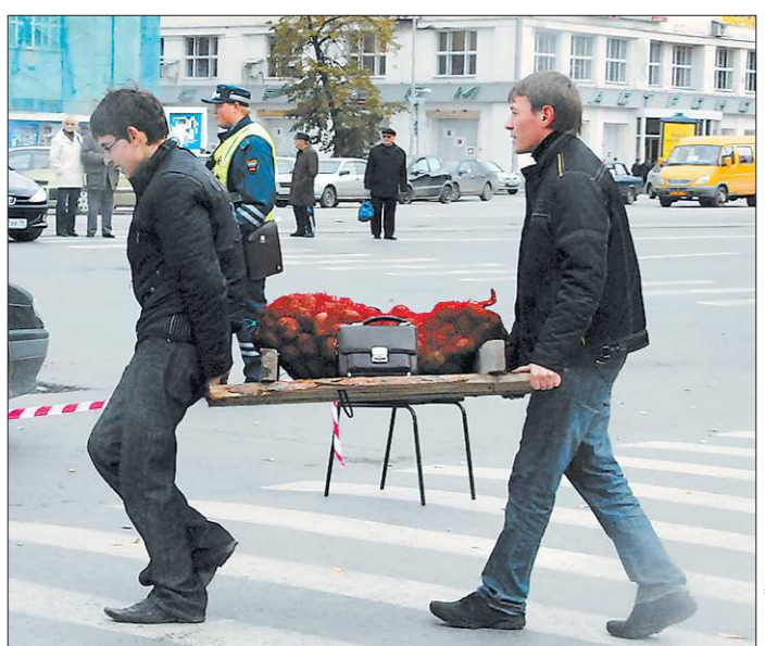
Рост цен на продукты питания у нас зачастую сопровождается ажиотажным спросом на них. При этом накопленные впрок потом иногда приходится отправлять на свалку

А вот цены на хлеб 1 сорта и смешанной муки в области с 1 января 2011 года практически не менялись, оставаясь на том же высоком уровне. Несмотря на то что зима 2012 года ознаменовалась резким падением цен на зерно и муку (урожай 2011 года был отменным), хлеб не дешевел. Это — к вопросу о том, как зависит в нашей стране цена на продукты от стоимости зерна. Зависит, но не всегда.