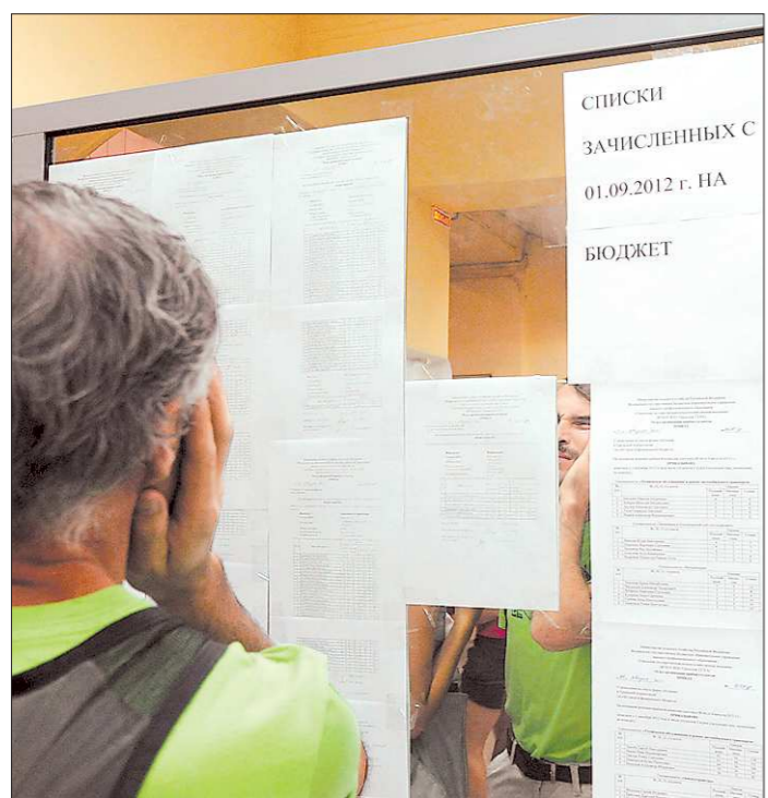
Большинство абитуриентов следит за результатами зачисления через Интернет. Но некоторые всё же предпочитают бумажную версию

Как сообщила пресс-служба Центрального военного округа, в дни празднования юбилейных дат жители Екатеринбурга смогут увидеть на больших экранах документальный фильм об истории ВВС и ПВО Центрального военного округа, редкие кадры из истории военной авиации России.