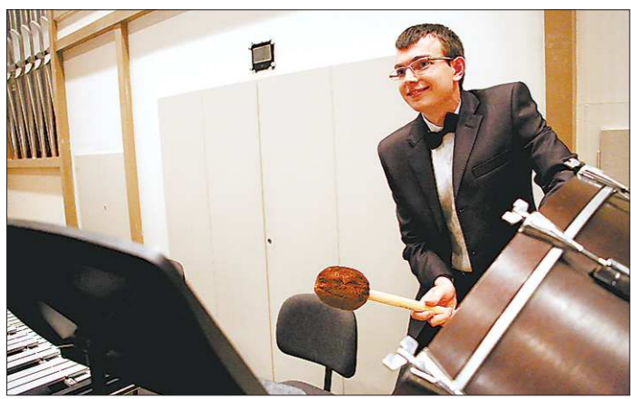
В Берлине молодые громко заявляют о себе