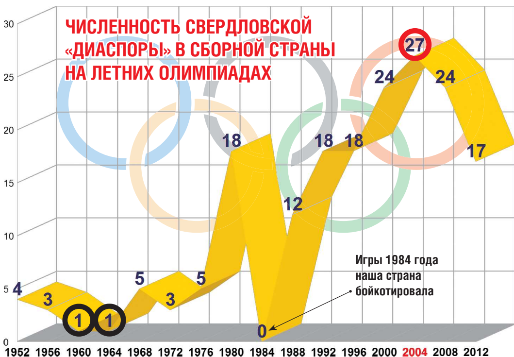
На Олимпиаду-2012 поехали всего 17 свердловских спортсменов. Это самый низкий показатель за всё время существования независимой России