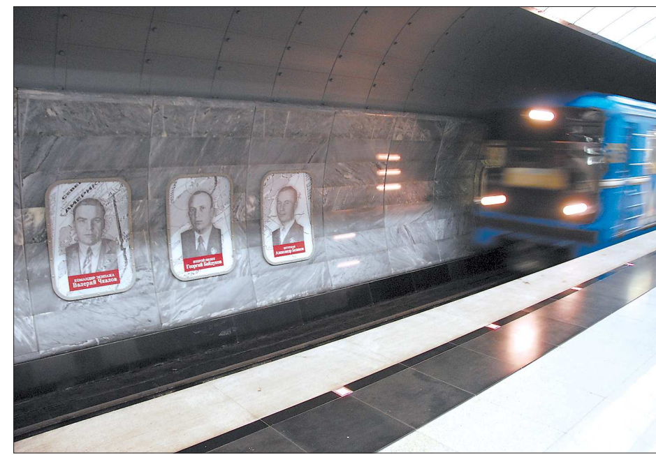
Новая станция украшена портретами лётчиков из экипажа Валерия Чкалова