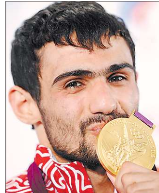
За победу на Олимпиаде Арсен Галстян получит от краснодарской строительной компании «Мерседес» и полностью обставленную квартиру

После двух первых дней Олимпиады-2012 в неофициальном медальном зачёте сборная России занимает 12-ю позицию.