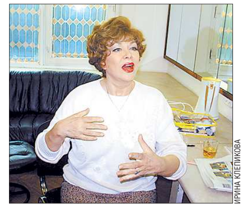
Эдита Пьеха – «ОГ»: «Я никогда не скрывала свой возраст. При этом всегда старалась, выходя на сцену, дарить слушателям ощущение Красоты»

Сегодня юбилей отмечает выдающаяся российская эстрадная певица Эдита Пьеха, главный титул которой (при многочисленных званиях) – народная любимица.