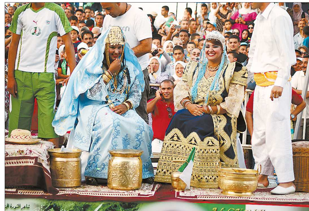
Национальные костюмы и ремесла — неотъемлемая часть парада-дефиле

—Так в том то и дело, что нет, а это один из показателей активности города как раз и есть! Вообще — ни кранов, ни котлованов, ни одного нового строительства не увидели. Локальные стройки, наверное, есть. То, что мы увидели, построено красиво, но 55-60 лет назад, во французском колониальном стиле. Всё время не