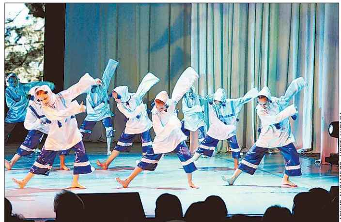
Эта «Куролесиса» (танцуют девочки 10–12 лет) может покоришь Италию

Перед отъездом стало известно, что наш коллектив уже заявлен в качестве участника гала-концерта, который состоится восьмого августа в Римини.