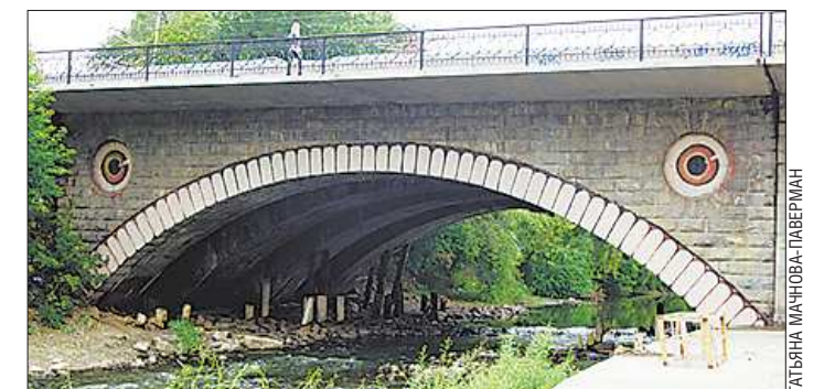
На 82-м году жизни мост через Исеть по улице Куйбышева улыбается жителям столицы Урала во все пятьдесят зубов