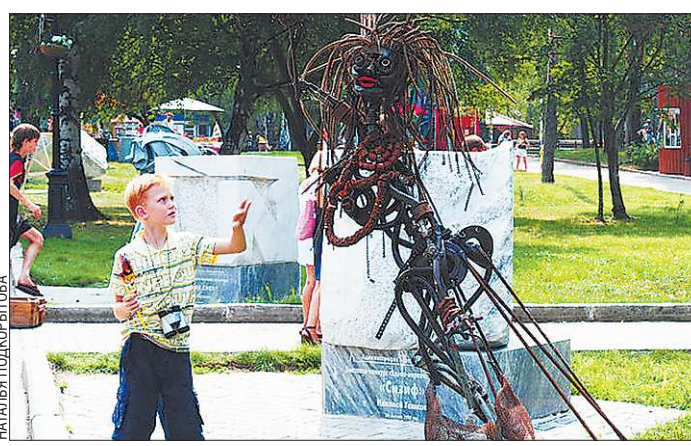
В прошлом году в центре внимания художников, участвовавших в фестивале «ЛОМ», был металлолом, из которого создавались скульптуры. О том, с каким материалом придётся работать конкурсантам на сей раз, пока организаторы не распространяются

– Сейчас мы, по сути, занимаемся реабилитацией отходов. В этой идее заложены важ-