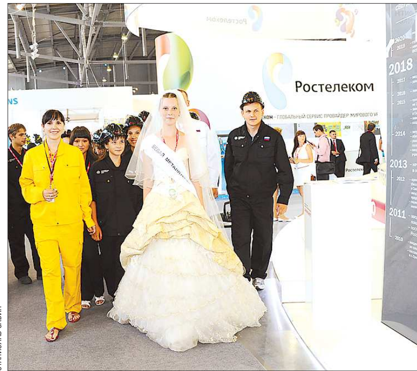
На смену чёрной металлургии пришла «белая»: так образно новотрубники Первоуральска представили своё современное производство