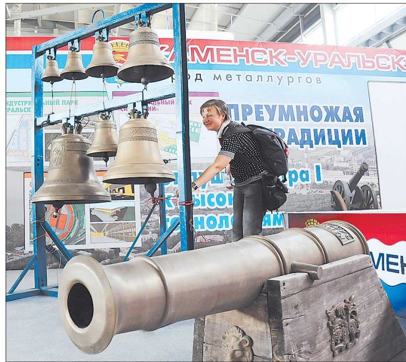
Урал знаменит колоколами и пушками ещё со времён заводчиков Демидовых