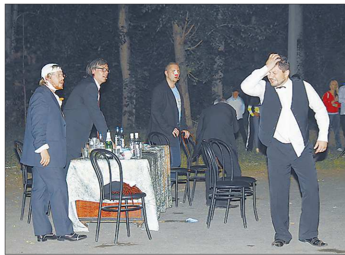
Сборная режиссёров Свердловской области представляет...