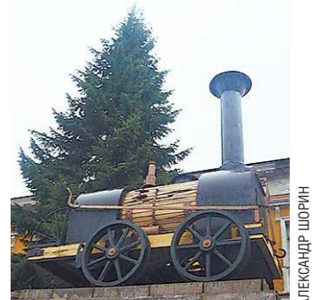
Копия первого паровоза Черепановых стоит сейчас на постаменте в Нижнем Тагиле у входа в краеведческий музей