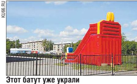
Этот батут уже украли

На прошлой неделе в Каменске-Уральском от Дворца спорта «СОК «СИНРА» был украден надувной батут, принадлежавший одному из каменских предпринимателей, информирует портал ku66.ru.