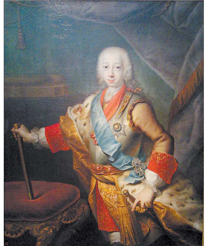
«Он не был зол, но ограниченность его ума, воспитание и естественные наклонности выработали из него хорошего прусского капрала, а не государя великой империи», — написала в своих записках Екатерина Дашкова о Петре III