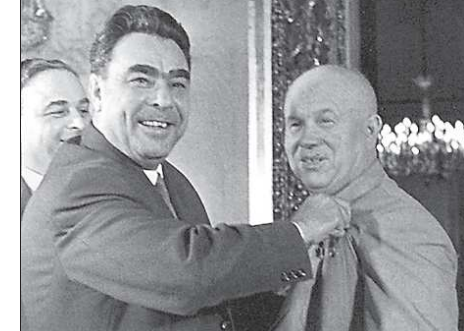
События 13-14 октября 1964 года – классика дворцовых переворотов. Раздражавший всех своей непредсказуемостью Никита Хрущёв был обложен со всех сторон: на стороне Леонида Брежнева – армия, спецслужбы, союзная и региональная партийные элиты. Первому секретарю ЦК оставалось лишь подписать прошение об отставке