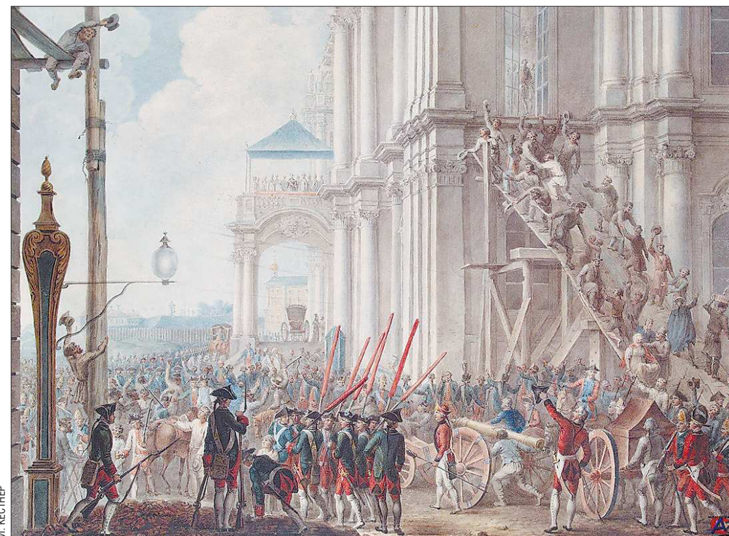
Екатерина на балконе Зимнего дворца в день восшествия на престол. Новую российскую государыню на этом полотне почти не видно. Зато понятно, что творилось в тот момент на Дворцовой площади

А разве во времена Петра I или Сталина, скажете вы, подданным было «вмоготу»? Тем не менее власть оставалась незбылемой! Ну, во-первых, мастера политической интриги существо-