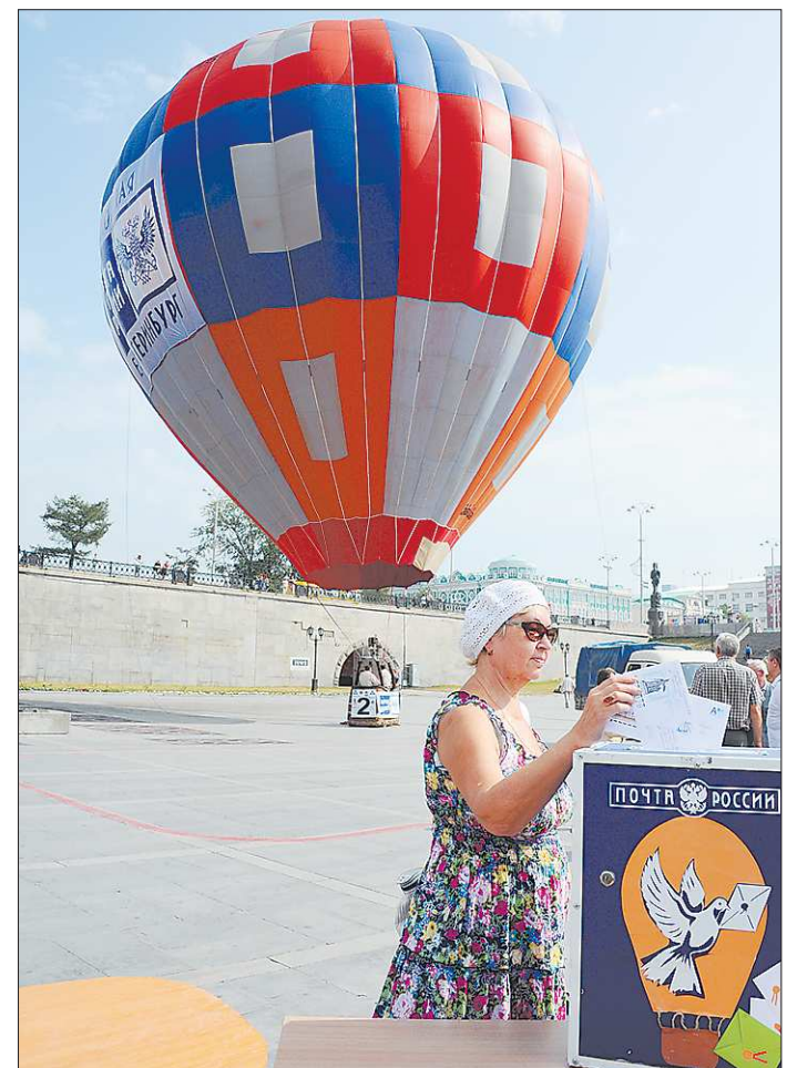
Старое присловье «Лети, письмо, с приветом, вернись с ответом» вновь стало актуальным