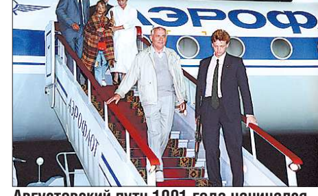
Августовский путч 1991 года начался как типичный дворцовый переворот. Заговорщики не учли одного: вкушавшие политических свобод москвичи вышли на защиту Белого дома. Провал заговора означал переворот «наоборот»: произошёл мгновенный демонтаж прежней политической системы