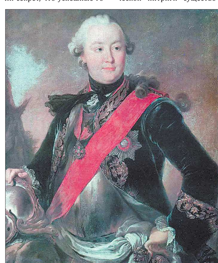
В письме к Вольтеру Екатерина II назвала Григория Орлова «героем, подобным древним римлянам времён цветущего состояния Республики, и имеющим одинаковую с ними храбрость и великодушие»