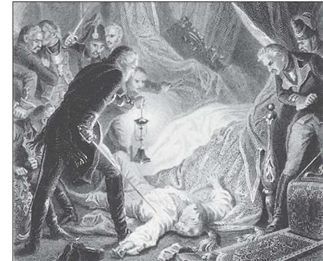
Боявшийся заговоров Павел I решил построить для себя безопасную резиденцию – Михайловский замок. Здание со всех сторон было окружено водой, и попасть в него можно было только через мосты, охранявшиеся часовыми. Тем не менее через сорок дней после переезда в новый дворец, 12 марта 1801 года, Павел был убит в собственной спальне