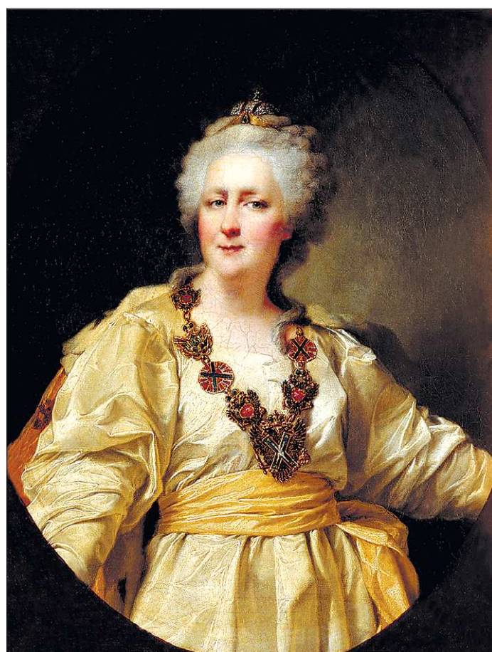
Д. Левицкий. Портрет императрицы Екатерины II

—Не совсем. В Екатеринбурге так делают некоторые управляющие компании, в основном, в частном секторе. У них получается, вот и мы решили попробовать. Сначала в посёлке Залесье, это недалеко от Садового. Там вообще не было места для сбора бытового мусора. Вроде бы привожется система. Начали мы в июне, пока вывезли только 30 мешков. Понятно, что привыкнуть нужно людям.