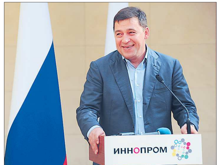
Губернатор доволен: к Иннопрому-2012 область подготовилась хорошо

жет и финансы, любитель научной фантастики. Министр обращался к подчинённым по имени и замы отвечали ему так же, что несколько резануло слух аудитории, и молчать она не стала. —Вы называете друг друга по имени. Это, конечно, любопытный демократический стиль. Но образование — консервативная вещь. Стиль можно менять, но так легко потерять традиции, — отметила правозащитница Светлана Ганушкина. Говоря о проблемах образования, команда министерства приводила в примеры в основном московские школы. Низкая скорость Интернета на селе? Неправда, технология развивается быстро — посмотрите на мобильный Интернет в Москве. Школы в регионе не могут включиться в проект «Доступная среда» из-за отсутствия пандусов? Неправда, загляните в московские школы... Думается, что попытка министерства стать более открытым, позволит увидеть проблемы и за пределами Садового кольца. Дмитрий Ливанов приглашает к активному участию в разговоре и регионы через сайт минобрнауки.рф и Twitter, в котором ведут свои ленты министр и его подчинённые.