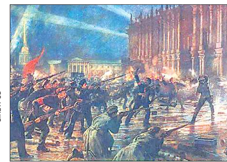
Восстание 25-26 октября 1917 года в Петрограде сами большевики долгое время именовали октябрьским переворотом. Вооружённый мятеж, начавшийся с захвата мостов, вокзалов и телеграфа, закончился штурмом Зимнего дворца и арестом Временного правительства. «Триумфальное шествие советской власти» очень скоро переросло в кровопролитную Гражданскую войну