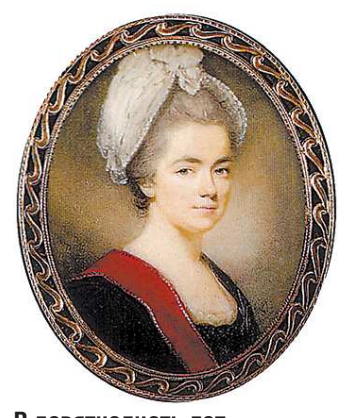
В девятнадцать лет Екатерина Дашкова вошла в историю, оказав неоценимые услуги Екатерине в её борьбе за власть. В тридцать девять – стала первой в мире женщиной, возглавившей Академию наук

да шёл восьмой год) Никиты Панина. Так это Дашкова продвигала Екатерину на трон? Или, наоборот, тридцатитрёхлетняя женщина, ставшая опытным политиком, использовала девятнадцатилетнюю «подругу» как агента влияния в самых разных придворных группировках?