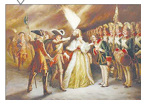
25 ноября 1741 года Елизавета Петровна свергла непопулярное правительство Анны Леопольдовны (матери годовалого императора Иоанна Антоновича). На рисунке – Преображенский полк присягает цесаревне Елизавете. По свидетельству очевидцев, гвардейцы буквально внесли дочь Петра I в Зимний дворец