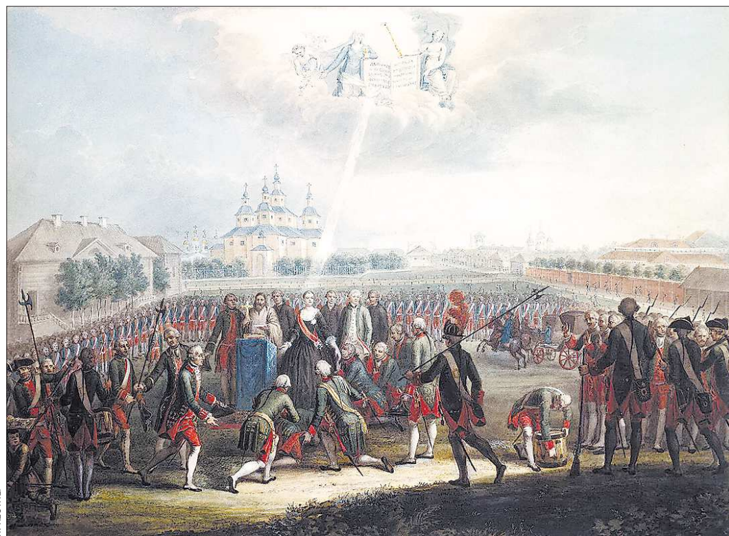
Утром 28 июня (9 июля) 1762 года Екатерина прибыла в Измайловский полк, который присягнул ей как самодержавной российской государыне. Отсюда начался триумфальный путь Екатерины в Зимний дворец