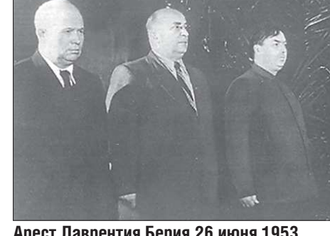
Арест Лаврентия Берия 26 июня 1953 года чем-то напоминает свержение всевысшего регента Эрнста Бирона 8 ноября 1740 года. Правда, Бирон продержался после смерти императрицы Анны Иоанновны лишь три недели, а могущественный шеф МВД наводил ужас на соратников после смерти Сталина более трёх месяцев. Как Бирон не ждал подхода от фельдмаршала Миниха, так и Берия не считал Хрущёва и Маленкова опасными политическими конкурентами...