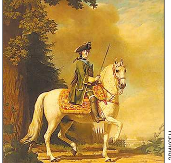
Это один из любимых портретов императрицы Екатерины. В мундире офицера Преображенского полка она возглавляла поход свергнутого с престола супруга

2 июля 1762 года, когда Пётр должен был прибыть в столицу, заговорщики собирались поджечь крыло Зимнего дворца. Предполагалось, что император-пироман обогатится там ринитом и «погибнет при несчастном случае». Но арест