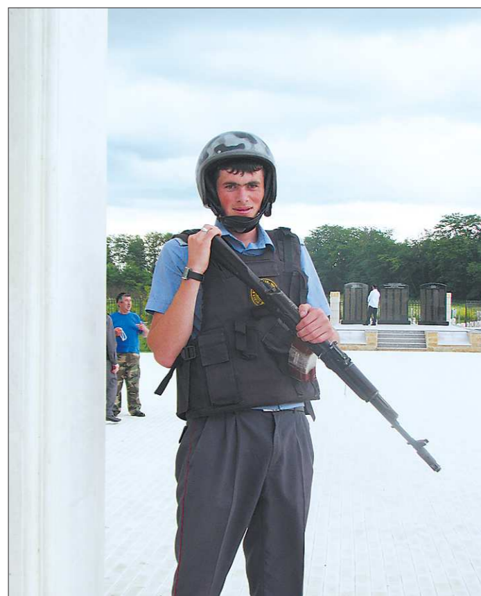
Ингушская молодёжь с большим желанием идёт на службу в армию и в силовые структуры. Военно-патриотическое воспитание в общепринятом понимании здесь отсутствует: издана обстановка на Кавказе воспитывала соответствующее отношение к своему дому, семье, народу. Сегодня ситуация тоже непростая, например, полицейской охране подлежат даже такое место, как мемориальный комплекс