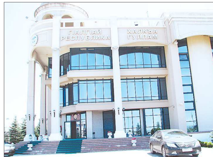
Здание Народного Собрания Республики Ингушетия в Магасе. Точно такое же здание у правительства республики. Да и другие административные здания похожи по стилю. Что и не удивительно: это административный центр, построен именно под задачи управления, где рядом, на одной территории, находятся резиденция главы республики, правительство, парламент и другие органы власти.

Много возможностей для этого предоставляет соглашение, подписанное депутатами Законодательного Собрания Свердловской области и Народного Собрания Республики Ингушетия: реализация совместных проектов в сфере образования, создание рабочих мест, благоприятного климата для совместного предпринимательства, развития экономики обеих регионов. Есть, например, идея создать в Ингушетию представительство Свердловской области, которое поможет в реализации этих проектов.