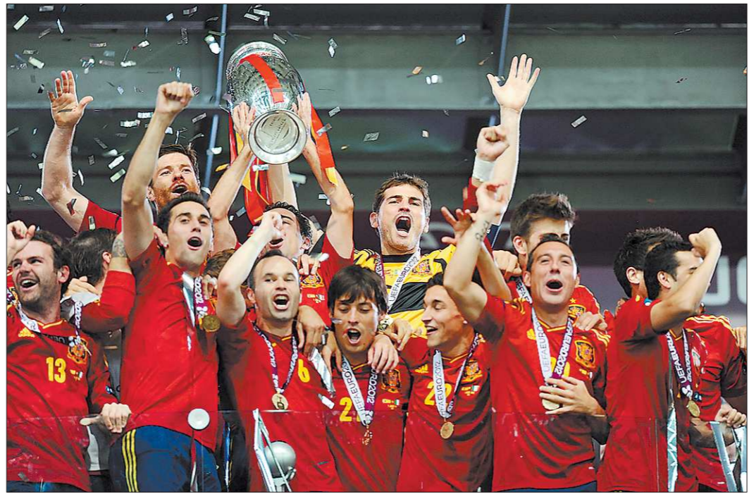
Сборная Испании стала первой, кому удалось выиграть три крупных турнира подряд

Но, с другой стороны, испанцам вполне возможно была нужна именно крупная победа. Ведь у нынешнего турнира есть все шансы остаться в истории не спортивными результатами, а всевозможными скандалами. Даже футбольных эрудитов ставит в тупик вопрос о том, кто выиграл чемпионат мира 2006 года. Зато и те, кто имеет смутное представление о форме футбольного мяча, без запинки вспоминают, что в финале то-