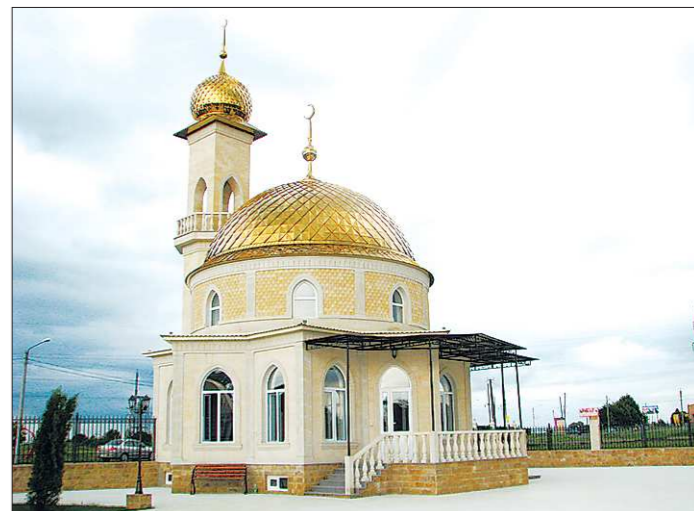
В каждом памятном для ингушей месте, будь то родовое кладбище или мемориальное захоронение, построена небольшая мечеть