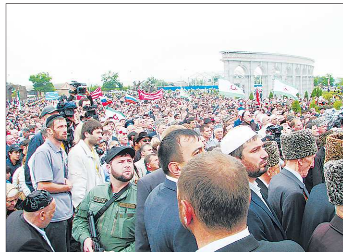
Одним из самых запоминающихся событий празднования 20-летия Республики Ингушетия стало открытие Мемориала памяти и славы. Людей пришло столько, что невозможно было пройти к мемориальным плитам с именами известных сыновей и дочерей республики, солдат и офицеров царской армии и советских времён, деятелей науки, культуры, искусства. Такое страстное желание почтить память соотечественников понятно: в немногочисленной республике имя героя — это слава, гордость и честь рода, тейпа, его известность, и если, хотите, значимость.

Магас стал столицей Ингушетии в декабре 2000 года, забрав столичные полномочия у Назрани. Название получил по наследству — так называлась столица средневекового государства Алания, разрушенная в 1239 году монголо-татарскими ордями. Нынешний город, по предположениям, располагается на месте средневековой столицы. Народное Собрание — законодательный орган Ингушетии, в парламенте 21 депутат, избранный на основе всеобщего голосования. (Для справки: в Законодательном собрании Свердловской области 50 депутатов)