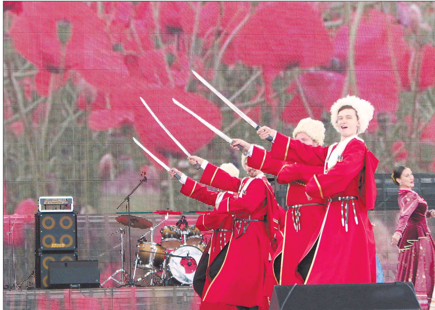
Поздравить соседей-ингушей с днём рождения республики приехали казаки-кубанцы

Депутаты Законодательного Собрания обрадовались, что и наш земляк тоже Юнус-Бек Евкуров был назначен гла-