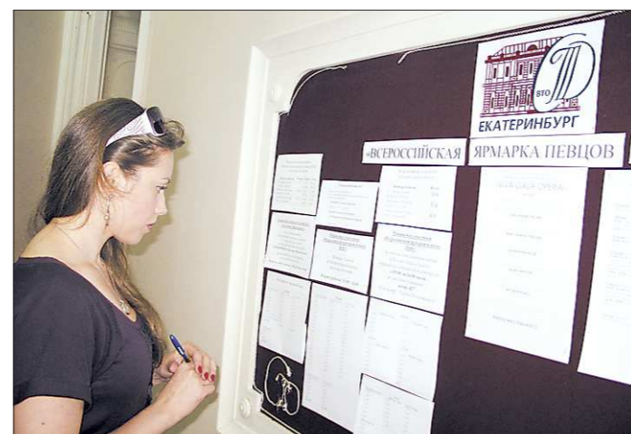
На Ярмарку-2012 заявились уже более 100 молодых вокалистов, около 20 руководителей музыкальных театров. Они так нужны друг другу...