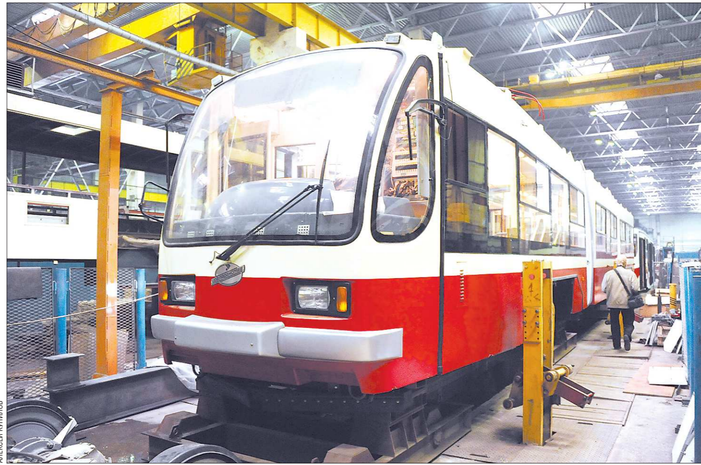
Создаваемый в цехах Уралтрансмаша низкопольный трамвай поможет решить проблему физической доступности городского общественного транспорта для инвалидов

В послании отмечается также, что пока «не удалось избежать практики постоянных фрагментарных изменений налогового законодательства», а «постоянное ожидание таких изменений препятствует реализации долгосрочных инвестиционных проектов по причине низкой предсказуемости налоговых издержек при разработке бизнес-планов».