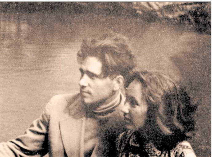
Путешествуя, Авдоины проплыли по многим русским рекам.