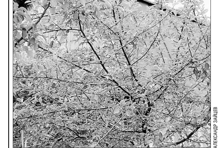
В нынешнем мае яблоневые кроны не украсились «белой фатой»

Плодовые деревья обиделись на прошлогодние морозы?