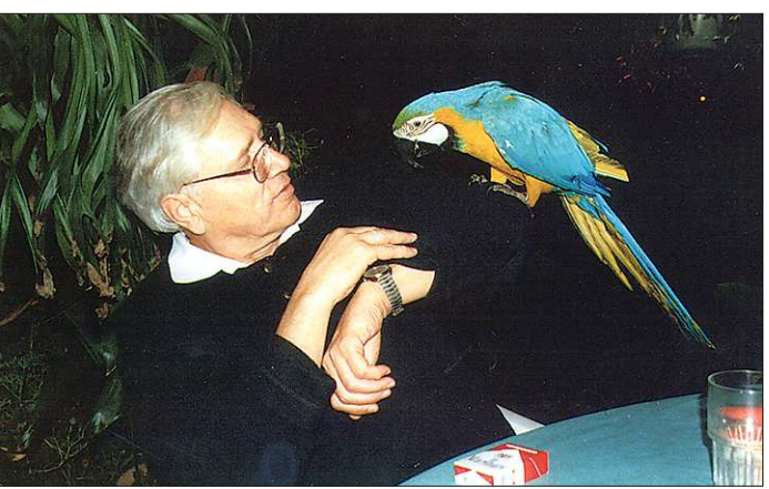
Америка. 1996 г. Огромный попугай ара с удовольствием «беседовал» с русским учёным

—Умные люди. Я знаю таких людей. В геологии — Обручев, Вернадский.