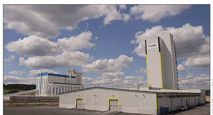
Предприятия, появившиеся на окраине Полевского, работают по самым современным технологиям.