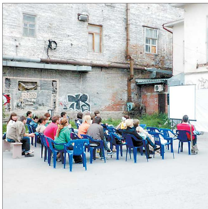
«Кино в подворотне» — милый городской проект, для которого нужны только белый экран, стулья в несколько рядов (иногда можно обойтись и без них) и бесплатный чай с печеньем. Лишь бы не было дождя да ворчливых соседей и представителей Российского авторского общества