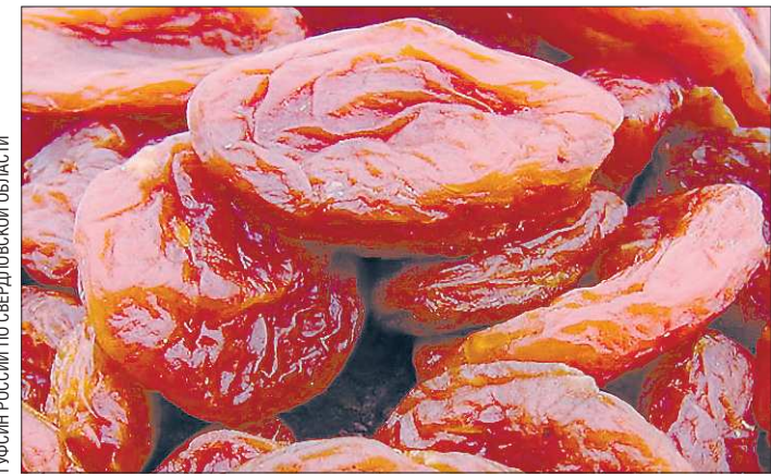
А на вид — обычные фрукты...

130 из 1290 апелляций по математике были удовлетворены. 105 — по части «С» и 25 — по причине ошибочной верификации меток — при сканировании компьютер неправильно распознал то, что написал ребёнок. Все ошибки исправлены и направлены на обработку в Центр тестирования. Конфликтные комиссии по другим предметам будут заседать до конца июня. Надежда повисеть свои результаты у выпускников ещё остаётся.