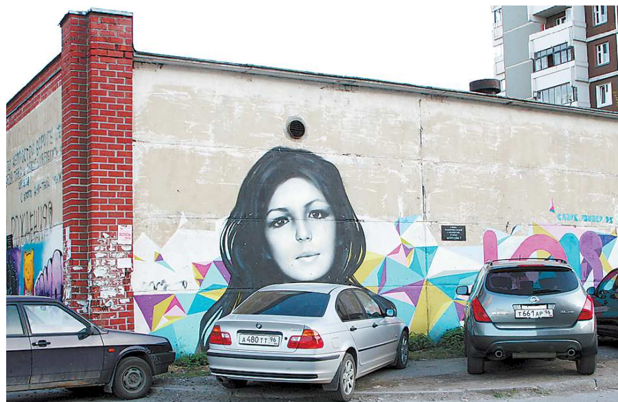
В уличном искусстве тоже есть свои таланты и дилетанты.

А внутри двора искусство «пачкать стены» хлынуло на меня всем своим разнообразием и красками. Увиденное