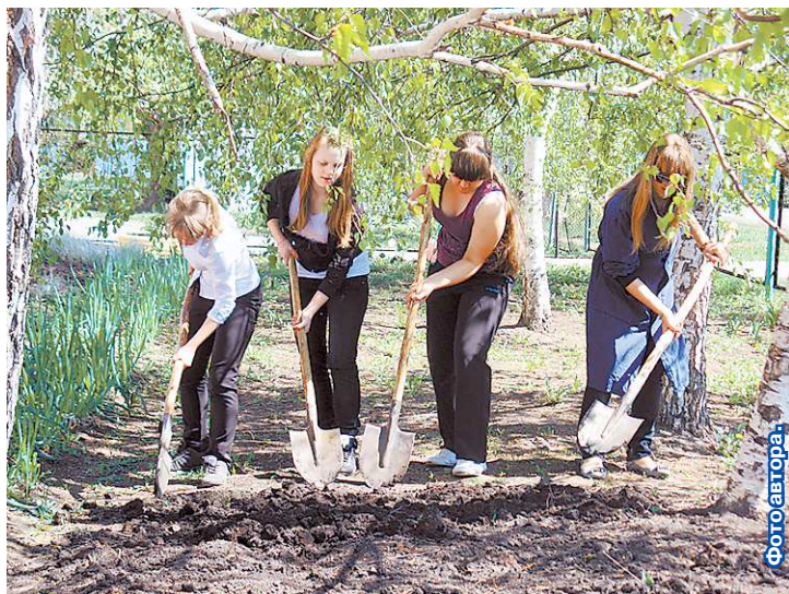
На школьной грядке – как на своей.

–В прошлом году даже у меня в домашнем огороде такой огромной свеклы, как здесь, не