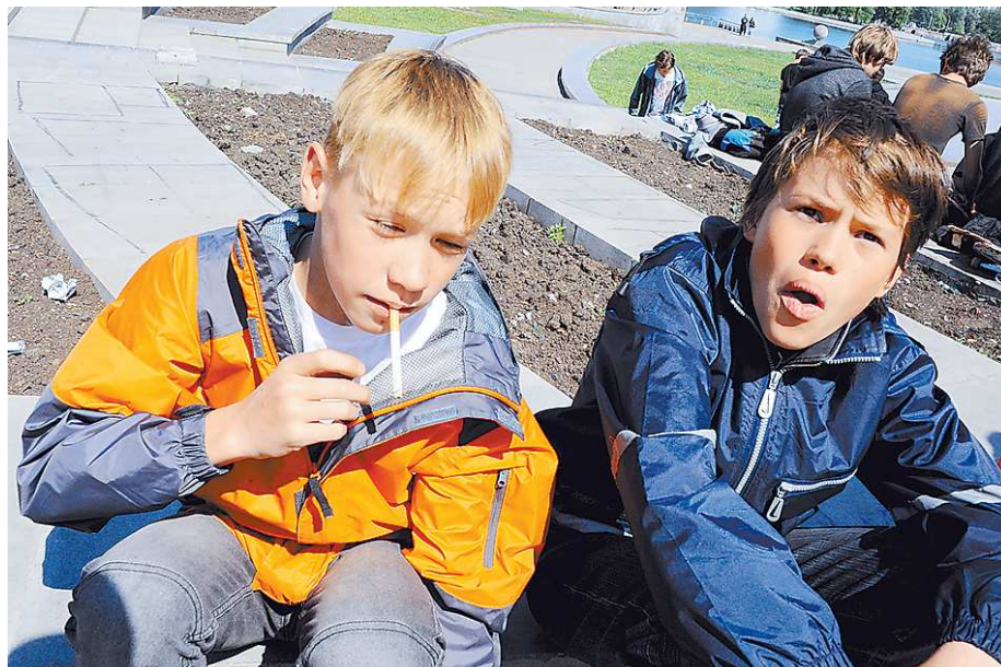
Начать курить легко, а вот бросить...

—Поскольку я начал курить в пятом классе, то, конечно же, я не смог бы справиться с этим один. Я очень тщательно скрывал это от родителей, но когда об этом узнал мой классный руководитель, то домашние тоже всё узнали. Они просто провели