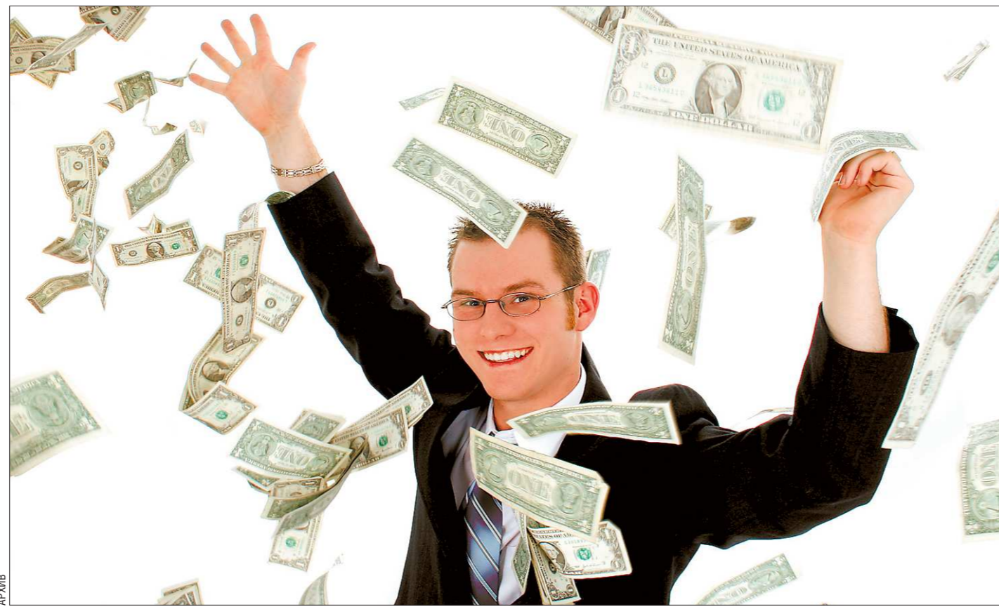
Чиновникам придётся объяснять, откуда на них пролился «денежный дождь»

Впрочем, не будем забывать, что законопроект пока принят лишь в первом чтении, и главные поправки точно предстоит внести. В целом же идея пока кажется разумной.