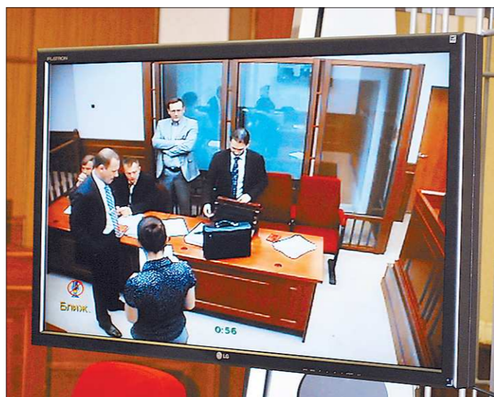
Журналисты были вынуждены довольствоваться видеотрансляцией