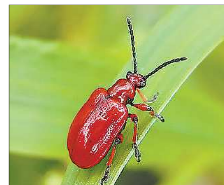
Жуки-листоеды очень живучи. Врагов в природе у них практически нет

УЧРЕДИТЕЛИ И ИЗДАТЕЛИ: Губернатор Свердловской области, Законодательное Собрание Свердловской области. Адрес: 620031, г. Екатеринбург, пл. Октябрьская, 1