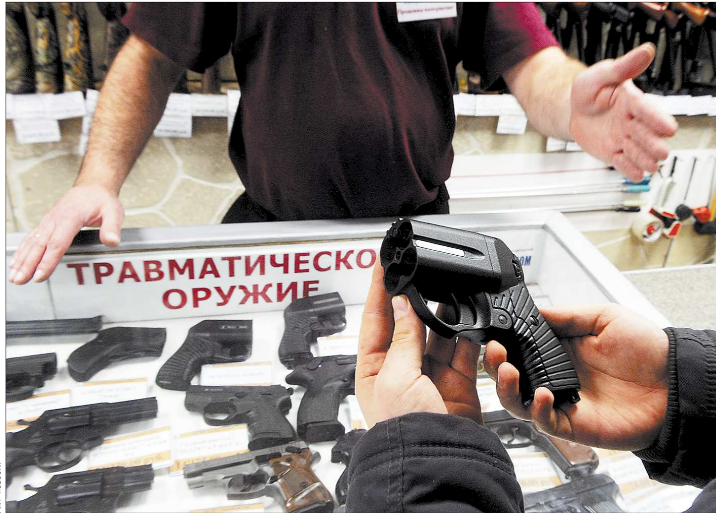
Все, что стреляет, может не только защищать