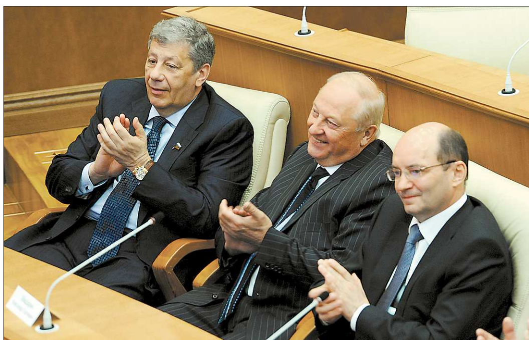
Мэтры уральской политики одобрили выбор президента