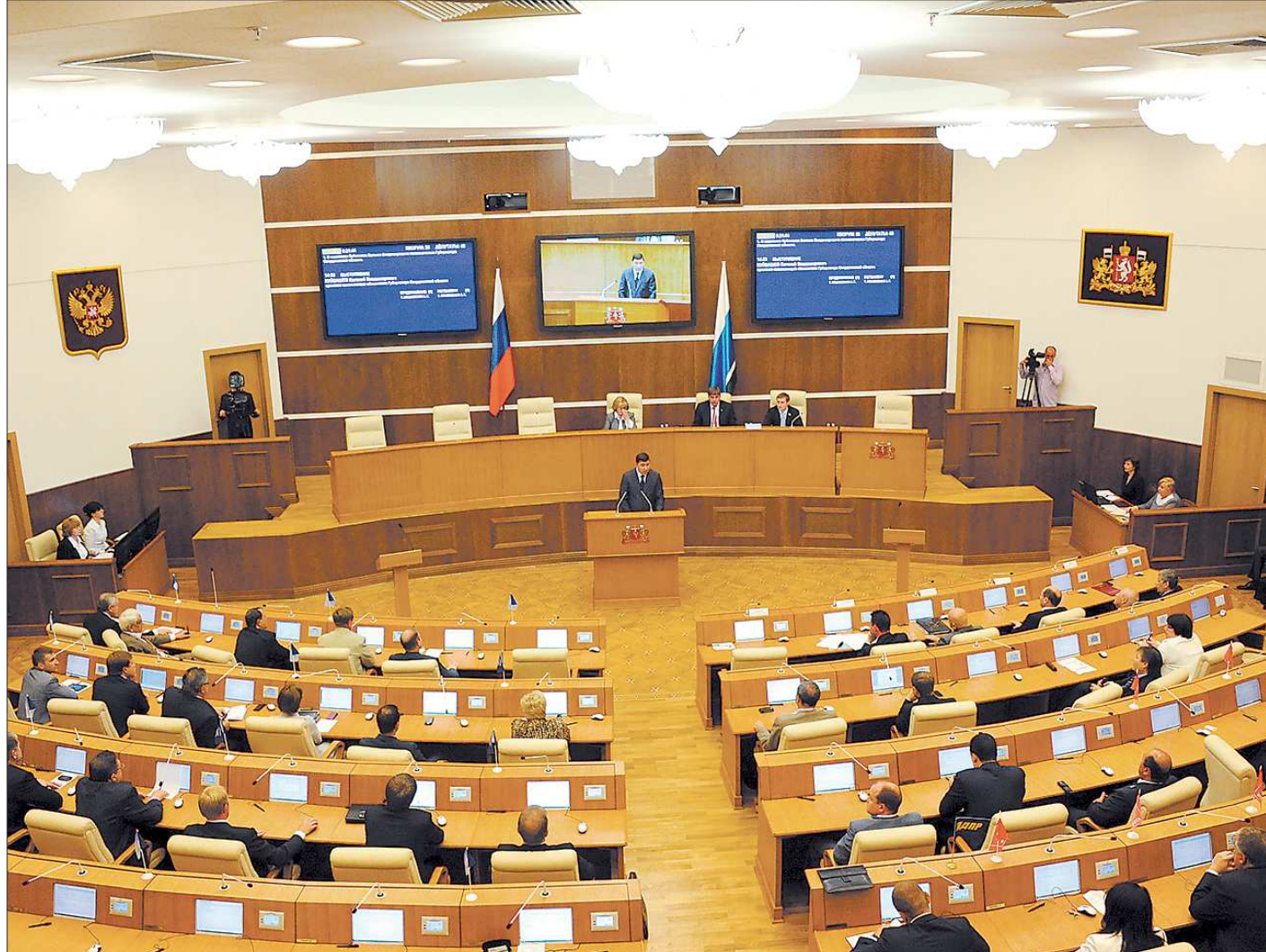
Первая программная речь Евгения Куйвашева перед депутатами Заксобрания Свердловской области

Уважаемые коллеги! Более половины трудоспособного населения области работает в промышленном секторе. Здесь сосредоточены крупнейшие на-