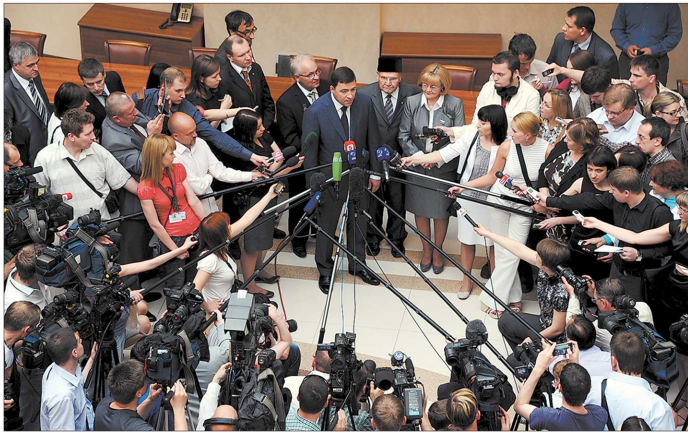
Губернатор в журналистском «плёну»