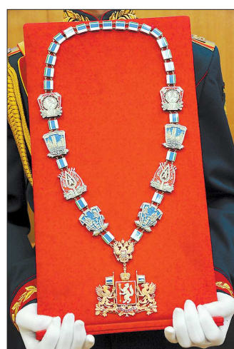
Губернатору вручается символ властных полномочий: знак в виде цепи, увенчанной гербом Свердловской области. Цепь выполнена из серебра и покрыта золотом, а герб отлит из чистого золота.