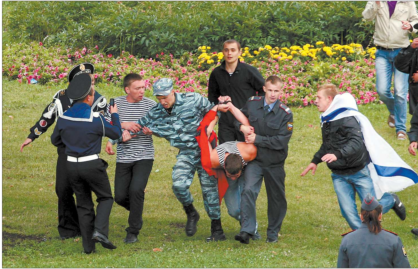
А как хорошо начиналось...

Но, может быть, именно потому, что осталась досада, мне захотелось высказаться по поводу этого неприятного события в контексте безопасности проведения всех «военно-низкоранних» праздников. Представителей воинских