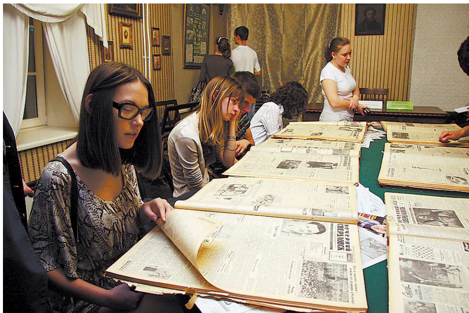
В Музей истории Екатеринбурга многие заходили, чтобы... почитать. Посетителям были предложены подшивки уральских газет 50-60-х годов прошлого века. Особо понравившиеся публикации горожане фотографировали на мобильные телефоны, желая сохранить на память.