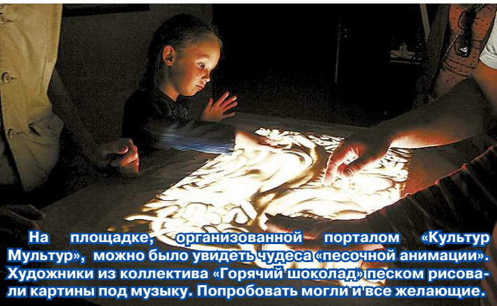
На площадке, организованной порталом «Культур Мультир», можно было увидеть чудеса песочной анимации. Художники из коллектива «Горячий шоколад» песком рисовали картины под музыку. Попробовать могли и все желающие.

В 2012 году «Майская прогулка» проходила в 29-й раз. Я уже участвовала в этом мероприятии в прошлом году, тогда я решилась на маршрут длиной в 18 километров. А в этот раз основательно запаслась водой и бутербродами и отправилась на дистанцию почти в два раза большую.