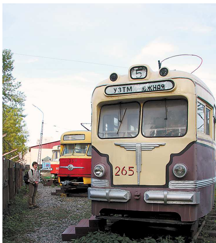
Музей истории развития Екатеринбургского трамвайно-троллейбусного управления предлагал горожанам экскурсии в трамвайный парк. Там можно было увидеть трамваи, которые перевозили екатеринбургских пассажиров около века назад. Раритетом можно считать трамвай 1920 года с деревянными оконными рамами, а также тот, что на фото – трамвай 1947 года. Кроме уральского экземпляра в России сохранились всего два таких же, сейчас они находятся в музейных коллекциях Нижнего Новгорода и Москвы.