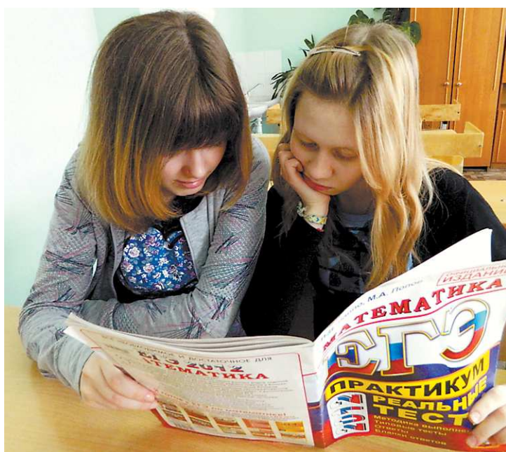
И без назиданий старших школьники готовятся к ЕГЭ, не поднимая головы.

Хотя участь большинства выпускников на самом деле не так мучительна и трагична. Ученики понимают, что от выпускных экзаменов напрямую зависит их поступление в вуз, а значит, и будущее в целом. Сам факт этого заставляет подростков нервничать и волноваться, чувствовать тяжелый груз ответственности, опасаться провала. Вдобавок ко всему длинными и пыльными речами о неимоверной важности ЕГЭ и всевозможных печальных последствиях плохих результатов (так,