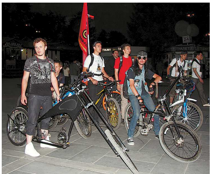
К «Ночи музеев» подключились участники свердловской общественной организации «Велогород». В шатре на парковочной территории Уральского государственного экономического университета расположился их вело музей, где были представлены велосипедные раритеты, велорикши (сочетание велосипеда, кареты и повозки), а также велосипеды, собранные собственноручно. Тех, кто не смог попасть к ним в музей, ребята из «Велогорода» застали на улицах города, где организованно катались до глубокой ночи.