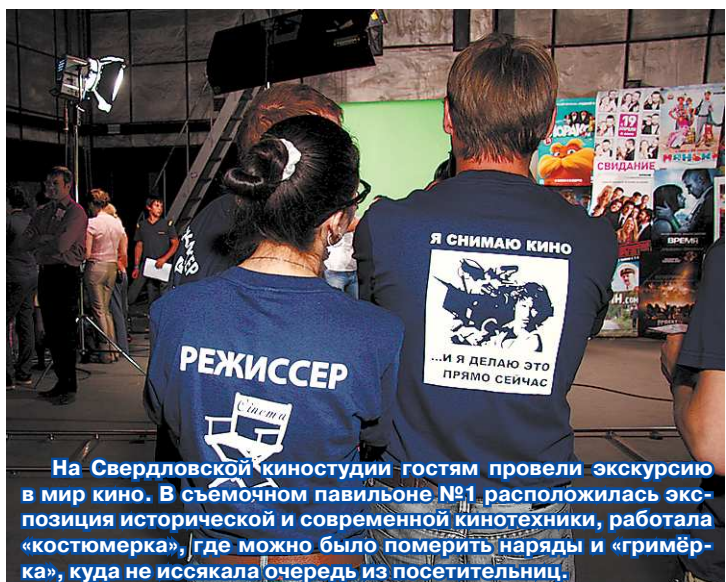
На Свердловской киностудии гостям провели экскурсию в мир кино. В съемочном павильоне №1 расположилась экспозиция исторической и современной кинотехники, работала «костюмерка», где можно было померить наряды и «гримёрка», куда не иссякала очередь из посетителей.

Эта теплая майская ночь была очень удачной для прогулок... по музеям. Более 70 уральских площадок, среди которых, к стати, не только музеи, но и театры, кинотеатры и другие культурные учреждения, открыли свои двери для посетителей.