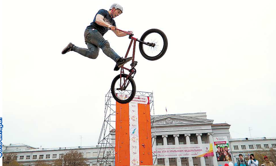
Прыгнуть выше головы? Для экстремала — рядовое задание

у «биэмиксеров» был дополнительный стимул, призовой фонд по этой дисциплине составил 60 000 рублей. Таких призов ещё не было! Каждому хотелось сорвать куш. Но не всем было суждено даже пройти в финал. В квалификации за право оспаривать приз боролось почти 50 человек, и лишь 14 из них вышли в финальную стадию соревнований. Все старались, выкладывались по полной. Но призовых мест всего три. И в этот раз вкус победы удалось испробовать, уже