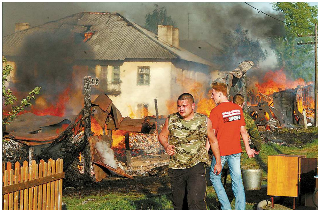
Спасали дома. А уж надворные постройки — как придется

Старт огненным выходным дали хоккейные фанаты под вечер 19 мая. Находясь на отдыхе в деревне Мартьяново, они решили отметить победу сборной России в полуфинале мирового первенства над финнами салютом из ракетниц.