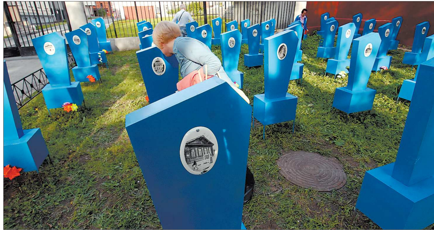
На кладбище не всегда плачут. Чаще вспоминают. Проект Эдуарда Кубенского «Екатеринбург на память» — чтобы помнили

«Урал» (Екатеринбург) – «Университет-Югра» (Сургут) – 74:72 ОТ (23:14, 22:19, 12:19, 11:16, 6:4). Счёт в серии: 1:0. Самые результативные: Гордон – 19, Лепович – 17, Глазунов – 11; Лежачиус – 16, Хлопонин – 14, Дячок – 13.