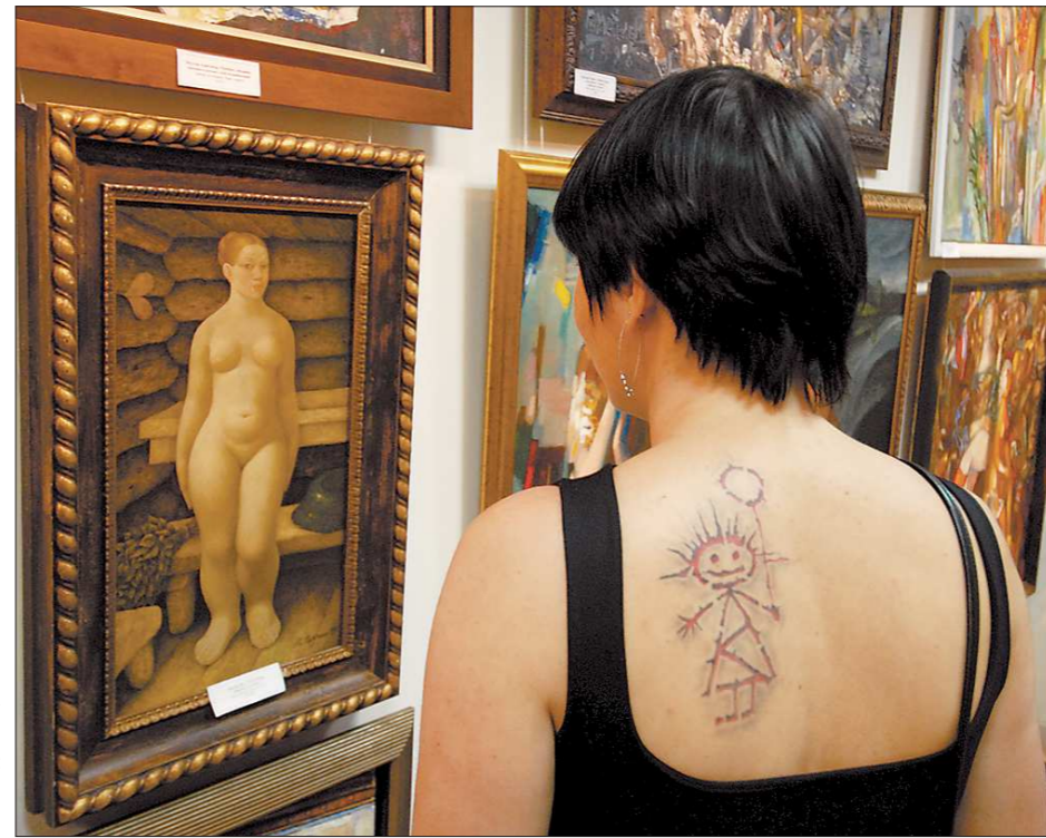
Сколько женщин на фотографии?