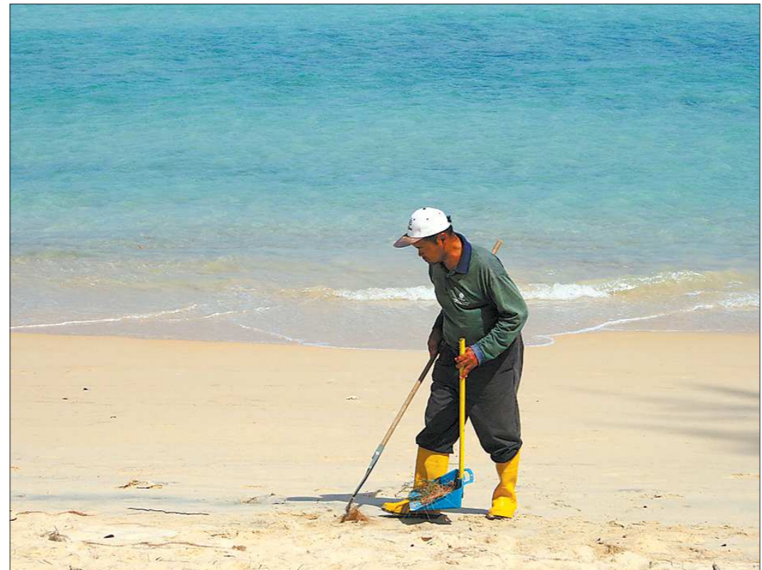
Должники за электроэнергию если и попадут на пляж, то только в качестве уборщиков мусора

Именно на сбор этих четырёхсот миллионов рублей и нацелена сегодняш-