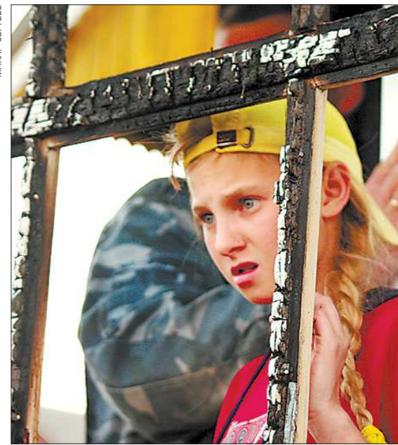
Невесел мир через сгоревшее окно

В пылу борьбы с огнем, человек не всегда готов реально оценить опасность. Кто-то получил ожоги, кто-то надыхался дыма, кому-то