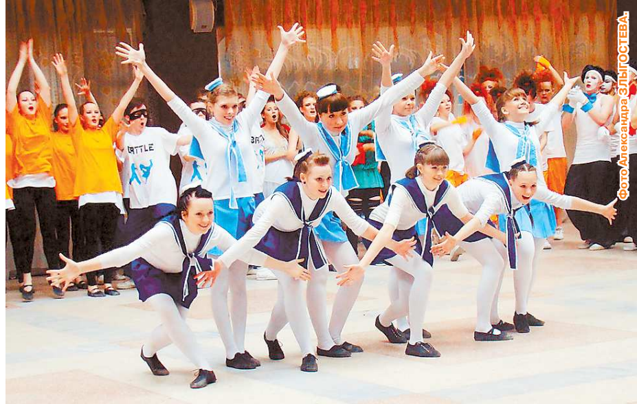
В соревнованиях участвовали 22 команды.