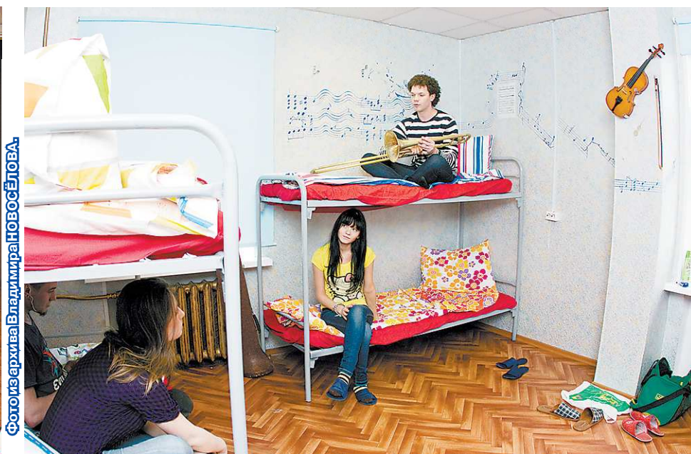
Придумывая интерьер, ребята отказались от стандартных схем, отдав предпочтение молодёжному арту. Так появились рисунки на стенах и батареи золотого цвета.