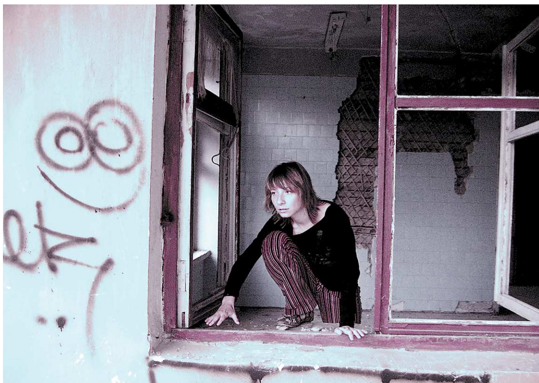
Порой кажется, что выхода нет? Но стоит всё взвесить. Может, тупик – главная иллюзия?

ним страдальцем, хотя каждый вечер ныл друзьям в «ВКонтакте». В мою голову закралась идея, а не покончить ли с собой? Было страшно, я почитал Интернет, и в моей голове сложился довольно романтичный образ: вишу я на верёвке бледный, с улыбкой на губах. Красота? Купил верёвку, начал сочинять текст предсмертной записки. Но мой брат разрушил весь план. Он учился на доктора, и однажды я спросил у него про людей, которые решили по-