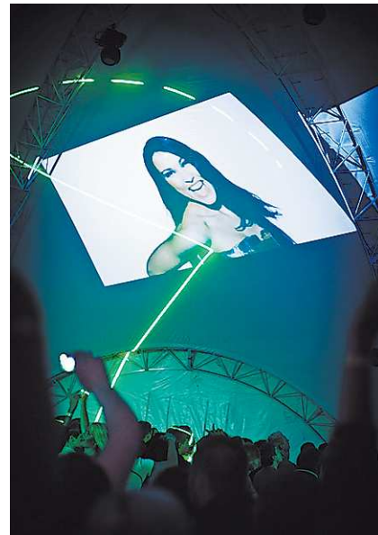
Во время презентации первого клипа в одном из клубов Екатеринбурга