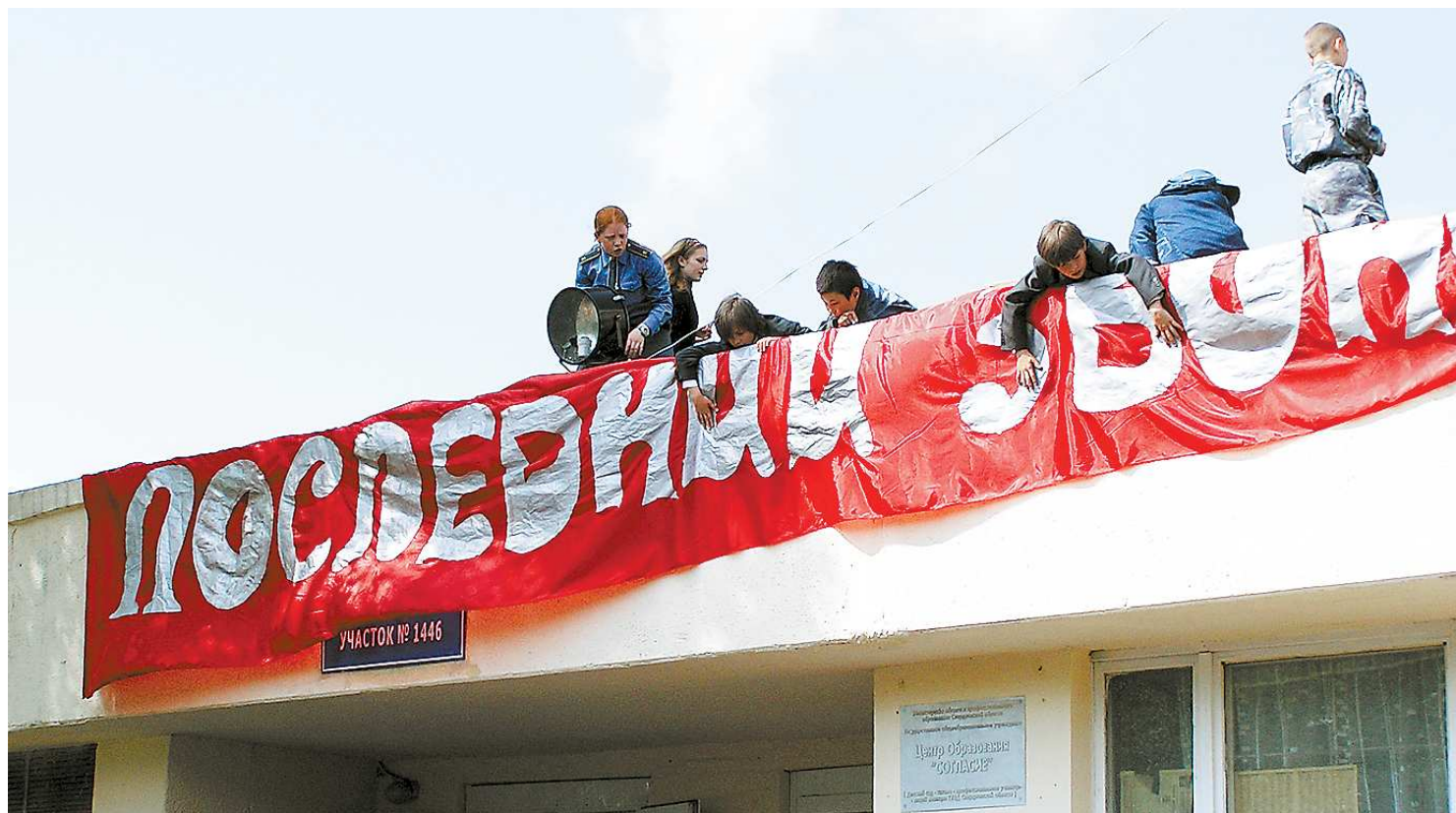
Прощай, школа! Впереди новые высоты...