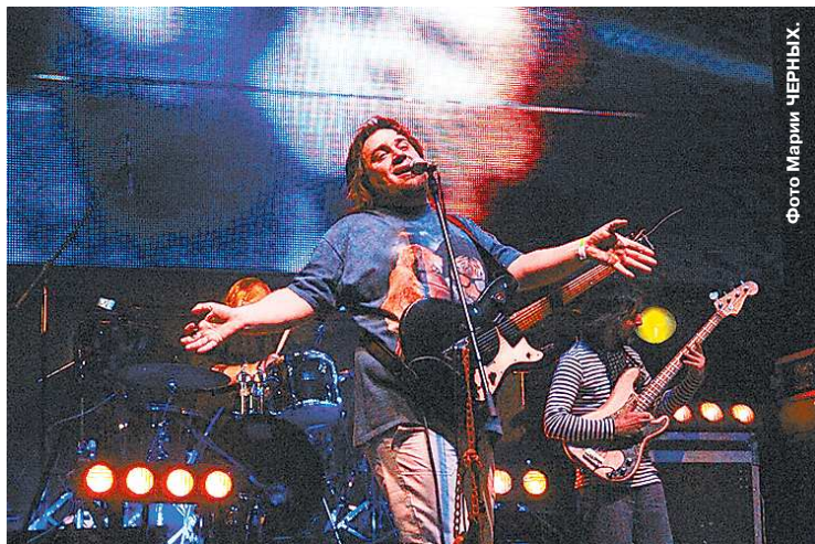
Дед Тото на сцене был зажигателем, как и в Интернете.

–Город классный, знаю лишь то, что раньше он назывался Свердловском.