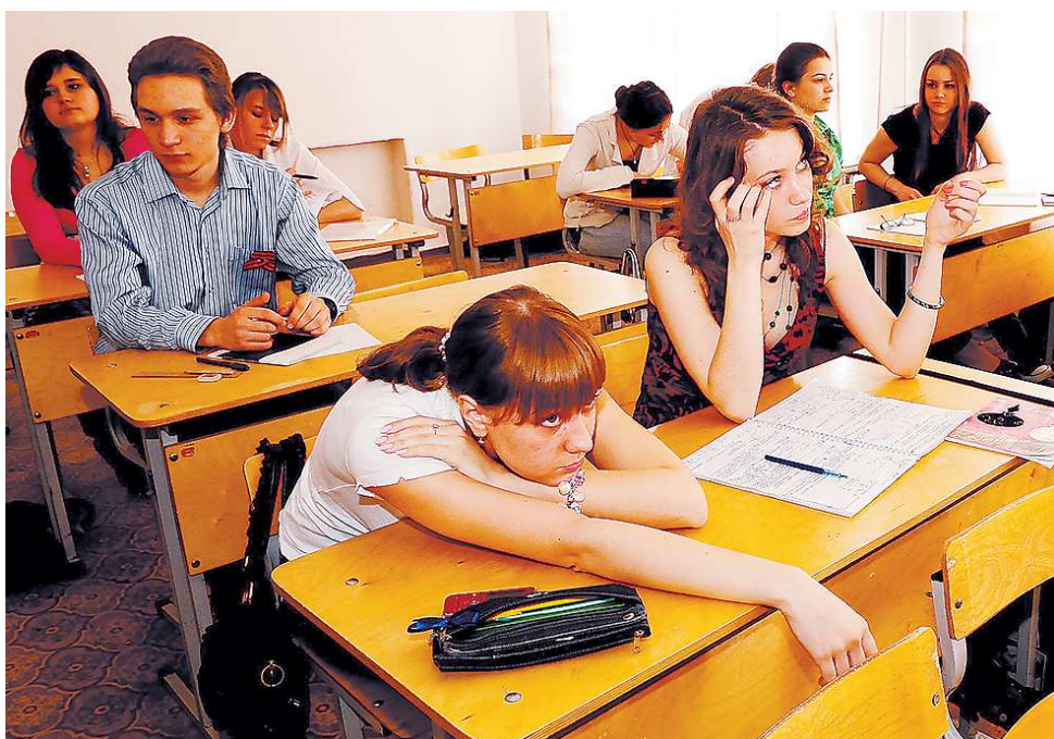
Чтобы получить «пять», надо поработать над собой. Расположение учителя зависит от многих факторов.

или приёме на работу запрещено подкреплять своё резюме фотографией — для сохранения объективности при вынесении решения. И чтобы, даже самые «красивые глаза» нуждаются в весомой поддержке — умных словах, которые заставят преподавателя поставить заветную подпись в протянутой ему зачетке.