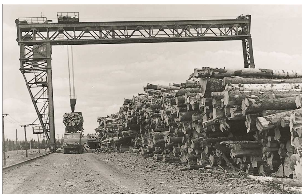
Леса на Урале много, но продать его за границу сложно

Чтобы контролировать, как отражается ситуация на здоровье человека, существует система медицинских осмотров. Начиная с 2012 года вся ответственность за проведение медосмотров лежит на работодателях.