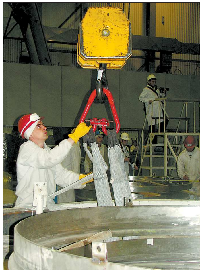
Изготовлением оборудования для энергоблока БН-800 заняты десятки предприятий по всей стране. В его строительстве принимают участие более 40 субподрядных организаций. На строительной площадке трудятся порядка двух тысяч человек. Эти монтажники занимаются внутренним обустройством атомного реактора