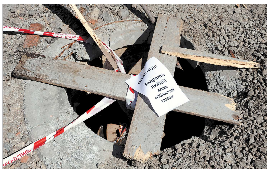
В этот люк на улице Сыромолотова в Екатеринбурге пока ещё никто не упал. Но где гарантия, что этого не случится завтра?

В 1990 году храм был возвращен верующим, и в феврале 1991 года, в праздник Сретения Господня, здесь вновь была отслужена литургия.