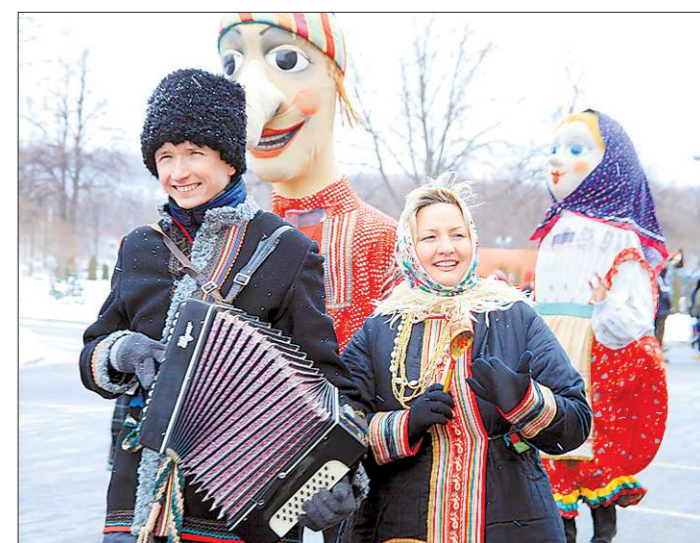
В день митинга в Москве народ проявил свои таланты