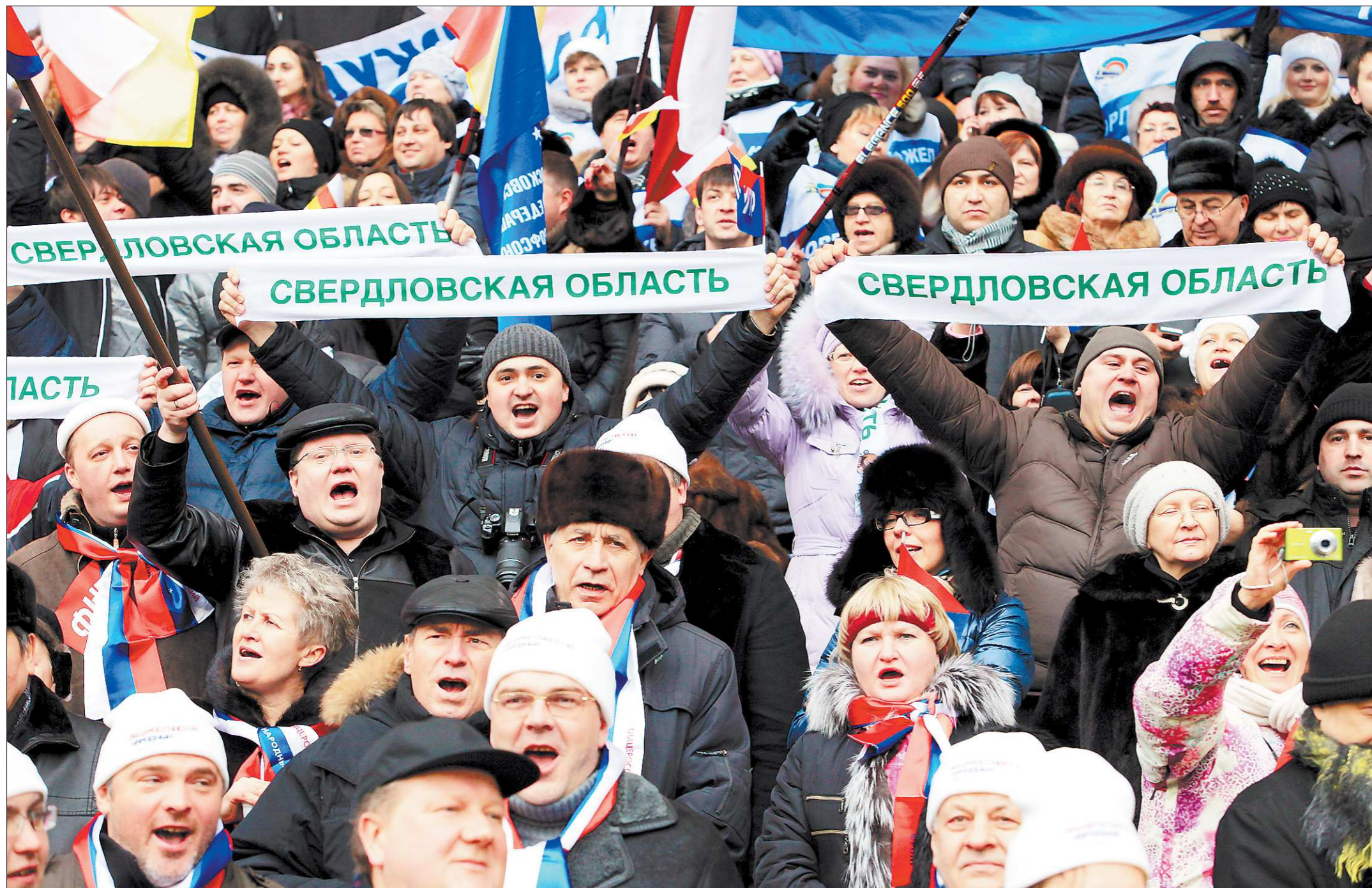
Свердловская делегация в «Лужниках» – самая крупная из региональных: почти 850 человек, около 600 из которых добрались до Москвы спецпоездом

На Среднем Урале кинематографисты продолжают рассказывать о человеке труда и престиже рабочих профессий