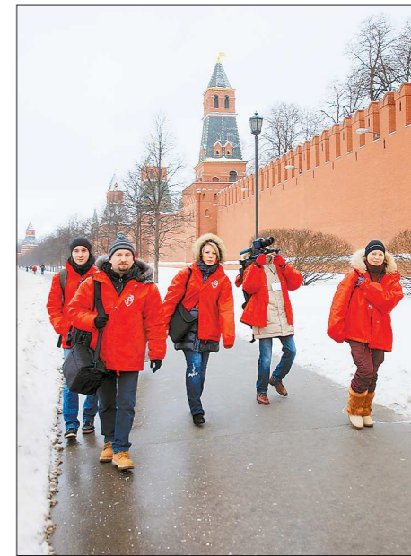
Бригаду киностудии было видно издалека

По словам авторов проекта «День второй: Мы верим в Россию!» в скором времени фильм (в мае-июне, – сроки уточняются) будет показан на региональных телеканалах, в частности, на ОТВ.