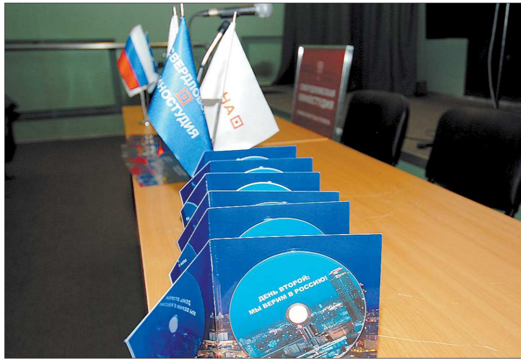
Диски с фильмом отправят на все предприятия Свердловской области, сотрудники которых принимали участие в митинге

В четверг, 3 мая, накануне инаугурации Президента РФ, в Екатеринбурге состоялся пресс-показ кинопроекта.