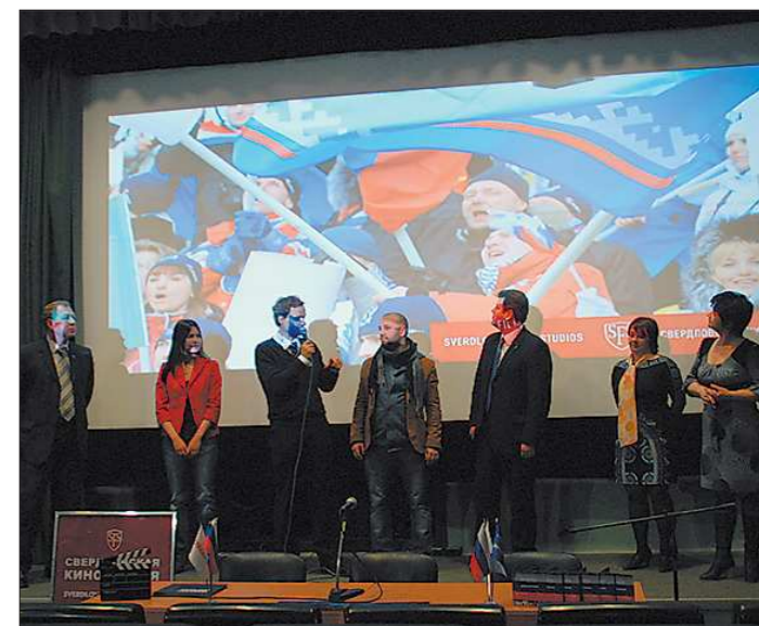
Презентуя свой проект на пресс-показе в Екатеринбурге, авторы картины заметно волновались, так как на одной сцене с ними были и герои фильма