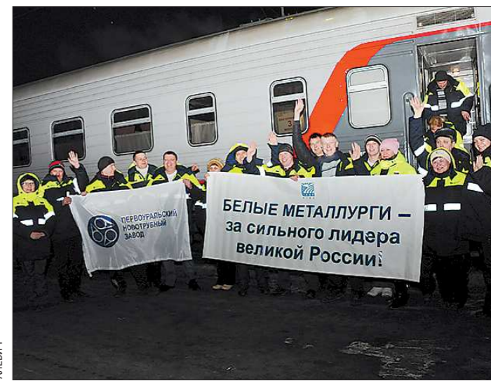
За несколько минут до отправления поезда в Москву уральская делегация еще раз напомнила, что «человек труда» – это звучит гордо!