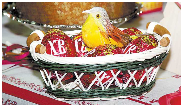
Красиво расписанные яйца – главная примета Пасхи