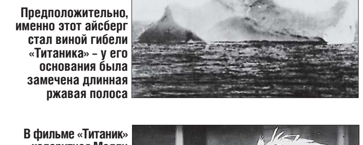
Предположительно, именно этот айсберг стал виновником гибели «Титаника» — у его основания была замечена длинная ржавая полоса