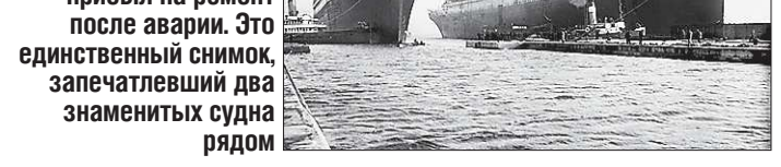
«Титаник» и «Олимпик» в порту Белфаста: один готовится к отплытию, другой прибыл на ремонт после аварии. Это единственный снимок, запечатлевший два знаменитых судна рядом

10 апреля 1912 года. «Титаник» отходит от причальной стенки Стаутемптонского порта. На этом снимке не запечатлена первая «нештатная ситуация», в которую тогда попал корабль: он чуть было не столкнулся с американским лайнером «Нью-Йорк»