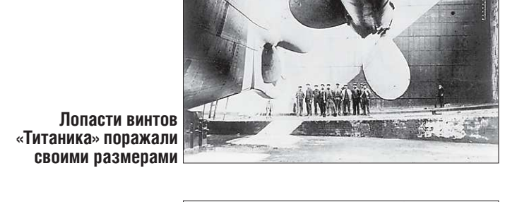
Лопастей винтов «Титаника» поразили своими размерами