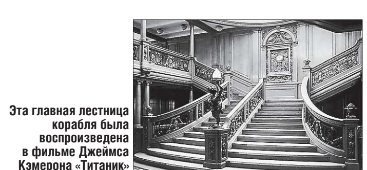
Эта главная лестница корабля была воспроизведена в фильме Джеймса Кэмерона «Титаник»

10 апреля 1912 года. «Титаник» отходит от причальной стенки Стаутемптонского порта. На этом снимке не запечатлена первая «нештатная ситуация», в которую тогда попал корабль: он чуть было не столкнулся с американским лайнером «Нью-Йорк»