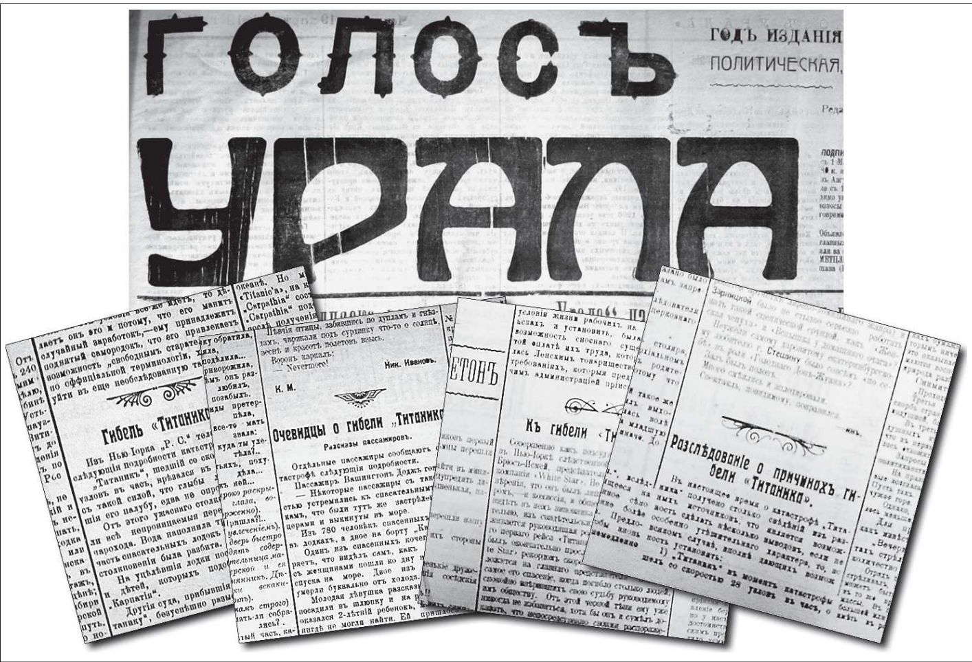
Катастрофа в Атлантике весной 1912 года стала одной из главных тем екатеринбургской газеты