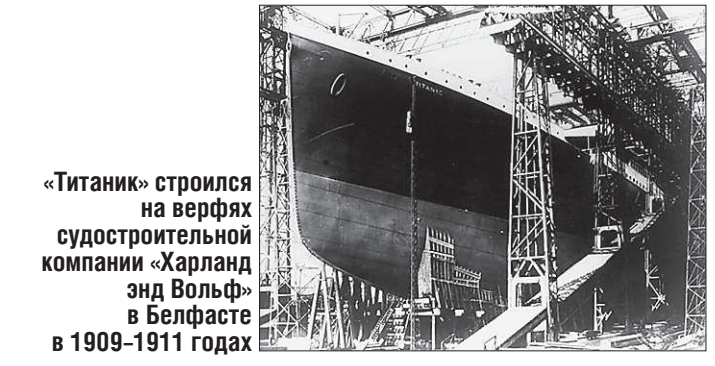
«Титаник» строился на верфях судостроительной компании «Харланд энд Вольф» в Белфасте в 1909-1911 годах

«Титаник» и «Олимпик» в порту Белфаста: один готовится к отплытию, другой прибыл на ремонт после аварии. Это единственный снимок, запечатлевший два знаменитых судна рядом