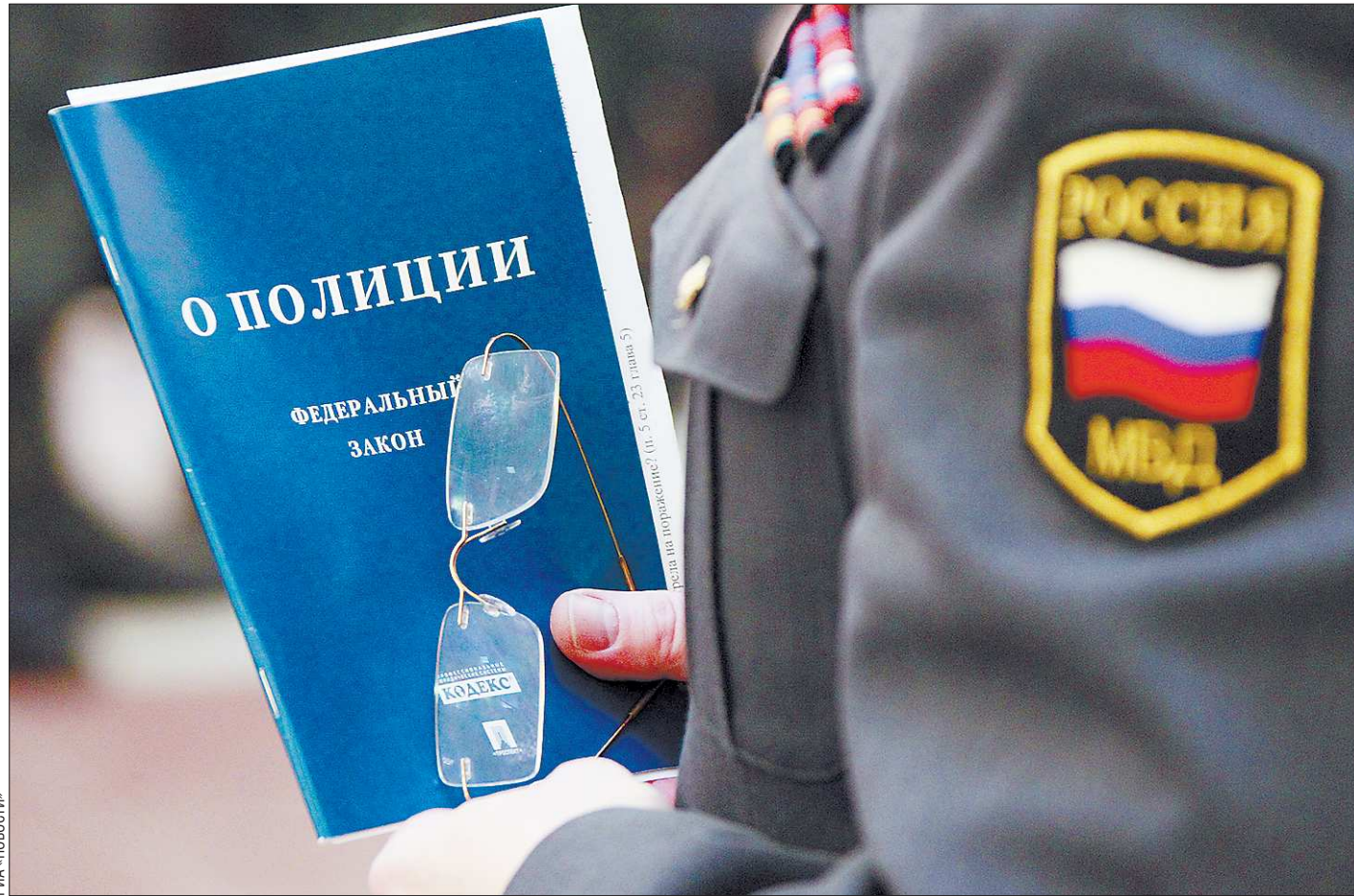
Как ни назови, а отвечать придётся

В итоге оборудование, материалы, документы и какие-то деньги в сейфах, личные вещи работников фирмы «ОЛА» и предприятий-арендаторов – всё осталось в кабинетах и помещениях девятиэтажки, а владельцы – на ули-