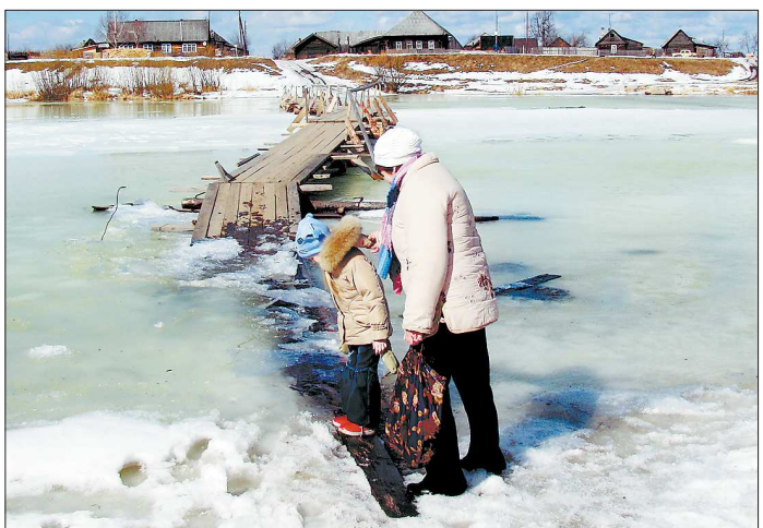
Мост еще стоит, но третий день по нему уже не ходят

В Верхотурском городском округе в слиянии рек Салды и Туры стоят три деревни – Усть-Салда, Рычкова и Бочкарева. Последняя во время половодья и ледостава бывает отрезана от Большой земли Турой. С июня по апрель жителей деревень соединяет деревянный пешеходный мост, который на период ледохода разбирают.