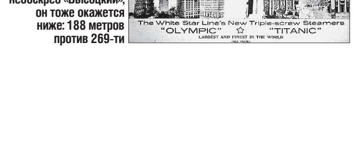
Длина «Титаника» превышала высоту наиболее известных небоскрёбов того времени. Кстати, если поместить рядом екатеринбургский небоскрёб «Высоцкий», он тоже окажется ниже: 188 метров против 269-ти