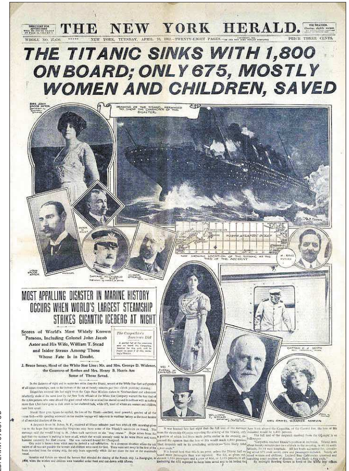
«Карпатия» со спасёнными пассажирами «Титаника» ещё была на пути в Нью-Йорк, когда газеты уже оценили масштаб катастрофы.

«Невозможное — возможно» — это было именно то девиз, которого непрофессионал Уинстон Черчилль, обладавший богатым воображением, придерживался всю свою жизнь.