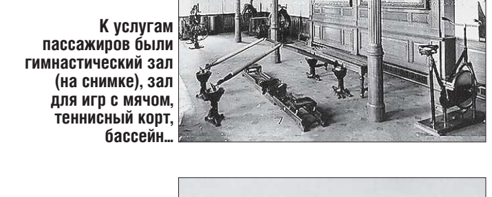
К услугам пассажиров были гимнастический зал (на снимке), зал для игр с мячом, теннисный корт, бассейн...