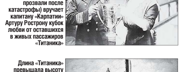
В фильме «Титаник» колоритная Молли Браун выдаёт «на прокат» фразе Джону Дугану. На снимке: «непотопляемая Молли» (так её прозвали после катастрофы) вручает капитану «Карпати» Артуру Роструну кубок любви от оставшихся в живых пассажиров «Титаника»