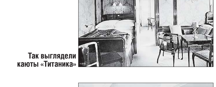
Так выглядели каюты «Титаника»