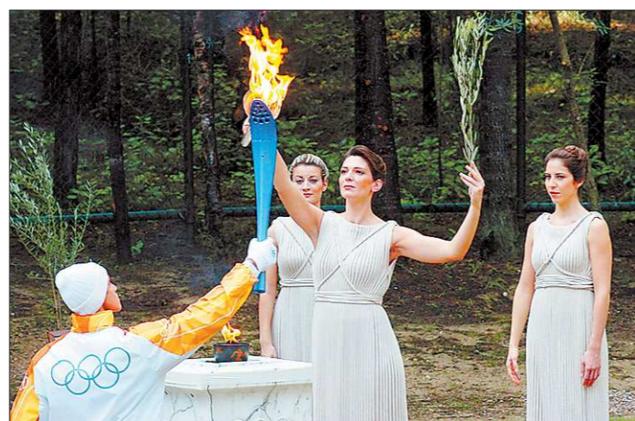
Огонь из Древней Олимпии ждёт на Урале