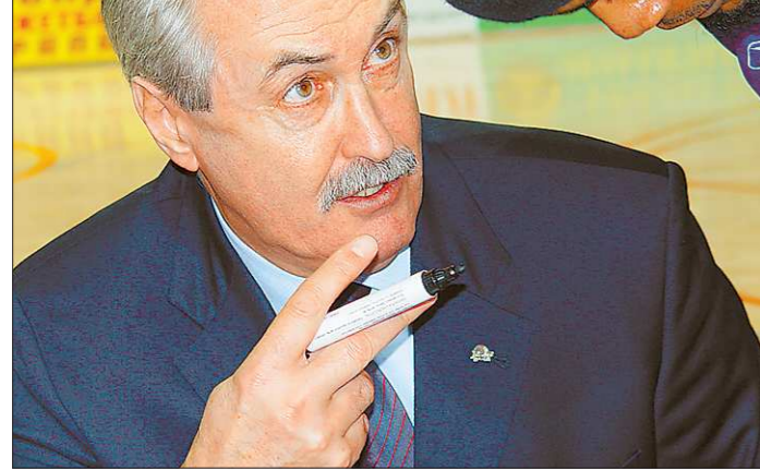
В 1980 году, когда наша страна единственной раз принимала Олимпиаду, последним в «огненной эстафете» (то есть тем, кто зажег факел на стадионе) был воспитанник свердловского спорта баскетболист Сергей Белов