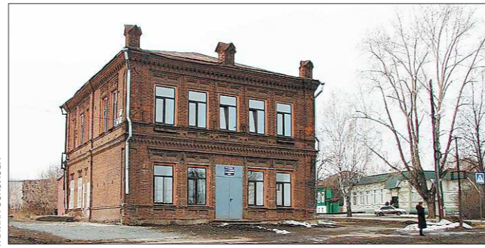
Красивый купеческий особняк — самое подходящее место для хранения исторических ценностей