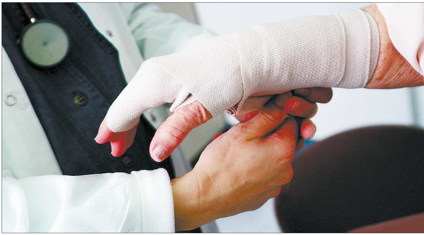
Излишняя погоня за прибылью зачастую калечит работников

По его словам, в Госжилинспекцию жители Среднего Урала на ТСЖ жалуются гораздо реже, чем на управляющие компании. На основании всех писем и обращений граждан проводятся внеплановые проверки.