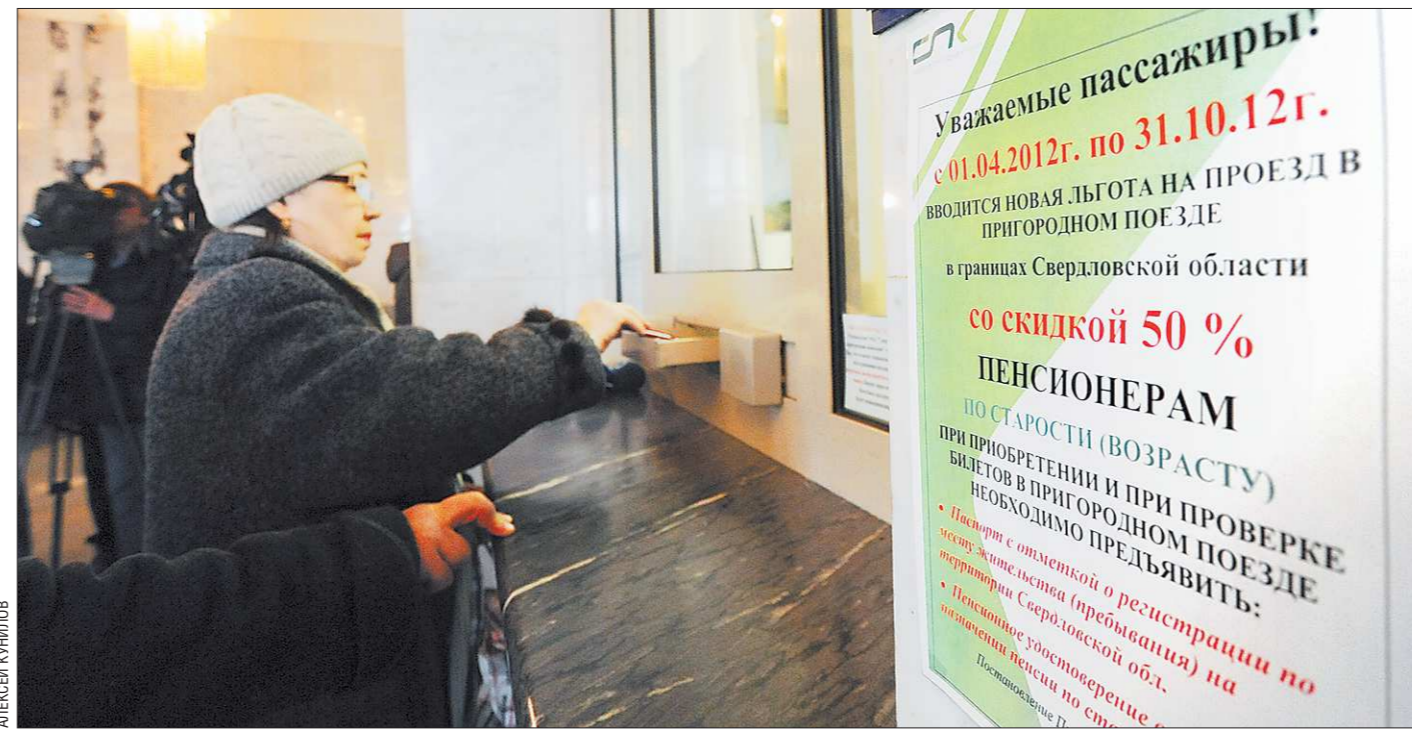
Льготные билеты могут купить во всех железнодорожных кассах