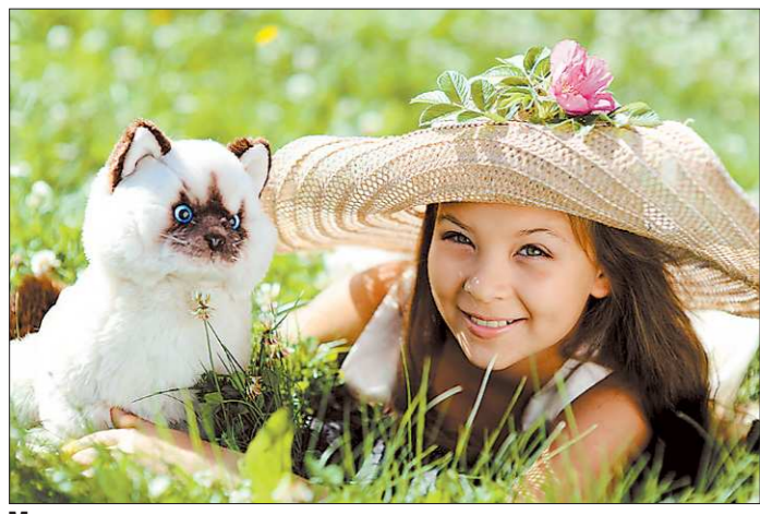
Многие каменцы внимательно следят за успехами этой юной красавицы