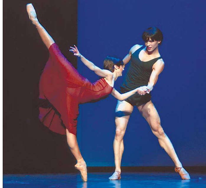
Сцена из спектакля Курта Вайла «Кристофер Пастор» (Польский национальный театр)