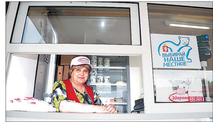
На мелкую торговлю у власти, продвигающей проект «Выбирай наше — местное!», особые надежды

Интересное мнение о проекте самих товаропроизводителей. — Что касается программы «Выбирай наше — местное!», то мы участвовали и будем участвовать в ней, — заявил и. о. генерального директора ОАО