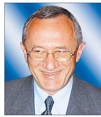
Первым Генконсулом США в Екатеринбурге был Джек Сигал

18 лет назад (в 1994 году) в Екатеринбурге было открыто Генеральное консульство Соединенных Штатов Америки.