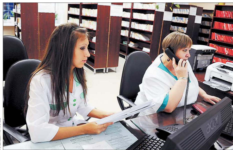
Запись через Интернет разгружает работу сотрудников регистратур, нередко вынужденных одновременно говорить по телефону, искать медкарту и отвечать на вопросы посетителей

Практика показывает, что через Интернет записаться вполне реально к терапевтам и педиатрам, а вот к докторам узких специальностей сделать это не всегда возможно. К редким в большинстве больниц эндокринологу или кардиологу жестко требуются направления от участкового врача. Наиболее благополучно обстоят дела с записью в детские поликлиники (кадровый дефицит меньше). Так, в ДКБ №11 электронный сервис предлагает время плановых приемов к неврологу, дерматологу или хирургу.