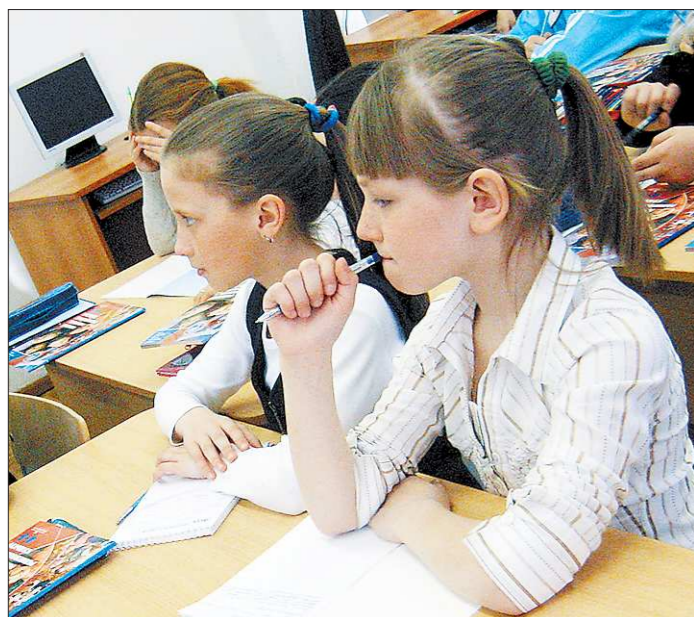
Одна из изюминок предмета «Основы религиозных культур и светской этики» — на нём нет оценок. Учителя рассчитывают, что школьники не будут стесняться отвечать на достаточно личные вопросы о религии