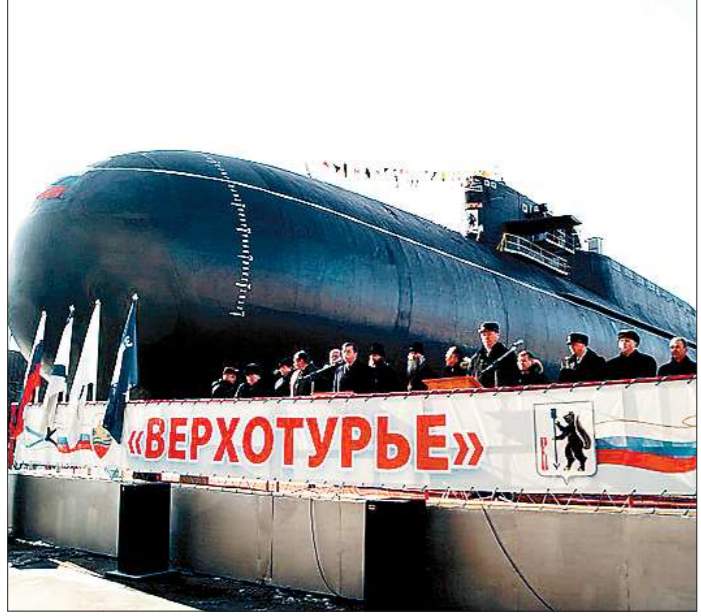
Свердловчане - частые гости экипажа подшефной АПЛ «Верхотурье»