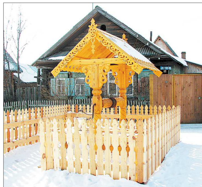
Раньше на месте колодца-теремка в Аятском стоял его дряхлый предшественник. При перестройке из него достали 24 ржавых ведра

Создателя шедевра нет в живых уже несколько лет. В