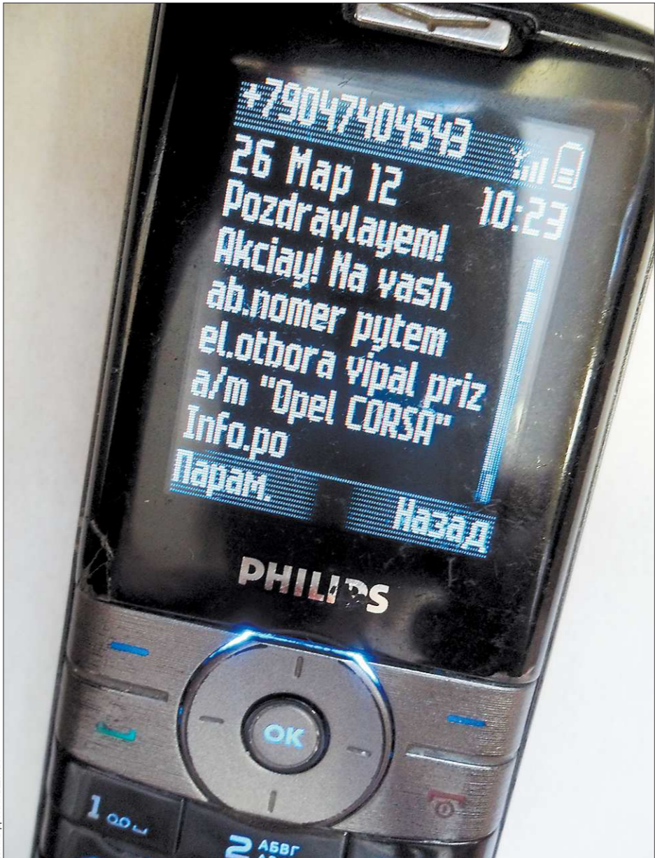
Так мне в который уже раз сообщили об очередном «счастливым призе». Только-то и нужно - перезвонить...

И всё-таки наиболее популярна у клиентов пенитен-