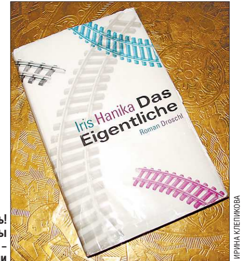
«Переводить! И быстрее». Уральцы не просили – настаивали

Книга Ирис Ханика «Das Eigentliche» ещё не переведена. В России экстренно перевели лишь несколько отрывков, чтобы автор смогла представить роман. В Екатеринбурге впервые прозвучало по-русски его название – «Сущностное».