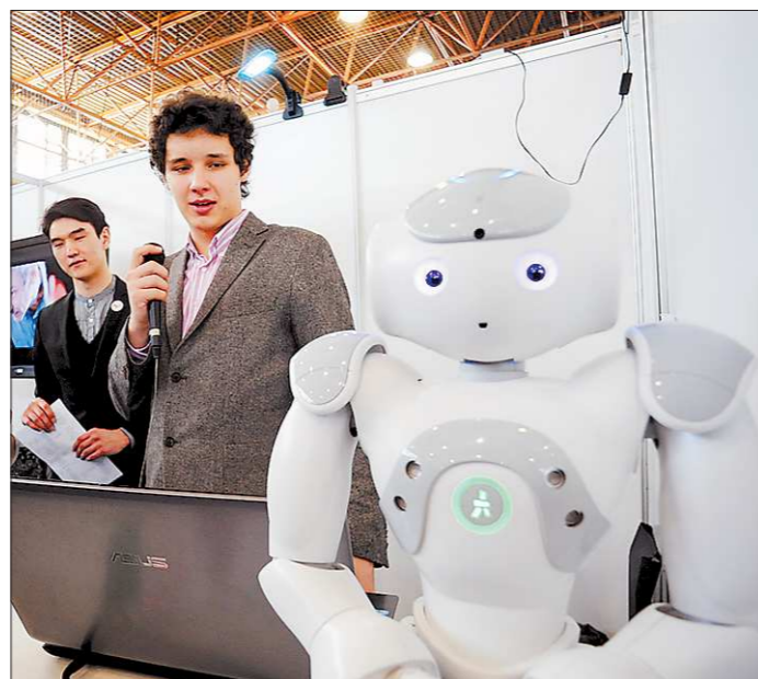
Этот робот стоит миллион