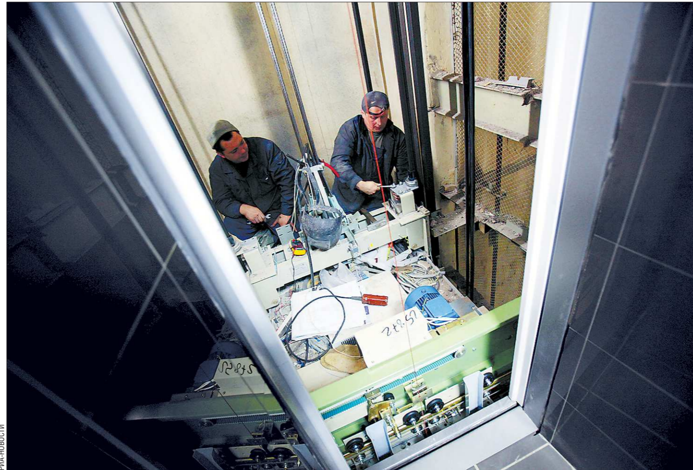
Каждый пятый лифт на Среднем Урале требует ремонта либо замены

Уже этой весной, как надеются в министерстве торговли, питания и услуг, областная стратегия развития торговли региона будет представлена на утверждение правительства.