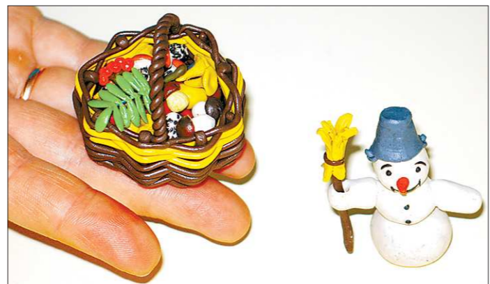
«Вкусные» краски, вкусно звучащий текст...

–Эквивалент – это заменить. По мне, аудиокнига – хорошее дополнение (к домашнему чтению). В машине, в дороге – да! Я сама на последней Московской книжной выставке купила несколько аудиодисков: рассказы моего любимого Аркадия Аверченко, «Евгения