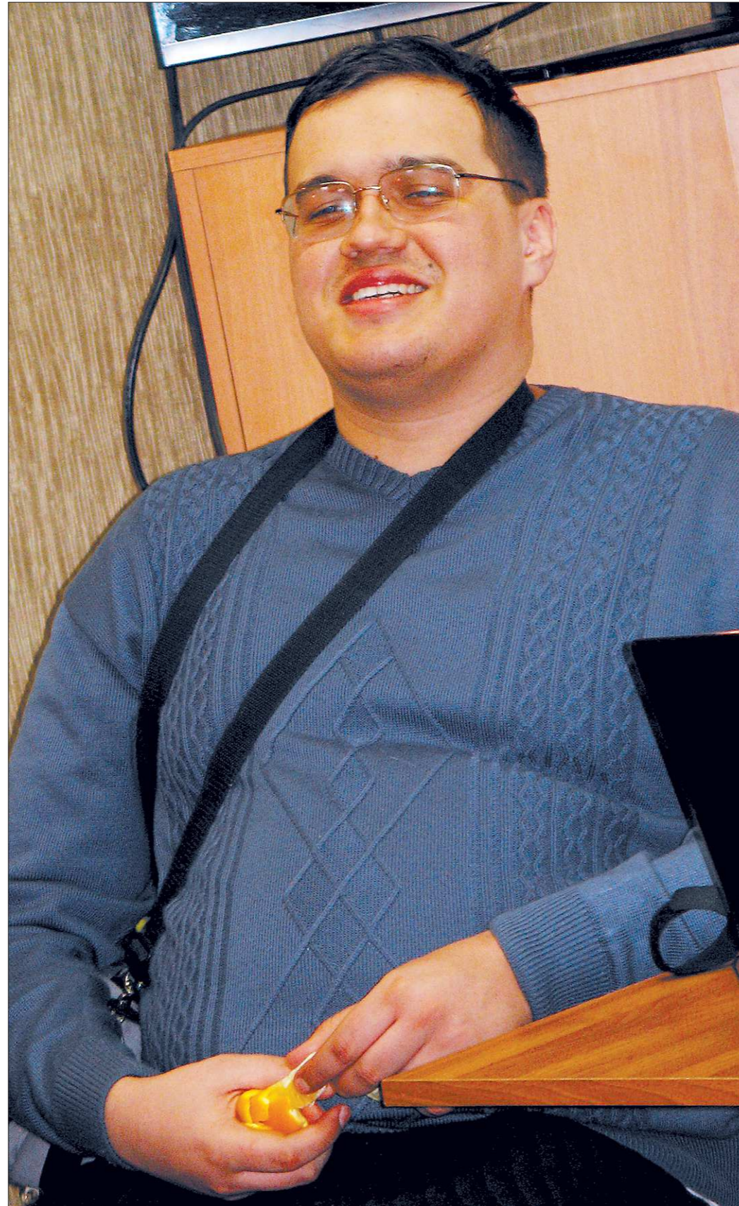
Апельсин от «Урала» – для души, миллион от «Дебюта» – на издание книги

Вот я и «укрупнил». Написал повесть, послал на премию «Дебют», и она неожиданно