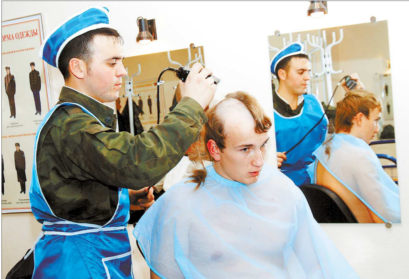
Когда новый законопроект вступит в силу, забрать гражданина в солдаты станет гораздо проще

Не секрет, что пока военкоматы успешно выполняют планы на призыв лишь потому, что подлежащих призыву ребят у нас всё ещё больше, чем требуется силовым ведомствам. Призывников хватает даже несмотря на то, что к концу 2011 года по Свердловской области около девяти тысяч молодых людей (а в целом по России — почти 200 тысяч) числились в списках «уклонистов». Способ уклониться от получения повестки много. Например, призывник может жить не по месту регистрации, скрывая свой фактический адрес, может не оказаться дома в момент прибытия к нему курьера с повесткой, а то и просто не открыть дверь.