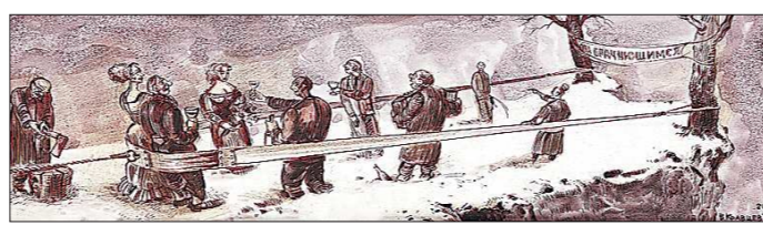
Из серии «Три, два, один»