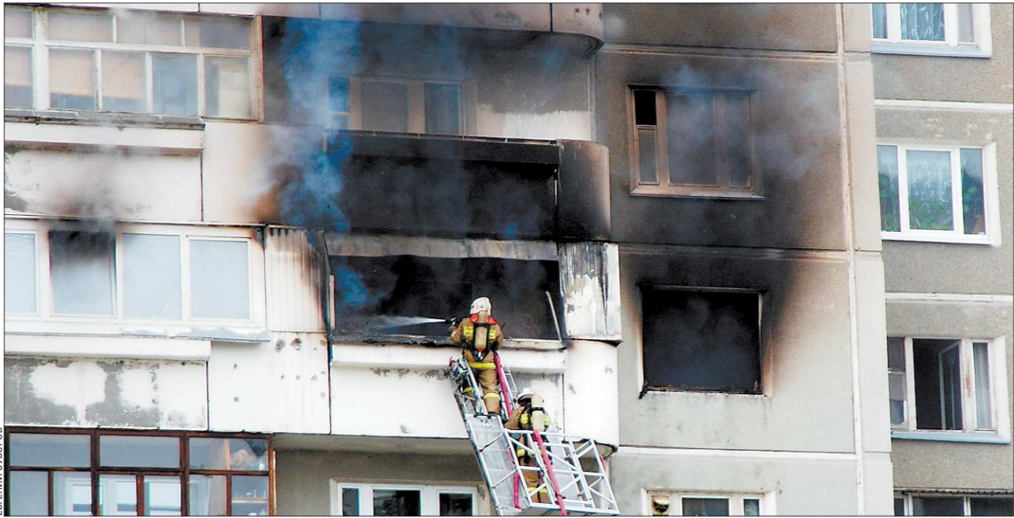
С начала года в Свердловской области произошло уже четыре мощных взрыва газа