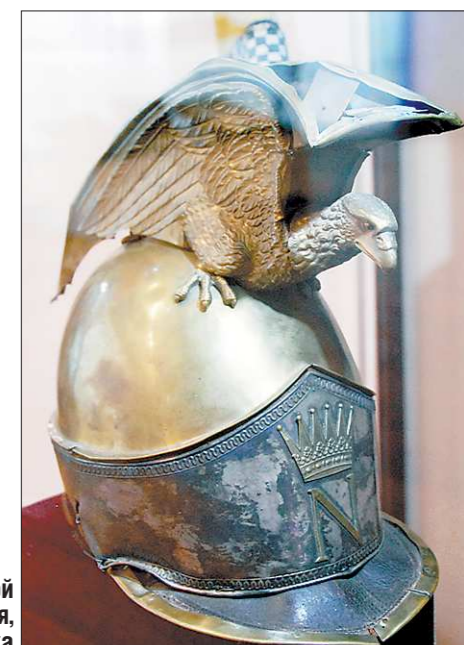
Каска тяжёлой кавалерии, Италия, начало XIX века