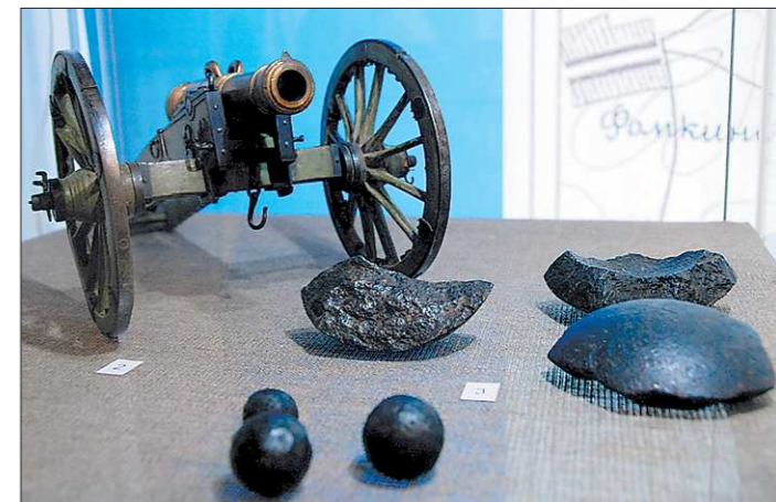
Модель единорога изготовлена в начале XIX века

Реликвии Бородинского сражения выставлены в Екатеринбурге