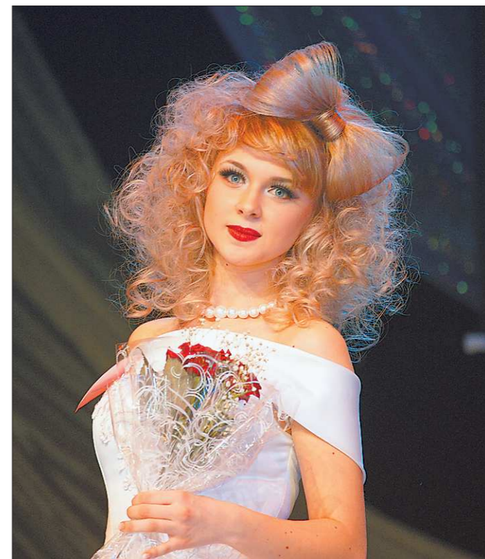
Эта «куколка» не заняла призового места, но очень понравилась зрителям и фотографам