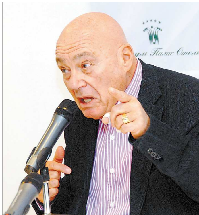
В самоиронии Владимиру Владимировичу не откажешь...

Очень многое изменилось – и в мире, и в моем к нему отношении. Я мог написать книгу заново, но это было бы нечестно. Я хотел, чтобы сегодня в России читали книгу, которую я написал тог-