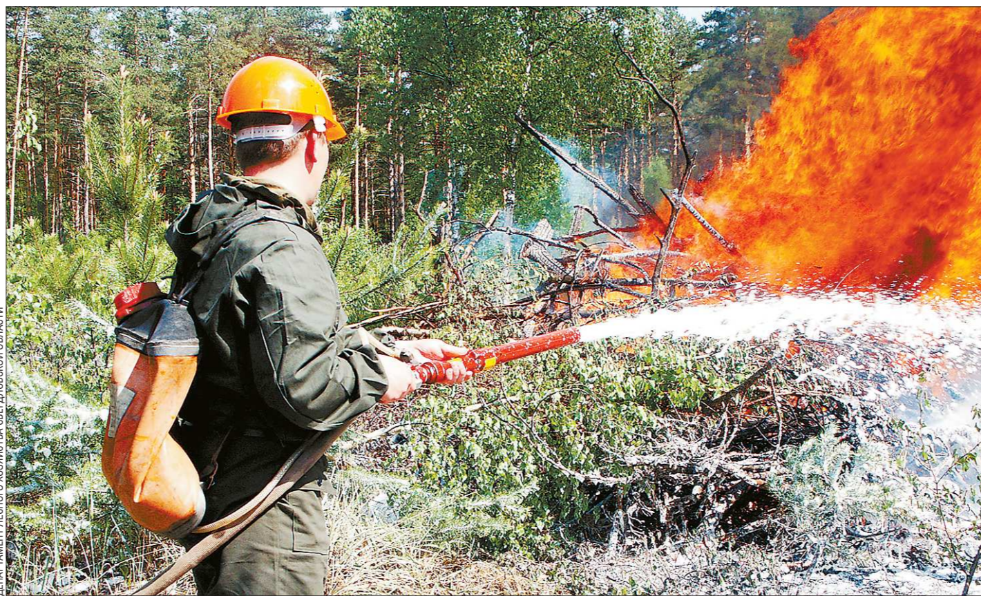
ПЕРЕНОСИМЫЙ РАНЕЦ ОГНЕБОРЦА ПО-ПРЕЖНЕМУ СЧИТАЕТСЯ ЭФФЕКТИВНЫМ СРЕДСТВОМ БОРЬБЫ С ЛЕСНЫМИ ПОЖАРАМИ