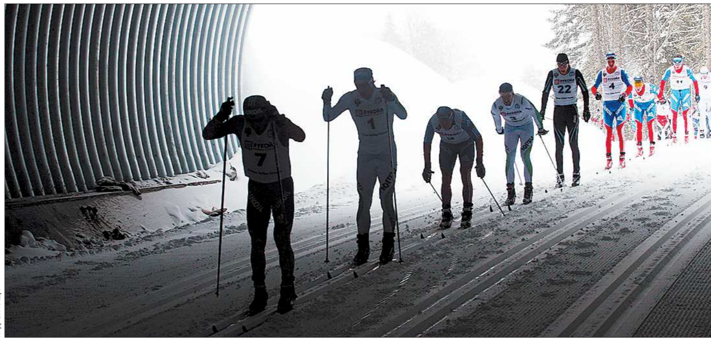
Фишка сочинской трассы — лыжный тоннель

Но и в таких «стерильных» условиях полицейским нашлось место для подвига. В начале февраля в Сочи без приглашения приехали норвежские смазчики лыж, которые будут работать со своими лыжниками и биатлонистами на Олимпиаде-2014. Цель их визита была далеко не ту-