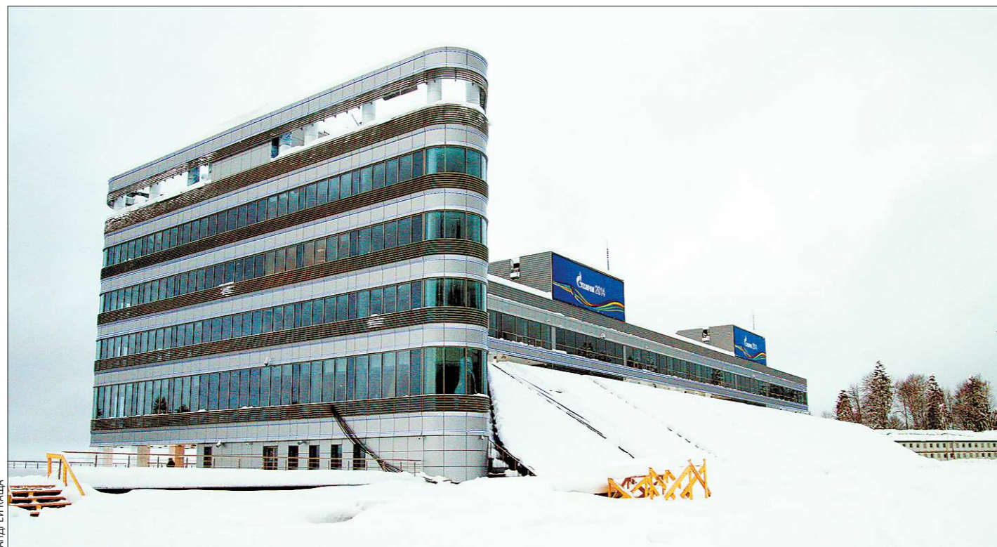
Лыже-биатлонный стадион «Лаура» в ожидании своих болельщиков

В нескольких минутах ходьбы от канатки располагается олимпийская деревня. Она будет состоять из двух частей: западной, где разместятся многоэтажные гостиницы, и восточной, отведенной под коттеджный поселок. Если на «западе» еще вовсю трудятся строители, то «востоку», состоящий из трех десятков деревянных домиков, уже при-