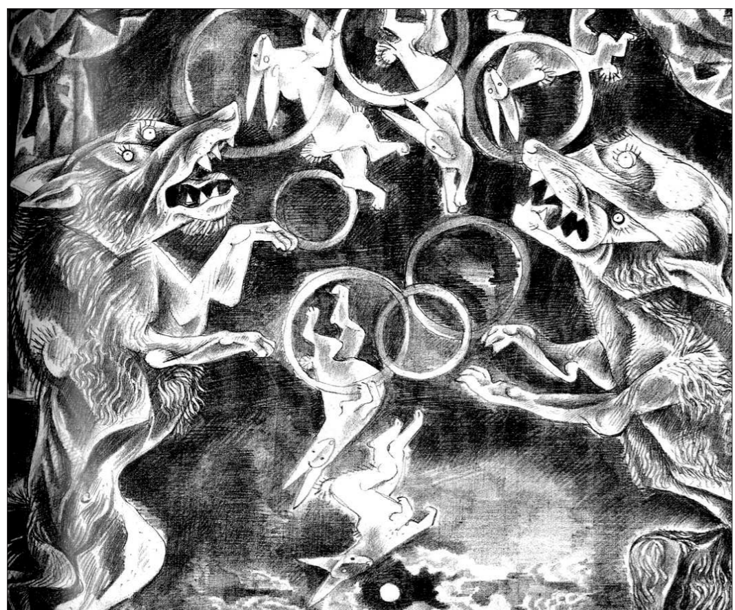
«Волки жонглируют зайцами» (1980)