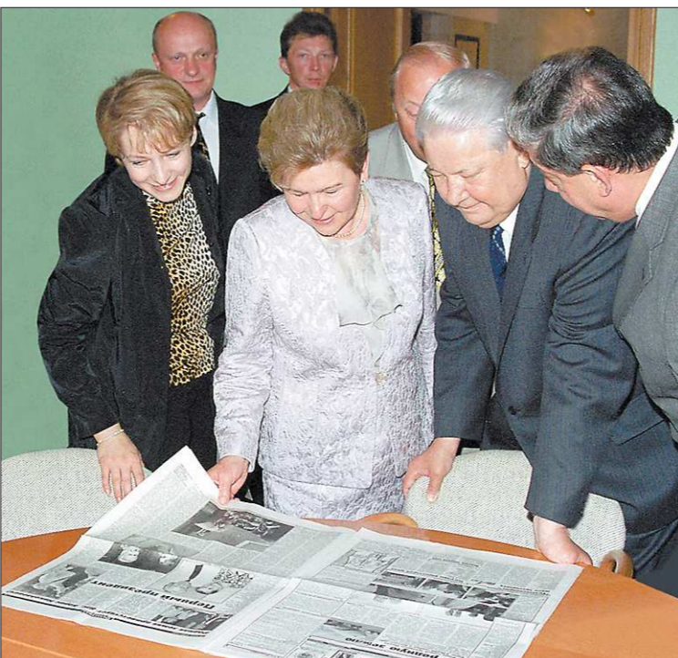
Июнь 2000-го. Во время визита в Екатеринбург Борис Николаевич, Наина Иосифовна и их дочь Татьяна знакомятся с номером «Областной газеты», рассказывающем о деятельности Б. Ельцина на Урале