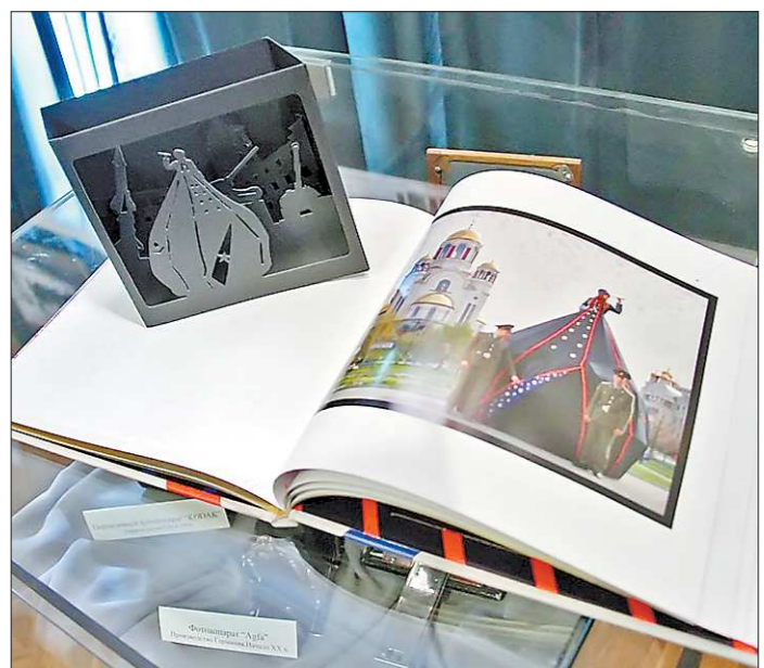
Американцы запомнились арт-проектом с палаткой