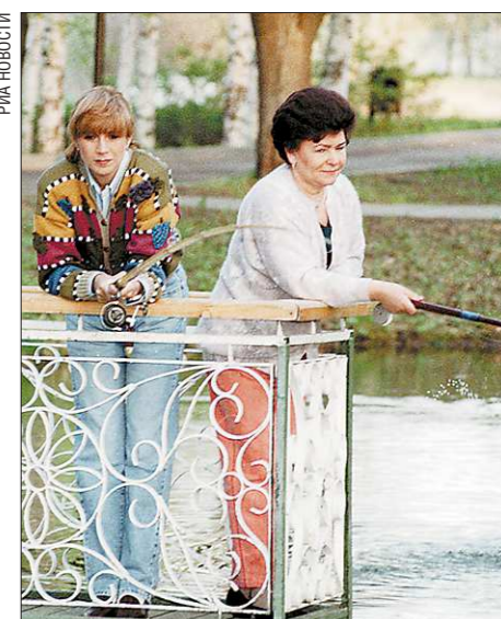
Май 1993-го. Наина Ельцина и супруга премьер-министра Канады Мила Малруни во время отдыха