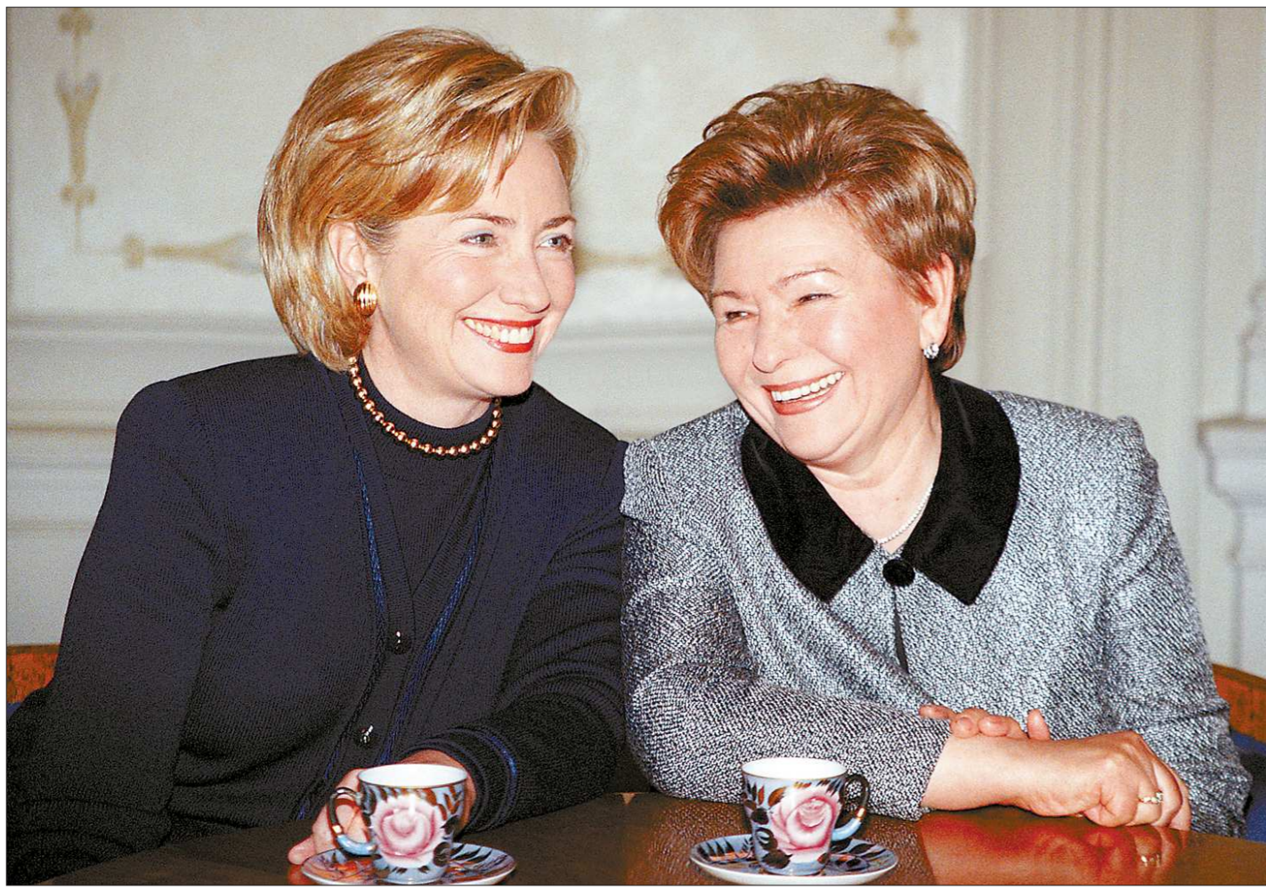
Сентябрь 1998-го. Хиллари Клинтон и Наина Ельцина во время посещения Дома учёных в Москве