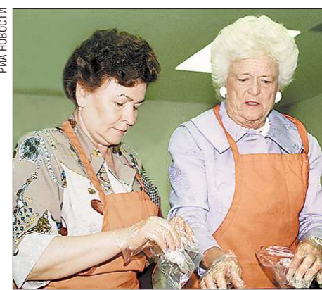
Июнь 1992-го. Супруги президентов России и США Наина Ельцина и Барбара Буш во время приготовления обеда на кухне приюта для детей-сирот (во время визита в США)