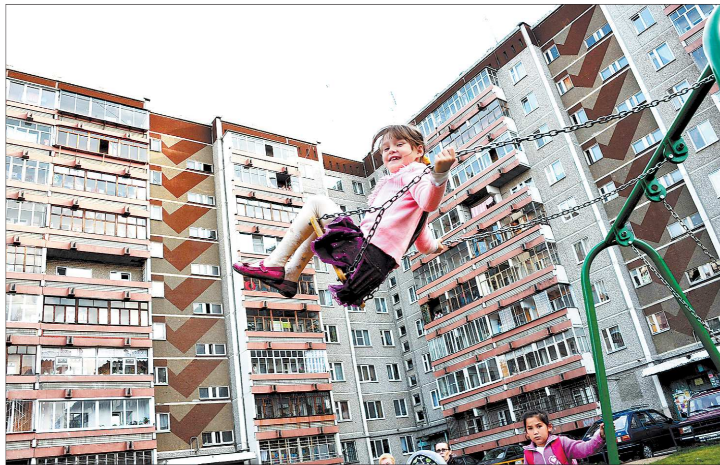
Крылатые качели принесут много радости, если взрослые удосужатся проверить их надежность

Несмотря на существующее право выбора, в последние годы число тех, кто выбирает итоговую аттестацию в форме ЕГЭ, растет.