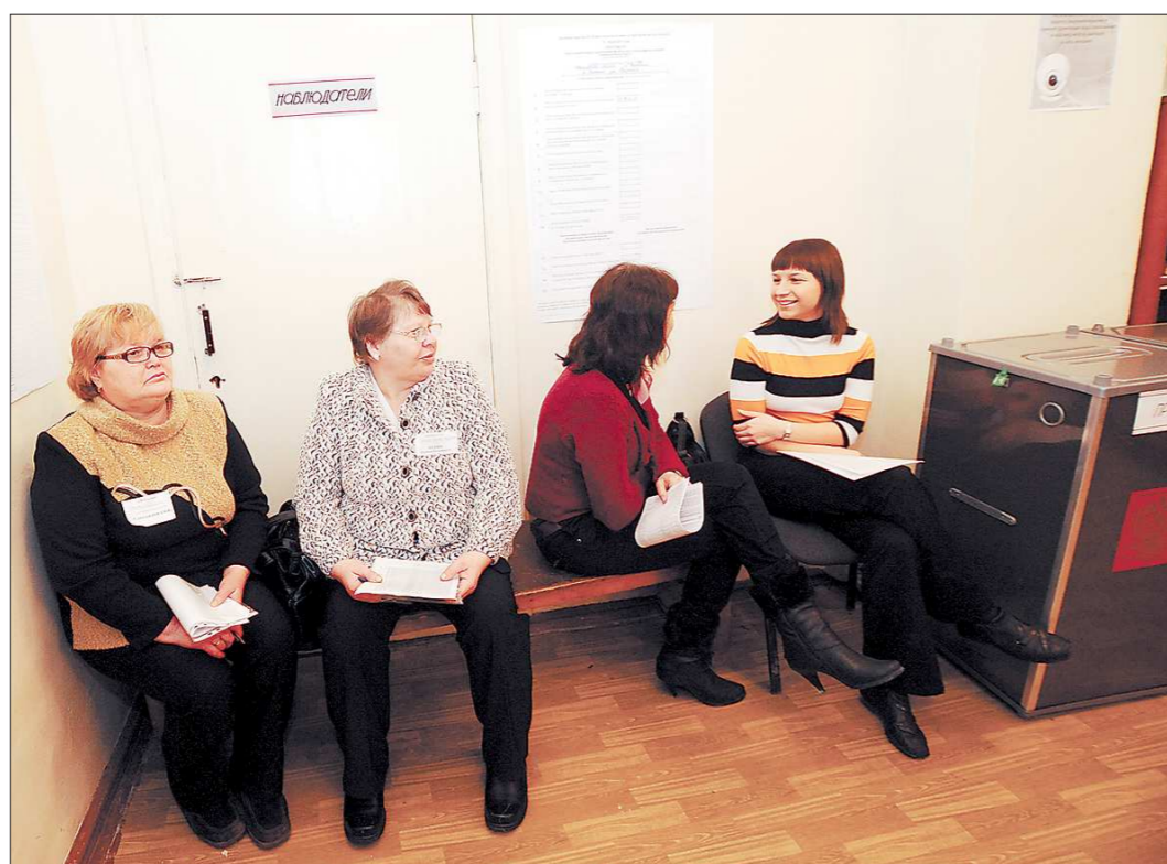
4 марта на избирательных участках Свердловской области работали 8500 наблюдателей. Самые активными оказались студенты из молодежного корпуса наблюдателей