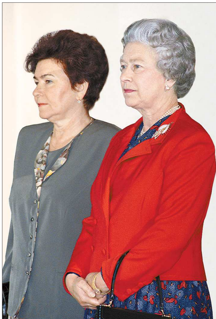
Ноябрь 1992-го. Наина Ельцина и королева Великобритании Елизавета II во время встречи в Букингемском дворце