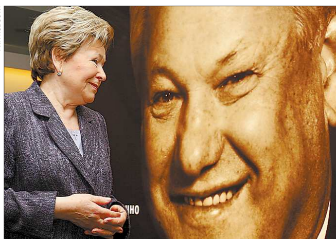
Январь 2011-го. Наина Ельцина на выставке «Борис Ельцин — начало новой России» в Государственном музее-заповеднике «Казанский Кремль»