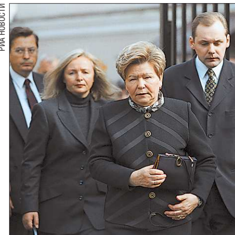
Сентябрь 1999-го. Наина Ельцина и Людмила Путина на траурной церемонии прощания с Раисой Максимовной Горбачёвой