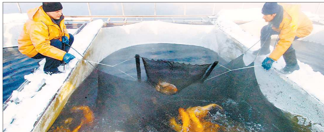
В ОАО «Рефтинский рыбхоз» стали разводить стерлядь. Скоро мальки этой «царской рыбы» будут выпущены в реки Чусовую и Сосьву.