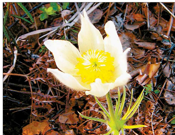
В Красной книге Свердловской области более ста видов растений. Подснежник — в том числе

Пусты все цветы остаются в лесу! Там они куда прекрасней, там им и место. Кстати, многие любители черемши тоже уже нашли выход из положения — стали выращивать её на грядках в коллективных садах и на дачах. Растёт она превосходно, при этом почти не требует ухода.