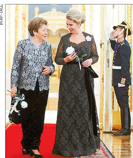
Декабрь 2011-го. Наина Ельцина и Светлана Медведева перед началом благотворительного вечера в Кремле