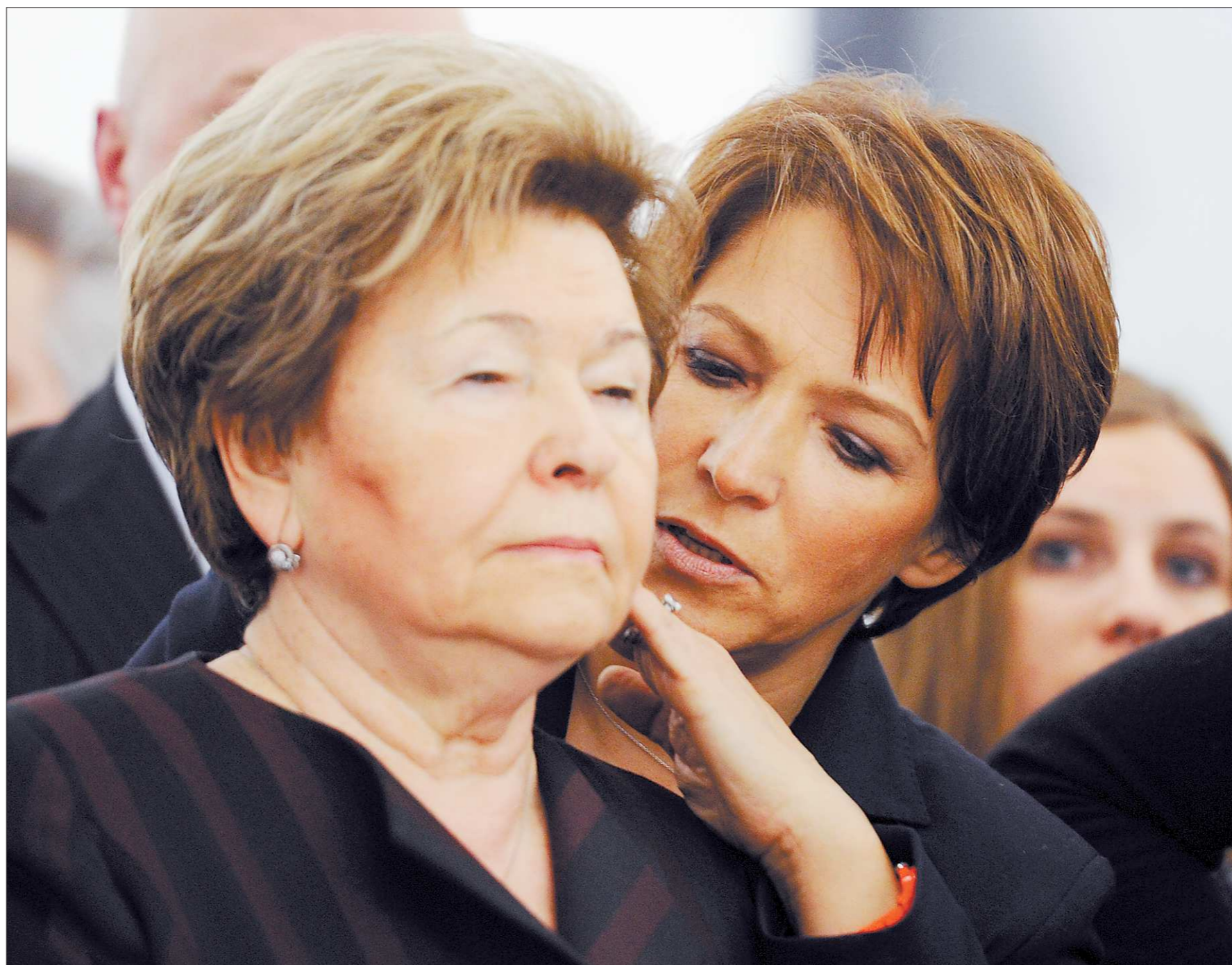
Январь 2011-го. Наина Ельцина с дочерью Татьяной Юмашевой на пресс-показе выставки «Борис Ельцин и его время» в Московском доме фотографии

Наина Иосифовна уже жила в Москве, когда в Свердловске «советские люди» стали выходить на улицы, требуя демократии и защищая её мужа. Автор этих строк был очевидцем тех митингов и готов засвидетельствовать: на площади 1905 года, на пятичке за Дворцом молодёжи, на пустыре у «Космоса» стояли, в значительной мере, именно те 50–55-летние женщины-инженеры, ещё недавно выходявшие на первомайские