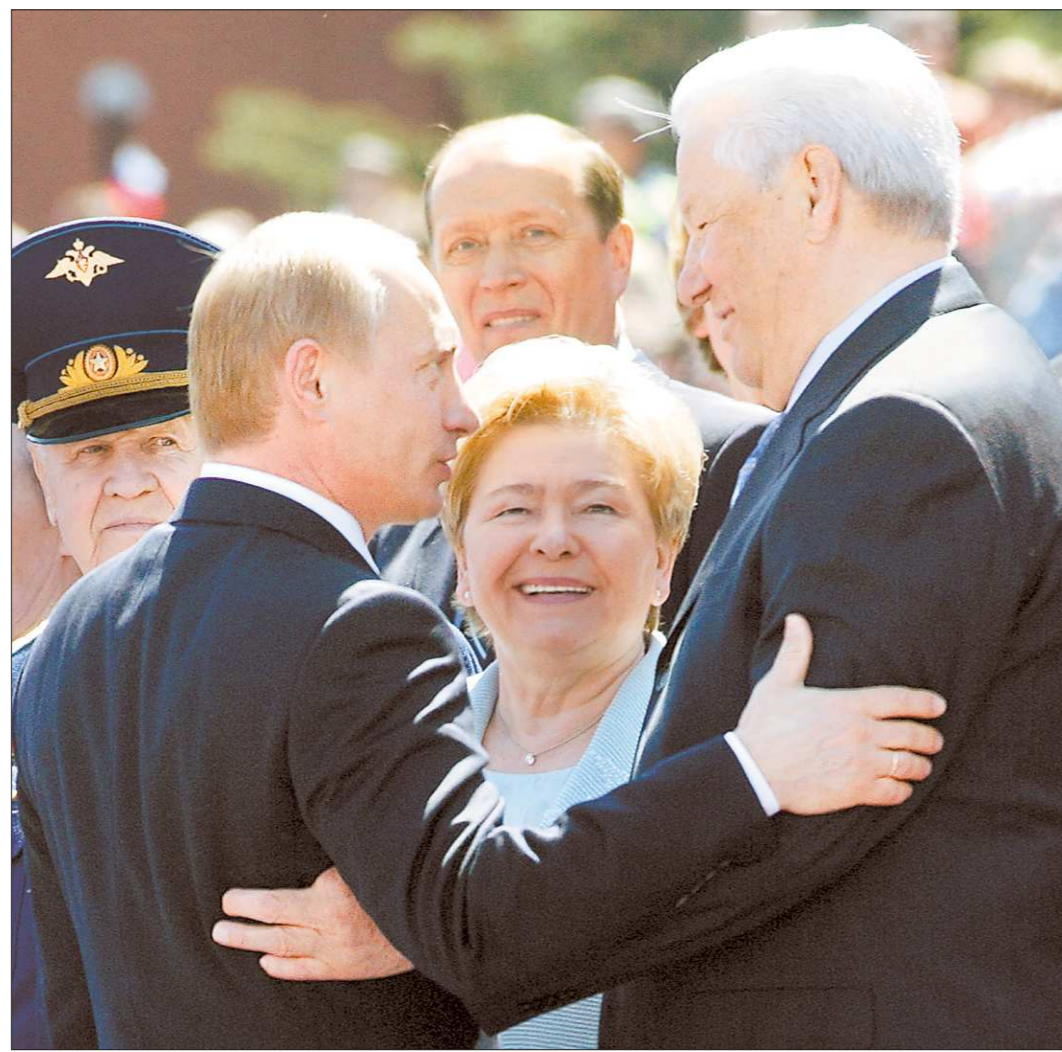
12 июня 2004 года. Президент России Владимир Путин, Наина Ельцина и первый президент России Борис Ельцин во время празднования Дня России на Красной площади

До президентских выборов 1996 года оставалось около трёх недель, когда в Кремль прибыла делегация воюющей Чечни. Вероятно, многие помнят кадры бурного начала тех переговоров: Яндарбиев категорически возражает против предложенного плана раскладки за столом, требует, чтобы российский пре-