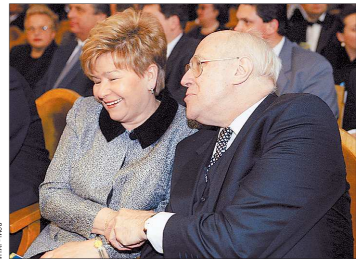
Июль 2011-го. Екатеринбург. Губернатор Свердловской области Александр Мишарин и Наина Ельцина аплодируют победителям международного турнира по волейболу на Кубок Бориса Ельцина