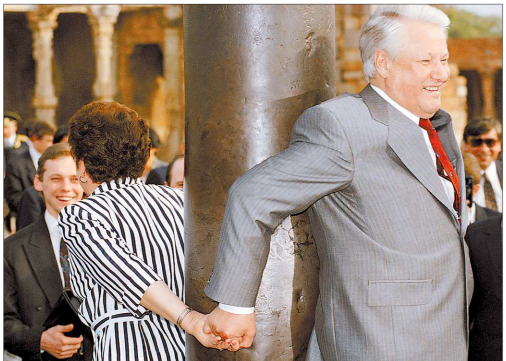
Январь 1993-го. Во время осмотра архитектурно-исторического комплекса Кутуб-Минар в Индии Борис Николаевич и Наина Иосифовна обхватили руками знаменитый металлический столб. По индийскому преданию, это приносит исполнение желаний

Ценники с несколькими нолями и огромные клетчатые сумки челноков — всего лишь видимость того времени. Как, впрочем, и стремительно заполнившиеся магазинами прилавки. Сущность же эпохи — в революционном стремлении перейти к тому укладу жизни, по которому ждёт весь мир (то есть к частной собственности, свободной инициативе, экономической и политической конкуренции). Видимость будет медленно отходить на второй план, сущность останется навсегда. Нам не дано знать, что историки скажут об эпохе Ельцина через пятьдесят, через сто лет. Но надо ли говорить, как далеки будут эти суждения от продикуванных политических конъюнктурой оценок февраля-марта 2012 года?