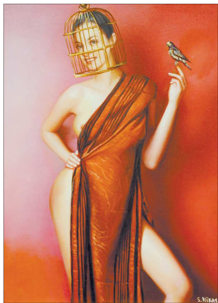
Н.Сафронов: «Свобода, или Птичья жизнь в клетке»

Сафронов считает самым коммерчески успешным художником России. Живописная реальность, которую создает его кисть, лишена недостатков – портреты заказчикам всегда нра-