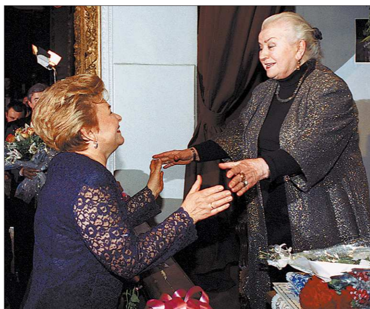
Январь 1996-го. Наина Ельцина поздравляет Марию Миронову на юбилейном вечере, посвященном 85-летию актрисы

зидент сел прямо напротив него, а не в торце стола. Ельцин парирует: «Мы с вами не равны!». Тем не менее после двухчасового разговора удаётся подписать соглашение о полном прекращении боевых действий.