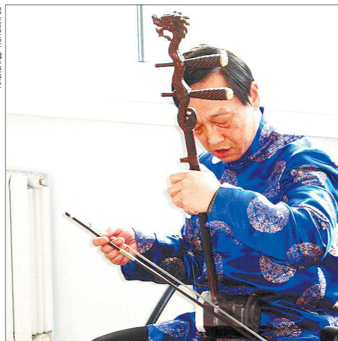
Китайская скрипка эрху имеет всего две струны вместо привычных нам четырёх

Здесь же подвели итоги конкурса эссе среди студентов «Я и Китай» на русском и китайском языках. Победители получили ценные и полезные призы. За первое место двоих эссеистов наградили поездкой в Китай, за второе — семестром бесплатного обучения в Институте Конфуция УрФУ, а за третье вручили сертификат на обед в китайском ресторане.