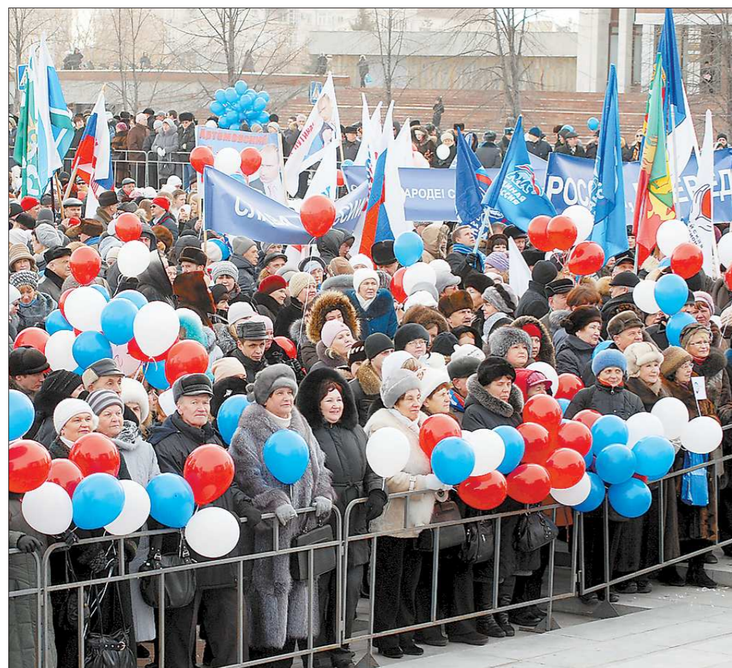
Вчера в Екатеринбурге на Октябрьской площади состоялся митинг, посвященный окончанию выборной кампании Президента России и победе Владимира Путина.

Выразить свои эмоции собрались уральцы, для которых четвертое марта этого года стало действительно исторической датой, — представители трудовых коллективов предприятий Среднего Урала, профсоюзных, ветеранских и молодежных организаций, творческой интеллигенции, органов государственной власти Свердловской области.