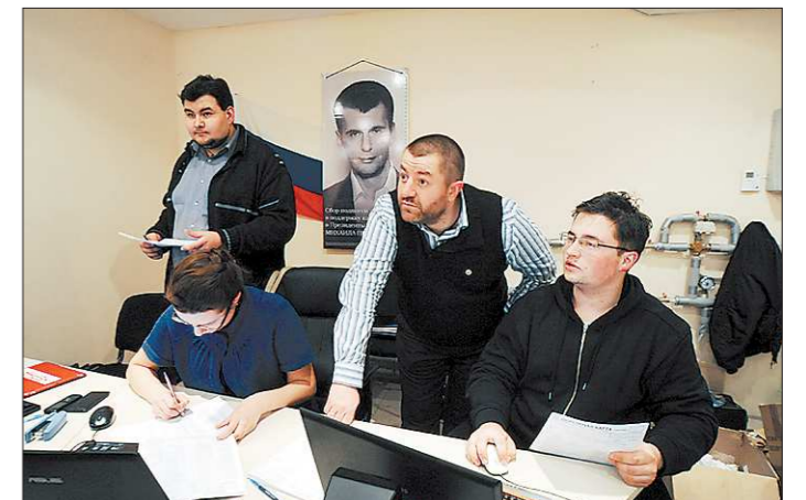
Кандидат Михаил Прохоров после окончания голосования заявил, что будет разочарован, только если займёт последнее место. В его общественной приёмной в Екатеринбурге нам сообщили, что заметили множество нарушений, однако результат своего кандидата по уральской столице считают неплохим