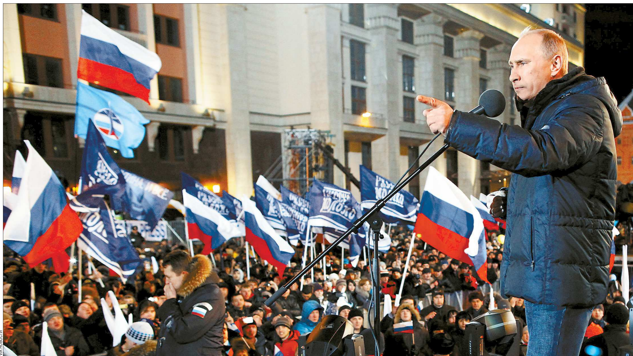
Владимир Путин выступает перед своими сторонниками на митинге на Манежной площади 4 марта 2012 года

№ 90 (6146). Цена в розницу — свободная.