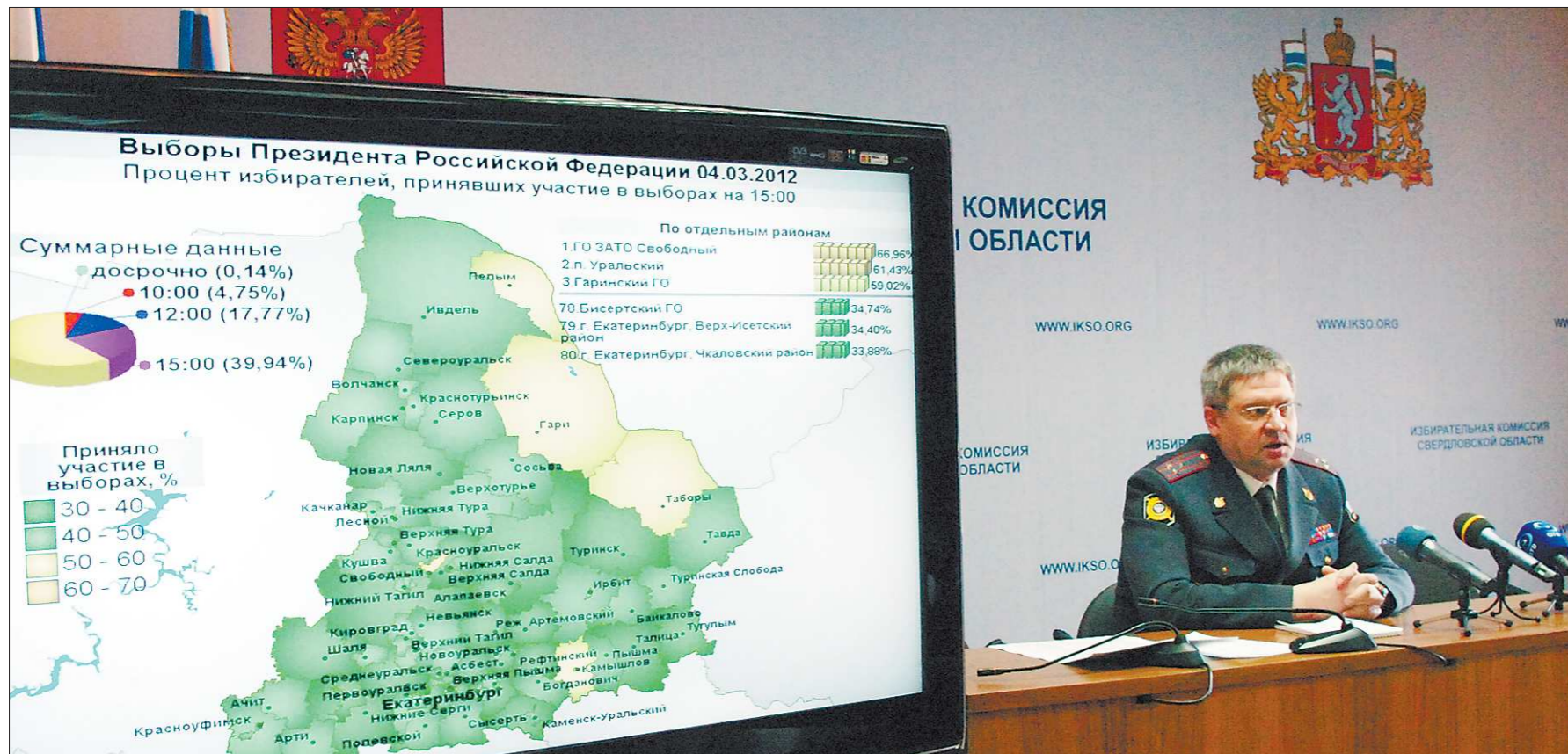
Для обеспечения безопасности на 2537 избирательных участках Свердловской области было направлено 6697 сотрудников полиции

В Свердловской области обработано 99 процентов бюллетеней, поданных избирателями на выборах Президента России. Согласно этой информации, за Владимира Путина проголосовали 1 337 781 человек (64,51 процента).