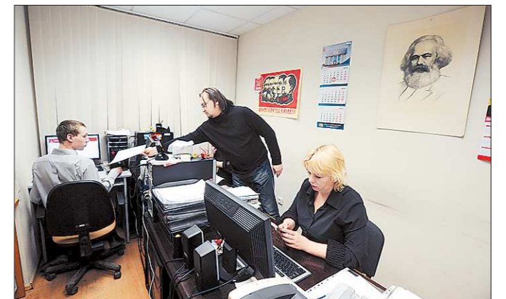
КПРФ итогами выборов, как водится, опять недовольна. Местное отделение партии мнение своего лидера поддерживает, хоть и спокойнее. В ночь выборов в екатеринбургском штабе коммунистов нам признались, что для них сейчас главное, чтобы Зюганов обогнал Прохорова по Свердловской области