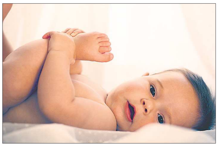
В нашей области 99,7 процента новорожденных обследуют на наследственные заболевания

ется более тысячи таких семей — выясняется риск рождения больного ребенка, возможность обследования и лечения.