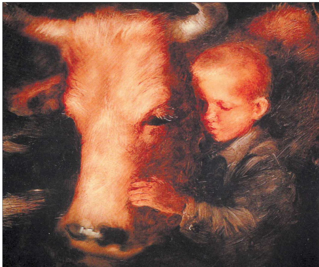
Лента Александра Петрова о четверокласснике Васе Рубцове, который переживает смерть любимой коровы, стала первым свердловским мультфильмом, номинированным на «Оскар»

В 1990 году мультфильм был номинирован на премию «Оскар». Кроме того, картина получила Гран-при на международных кинофестивалях в Германии, Индии, Японии и приз за лучший дебют на канадском кинофестивале.