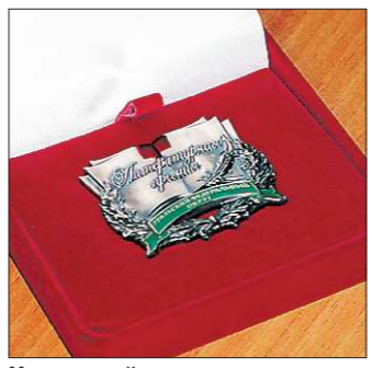
Нагрудный знак лауреата

УрФО сделала первый шаг. Отмечены при этом не только лучшие авторы, но и тенденции. Хорошо была представлена документальная проза, публицистика, неплохо – детская и юношеская литература. Зато