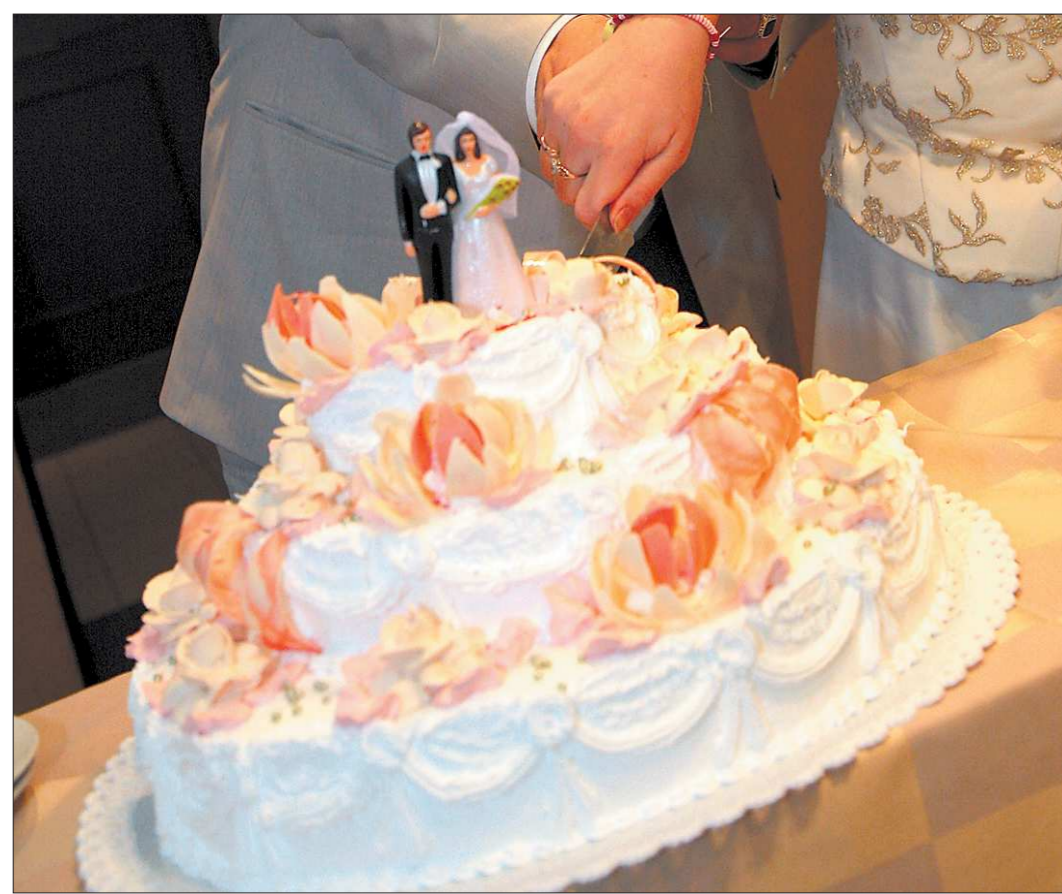
«Разрезать» ипотечный займ гораздо сложнее, чем свадебный торт