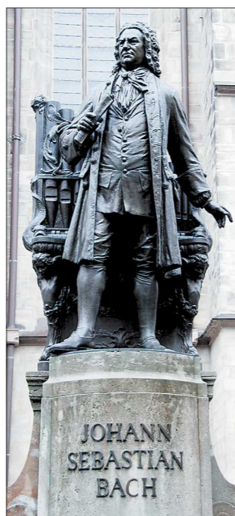
Недалеко от памятника Баху в Лейпциге – кофейня, где было написано много произведений для органа и оркестра

Тема нынешнего фестиваля «Бах, его друзья и современники». Bach-fest – восемь концертов в течение всего марта. Они воссоздадут (хотя бы в ближайшем приближении) музыкальную атмосферу, в которой рождались ор-