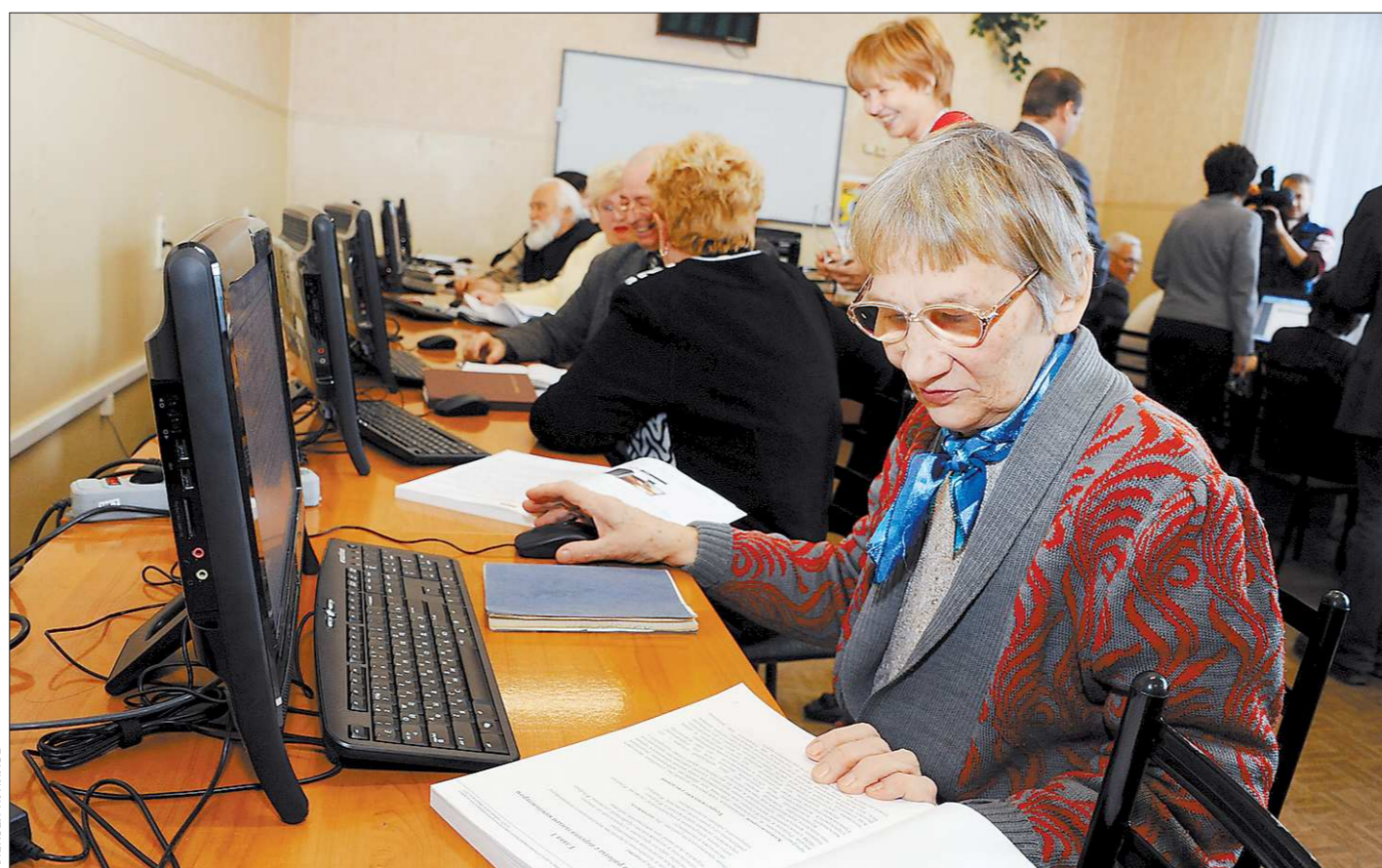
На курсах компьютерной грамотности комплектуются небольшие группы. Поэтому к каждому ученику индивидуальный подход, что обеспечивает полное погружение в тему