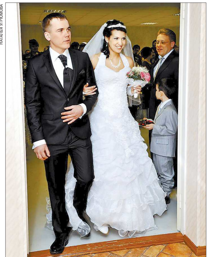
В первый же день в новом ЗАГСе зарегистрировались четыре молодые пары

Торжественное открытие ЗАГСа в новом помещении по адресу Трубиных, 44в состоялось в Первоуральске, сообщает газета «Вечерний Первоуральск». Де-факто работники отдела уже в течение месяца, с момента переезда в просторные апартаменты, где прежде располагалось городское управление здравоохранения, проводили все процедуры, связанные с записями актов гражданского состояния. Де-юре переезд отметили в праздничной обстановке, с разрезанием символической красной ленточки. Отметим, что новое помещение ЗАГСа в два с лишним раза больше, чем прежде.