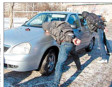
У задержанных был обнаружен пистолет (на снимке он — на капоте автомобиля)

В Екатеринбурге сотрудники полиции задержали подозреваемых в похищении человека и вымогательстве, сообщает пресс-служба областного ГУ МВД.