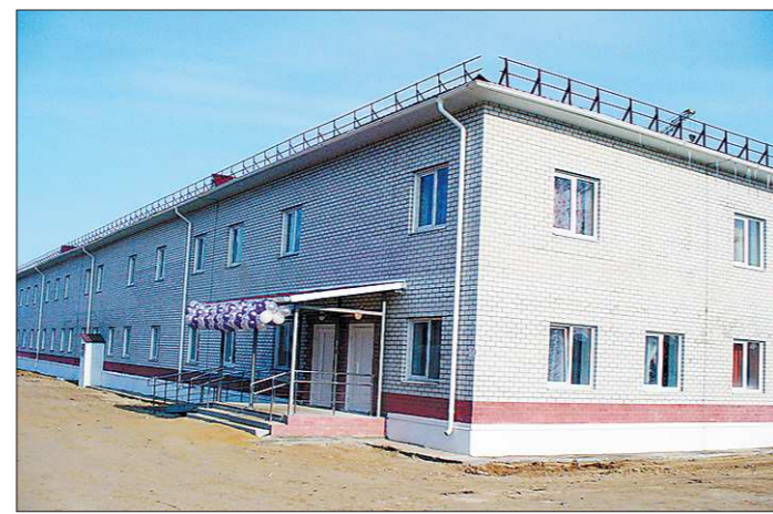
Совсем скоро в новый корпус Тавдинского психоневрологического интерната заселят новосельи

В Тавде построили двухэтажный бытовое корпус психоневрологического интерната