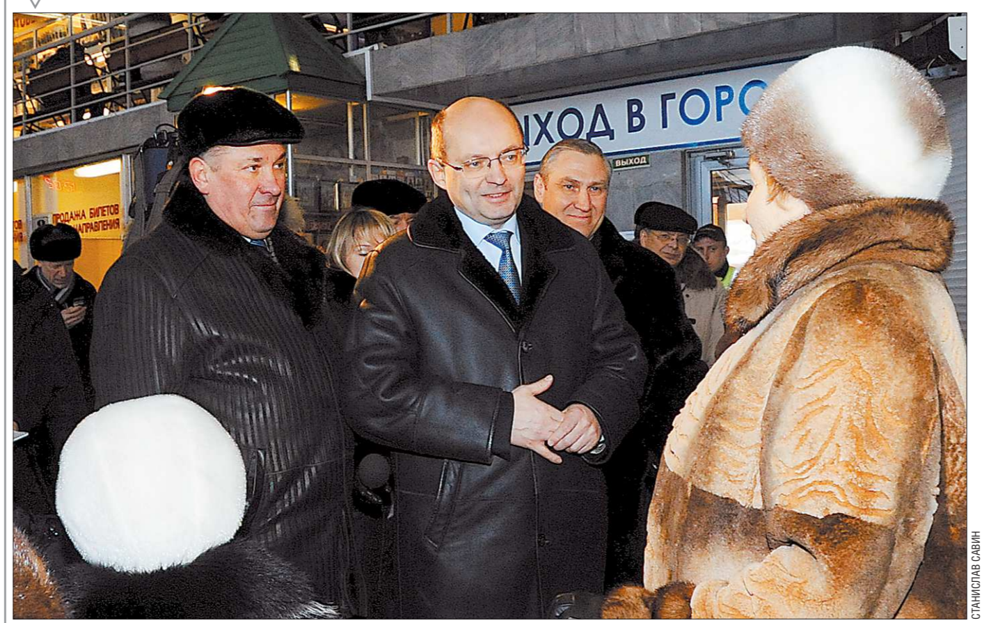
Губернатор Александр Мишарин выполнил свое обещание, данное пенсионерам: с 1 апреля для них вводится 50-процентная скидка на пригородный железнодорожный транспорт