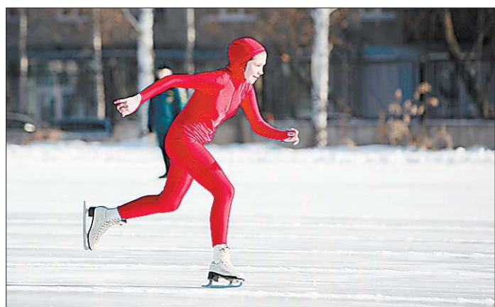
В России появился третий национальный спортивный проект

На старт Всероссийских соревнований по конькобежному спорту «Лёд надежды нашей» вышли школьники с 1-го по 11-й классы и студенты средних, специальных и высших учебных заведений. Соревнования были открыты для всех желающих, достаточно было иметь коньки. В Свердловской области в соревнованиях приняли участие Екатеринбург, Лесной, Красноуральск, Заречный и Первоуральск. Центральным забегом состоялся в уральской столице на стадионе «Юность», в нем приняли участие 1640 человек, а всего на Среднем Урале — более четырёх тысяч человек.