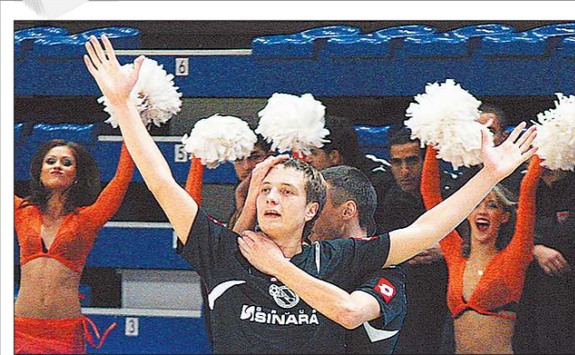
20 лет назад (в 1992 году) в Екатеринбурге был основан мини-футбольный клуб «Синара» — самый уникальный спортивный коллектив в нынешней России.

Уникальность «Синары» заключается в том, что она (вопреки всем тенденциям современного спорта) почти на 100 процентов формируется из собственных воспитанников, подавляющее большинство которых — уроженцы Екатеринбурга и Свердловской области. Иностранцы футболисты в составе команды за всю её историю было меньше, чем пальцев на одной руке (сейчас, например, нет ни одного), а уроженцы других регионов России играли в клубе в основном на заре его существования.