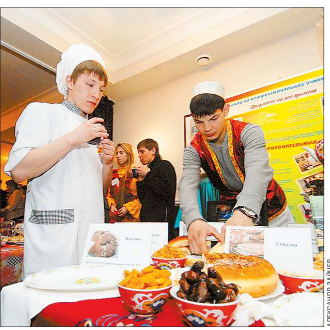
Одним — пост и воздержание, другим — пир души и пирский живот. Вчера в Екатеринбурге открылись Дни татарской кухни, организованные Постоянным представительством Республики Татарстан в Свердловской области при поддержке регионального министерства торговли, питания и услуг. В рамках праздника пройдут мастер-классы по изготовлению национальных блюд, дегустации, кулинарные викторины. Для молодых поваров было организовано состязание. Самые умелые из них получили призы и слова благодарности от сытых гостей