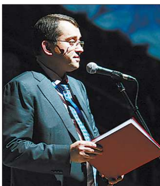
У ЕКАТЕРИНБУРГА БЫЛИ ДОСТОЙНЫЕ КОНКУРЕНТЫ

26 февраля в екатеринбургском Дворце игровых видов спорта состоялось открытие IX взрослой и IV детской зимних Спартакиад ОАО «Газпром». Впервые два этих уникальных спортивных праздника в этом году проводятся одновременно, и на гостеприимную уральскую землю приехали более двух тысяч спортсменов, 28 команд, представляющие дочерние структуры газового гиганта.