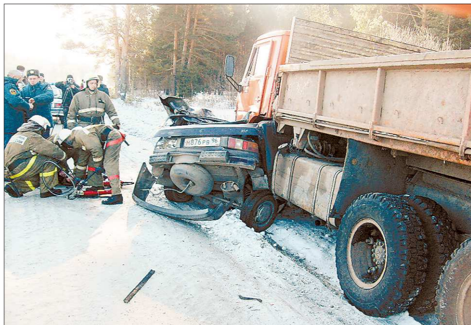
ПРЕСС-СЛУЖБА ГУ МВД

Удар был таким сильным, что многотонный самосвал, двигавшийся в сторону Буланаша, протиснул легковую машину ещё около двух десятков метров. Хотя люди, находившиеся в «Иж-Оде», были пристёгнуты ремнями безопасности, все пятеро