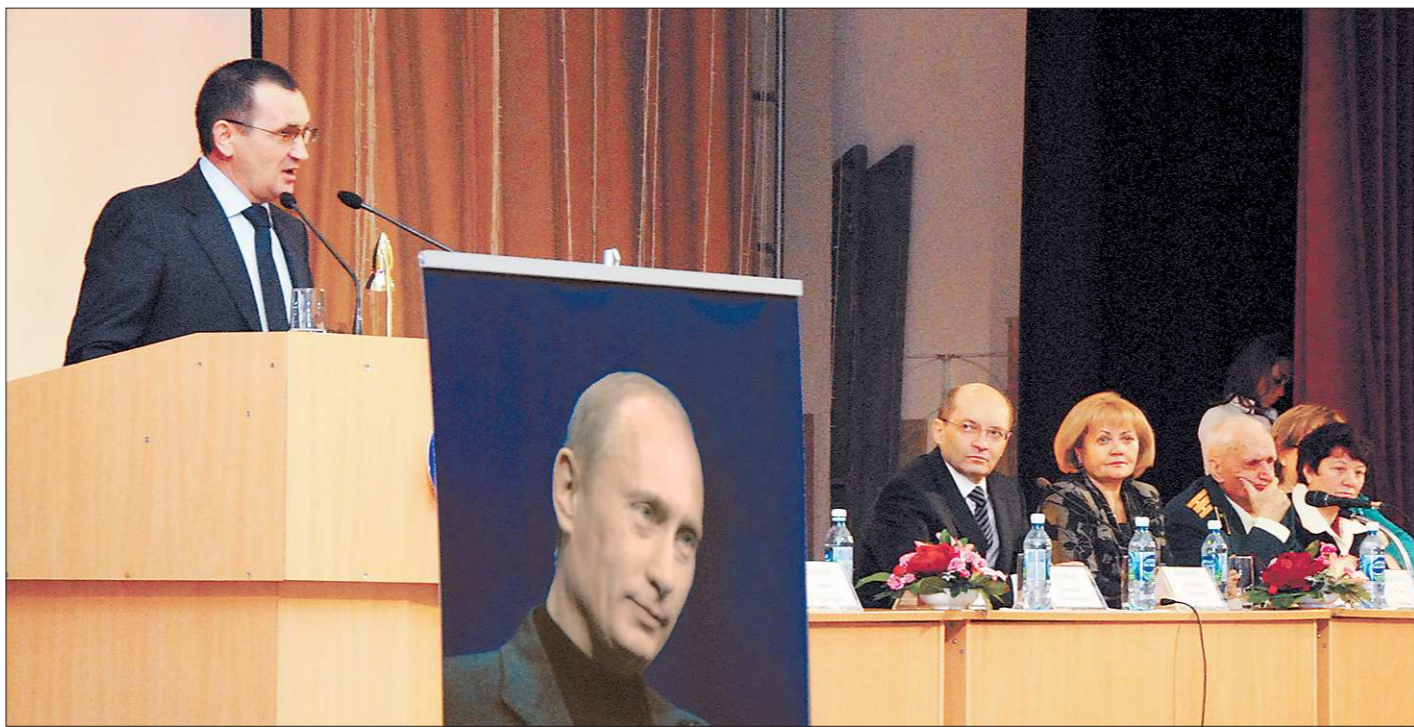
На Гражданском форуме Свердловской области для Владимира Путина подготовили немало вопросов