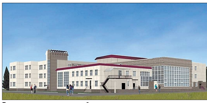
В проекте учтены все требования, предъявляемые к современным учебным учреждениям