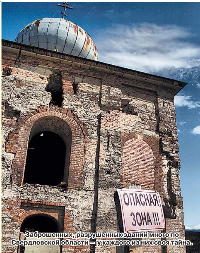
Заброшенных, разрушенных зданий много по Свердловской области – у каждого из них своя тайна.