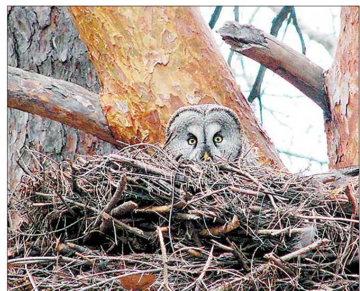
Теперь лесозаготовители, увидев на дереве гнездо той же совы, спиливать его не имеют права

По мнению специалистов, такие меры будут способствовать более быстрому естественному восстановлению лесов, а также ягодинок, травяной растительности.