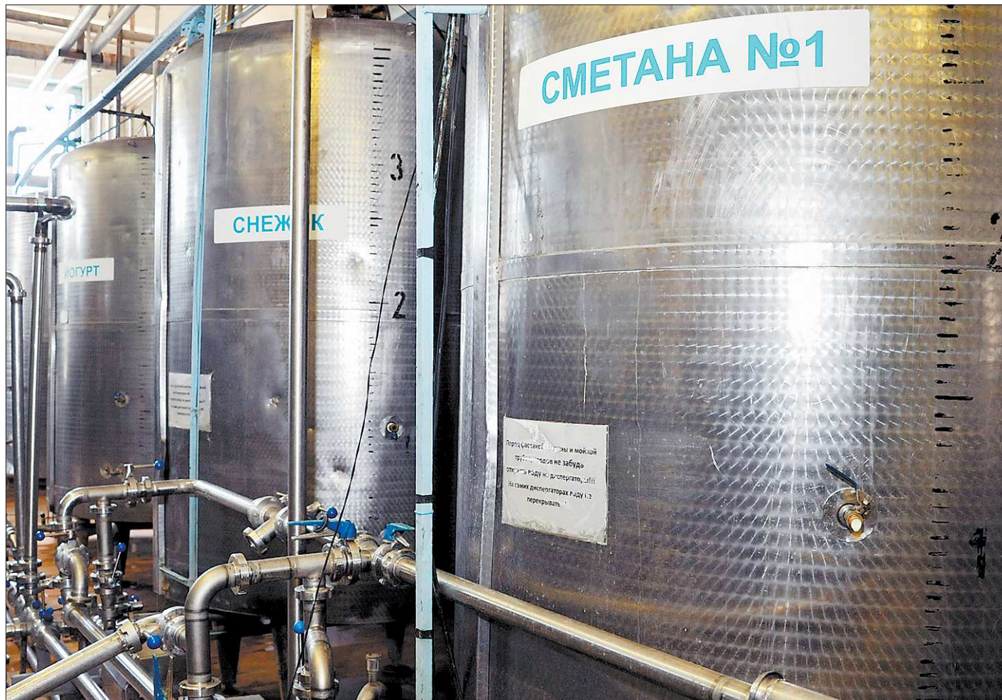
К качеству молочной продукции на Среднем Урале всегда относились особенно трепетно. Местное сельское хозяйство на 70 процентов зависит от производства молока. К тому же в сфере его переработки у нас сложилась здоровая конкурентная среда, в Свердловской области работают более тридцати молзаводов

Далее эту новость подхватили СМИ, сопроводив брошюрами заголовками: «Самое опасное молоко в Екатеринбурге», «Антирейтинг качества молочной продукции в Екатеринбурге возглавили ООО «Шилловское» и Пишминский завод». Можно только представить, как шокировало это известие некоторых покупателей, которые изо дня в день отдавали предпочтение продукции данных предприятий. Кроме того, к информации не было пояснений, она просто была в лоб. Что мог подумать не искушенный в деталях технологии проверок человек? Получилось, что по некоторым предприятиям молочной переработки у нас от 50 до 30 процентов брака, в лучшем случае — 10. При таких цифрах покупатели наверняка станут обходить молочные отделы стороной, а уж лидеры антирейтинга запомнят особо. Вот только задурили ли наши молочники такое отношение?