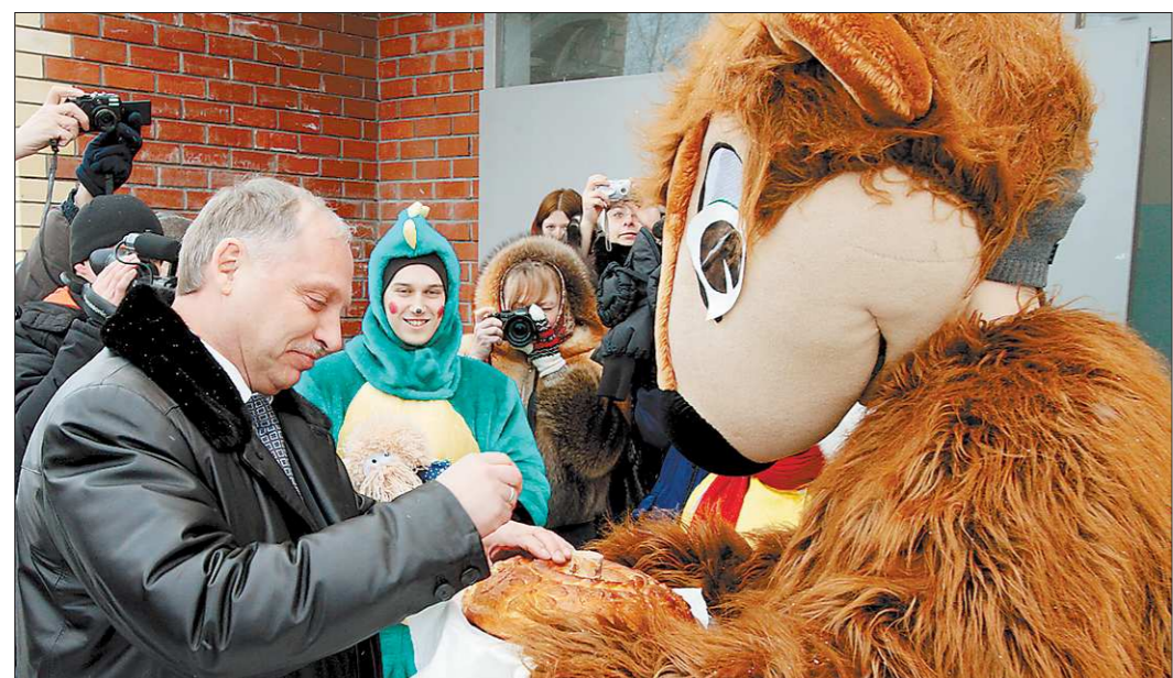
На пороге нового дома председателя правительства с хлебом и солью встречал бобёр - символ города Артёмовского

В этом году в порядке присуждения губернаторских премий молодым уче-