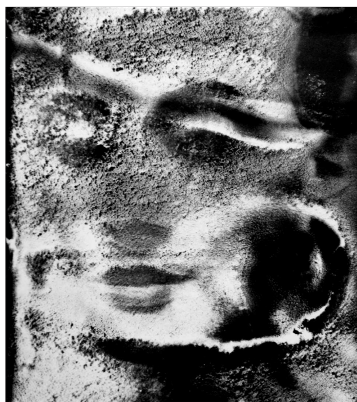
Непросто узнать руку художника, автора знаменитых ручных книжек