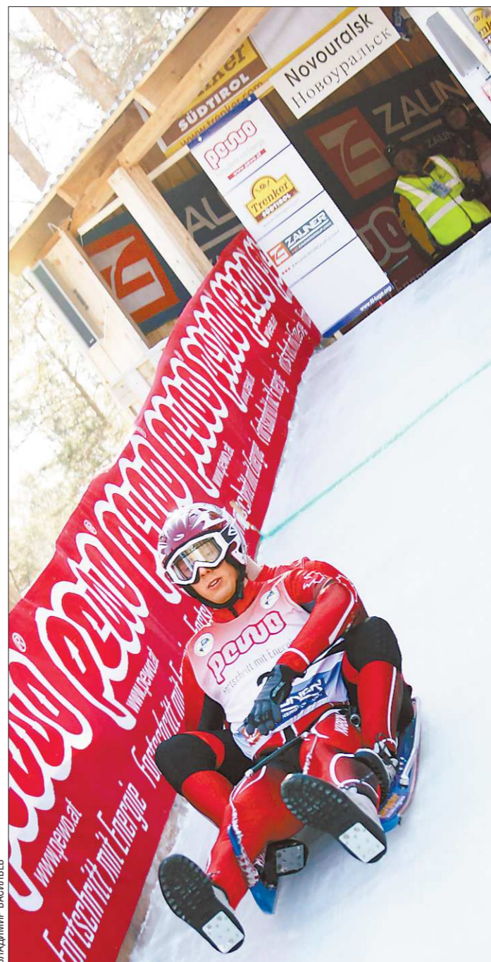
что количество зарубежных гостей увеличилось вдвое.

Этап Кубка мира изначально планировалось провести на олимпийской трассе в Сочи, но там к приёму гостей оказались не готовы, и соревнования в срочном порядке перенесли на Урал. Кстати, всего в мире сертифицированных трасс 65, из них 31 в Италии, двадцать в Австрии по три в России (Кандалакша, Новоуральск, Москва), Германии и Польше. Соответственно, в двух альпийских республиках натурбан наиболее развит и по популярности уступает разве что биатлону. Соревнования собирают по несколько тысяч зрителей и выливаются в большие местные праздники. За соревнованиями под Новоуральском будут наблюдать от силы несколько сотен жителей близлежащих Новоуральска и Первоуральска. В предыдущие годы на этапы Кубка мира приезжал итальянский болельщик, если паче чаяния нынче их окажется двое, то можно будет сказать,