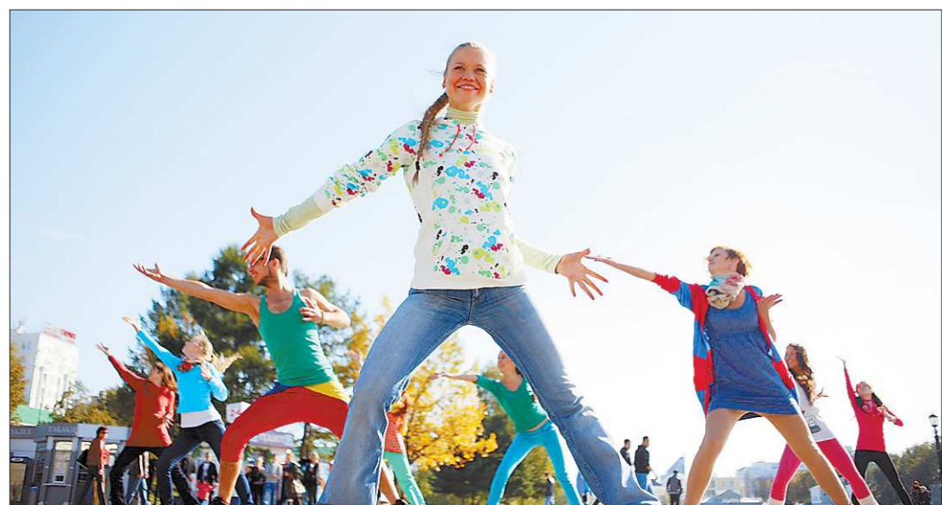
Адрес в интернете www.sergeypantykina.ru. Искать через неделю