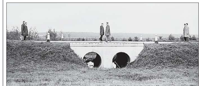
Вот так примерно это и происходило. Создателей советского фильма «Мертвый сезон» (1968) консультировал сам Рудольф Абель

Рудольф Абель (настоящее имя Вильям Фишер) — англичанин, работавший на советскую разведку, — был арестован в США в 1957 году в результате предательства другого агента СССР — Рейно Хайханена. На суде Абель получил 32 года лишения свободы.