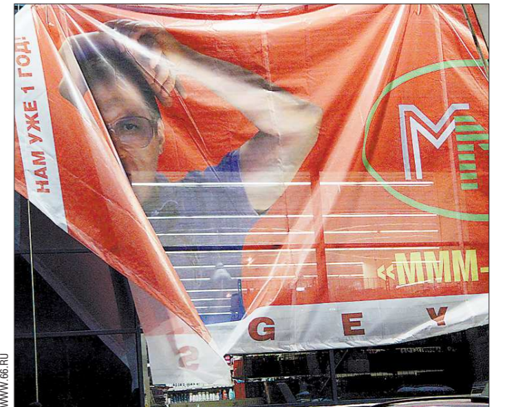
Бригада из трёх человек сняла баннер за час

С фасада торгового центра «Гринвич» в Екатеринбурге сняли баннер с рекламой «МММ-2011». В пресс-службе ТЦ сообщают, что срок аренды рекламного места истек, и руководство приняло решение не продлевать его.