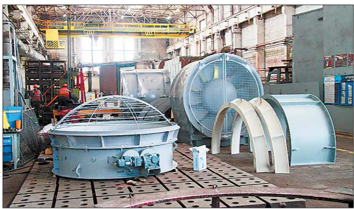
В 2010 – 2011 годах на «Вентпроме» модернизировали несколько цехов и освоили производство новых вентиляторов

Первой площадкой для посещения стала школа №56. Когда-то в ней учился Александр Мишарин, потому артёмовцы называют школу «губернаторской». В настоящее время от старой постройки почти ничего не осталось, в соответствии с проектом реконструкции завершён монтаж каркаса нового здания. Уже ведётся монтаж внутренних инженерных сетей, на верхних этажах маляры приступили к отделочным работам, а в газовой котельной, которая будет отапливать школу, начались пусконаладочные мероприятия. «Данный проект уникальный. Помимо учебных классов и кабинетов для дополнительного образования, здесь будет огромный спортзал и даже зимний сад. Более того, артёмовская школа № 56 станет самой большой в Свердловской области, в ней смогут учиться более 800 детей в одну смену», – отметил региональ-