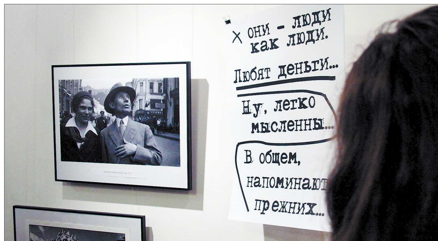
Фотографии — не иллюстрации, цитаты — не подписи