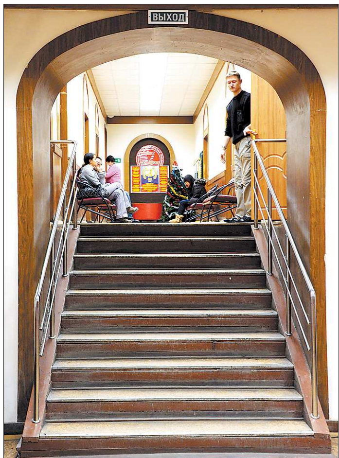
На заре рыночных реформ многие россияне судили о капитализме по книге «Незнайка на Луне». Сейчас с таким теоретическим багажом экономиста спустит с лестницы любая компания.