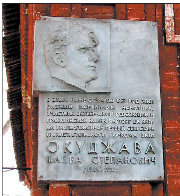
Память об отце великого барда в Нижнем Тагиле уже увековечена

ше заработать. Любая финансовая структура зависит от средств, которые ей удастся привлечь, в том числе, в Центральном банке РФ или на рынке межбанковского кредитования. В конце 2010-го — начале 2011 годов в российской экономике были ресурсы, которые предоставлялись под шесть — семь процентов годовых. Банки в свою очередь предлагали эти деньги заёмщикам примерно под 11 процентов. В настоящее время ставки межбанковского кредитования начинаются от восьми процентов. При этом финансовые организации несут расходы по обслуживанию клиентов, по содержанию помещений и оплате работы персонала, а самое главное — они обязаны гарантировать вкладчикам сохранность вкладов. И уложиться в маржу, равную одному-двум процентам по кредитам, они не в состоянии, — поясняет начальник отдела по работе с партнёрами Райффайзен-банка Наталья Брусницына.