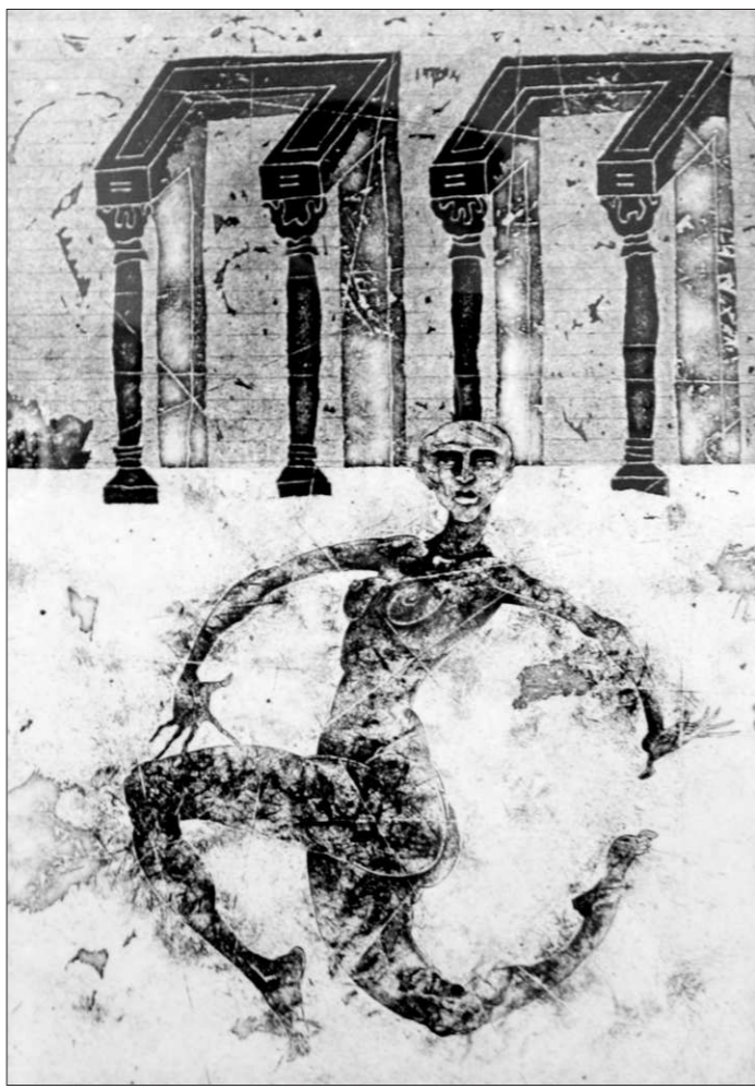
Каждому мужчине — своя женщина

Два цвета. Две техники. Два взгляда на женскую красоту. Тугой сплав жгучей эмоции и холодного рациона. И всегда — высочайшая техника исполнения. Оба выставили графику малых форм. Траурные Бортникова не боль-