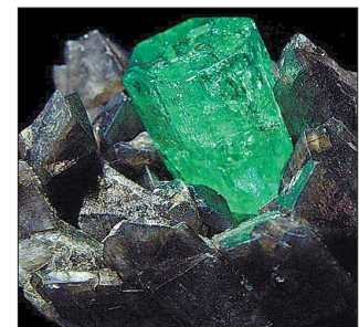
Уральские изумруды ценятся почти как алмазы

В советский период на территории Малышевского (бывшего Мариинского) месторождения стали также добывать бериллы — сырье для получения бериллия, стратегического материала для атомной промышленности.