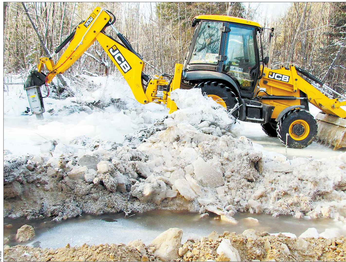
Из-за холодов река Шайтанка промерзла до дна. Чтобы обеспечить доступ воды в водохранилище, коммунальщики вынуждены с помощью техники вскрывать замёрзшее русло

В конце совещания фермеры области выбрали своих делегатов на 23-й съезд Ассоциации крестьянских (фермерских) хозяйств и сельскохозяйственных кооперативов России (АККОР).