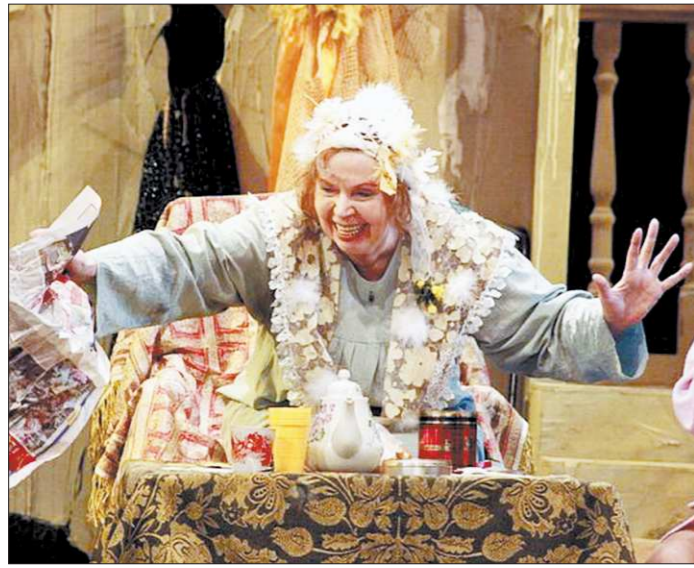
Сцена из спектакля «Дорогая Памела»