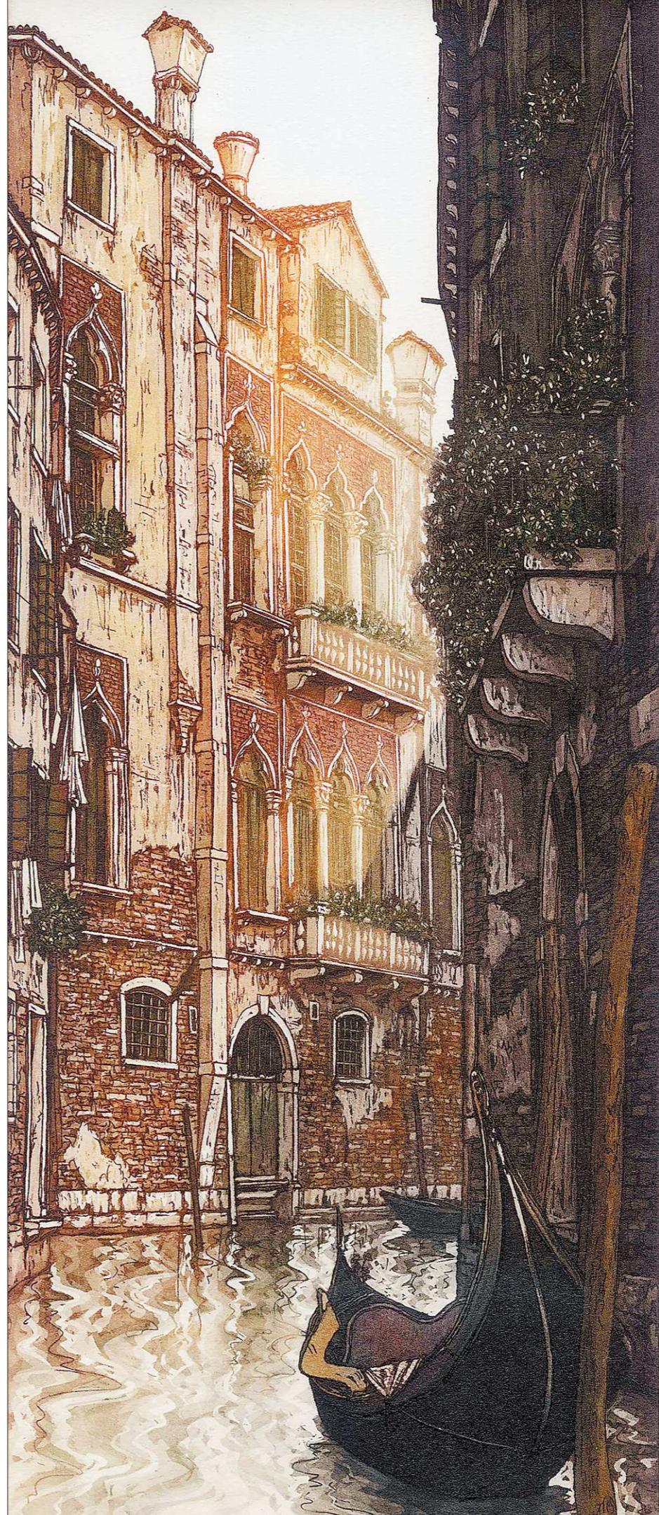
Уго Баракко посвятил Венеции более тридцати лет