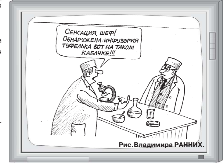
Рис. Владимира РАННИХ.