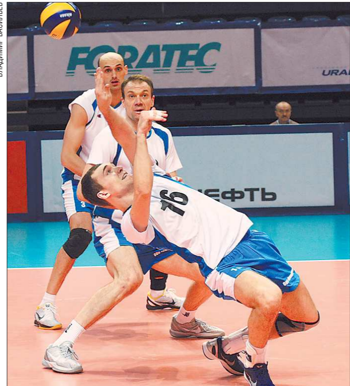
Одним из причин поражения «Локомотива-Изумруда» в матче с «Губернией» стала силовая подача соперника, которая буквально сбивала уральцев с ног

Следующий тур чемпионата состоится сегодня. «Локомотив-Изумруд» играет в Уфе с «Уралом».