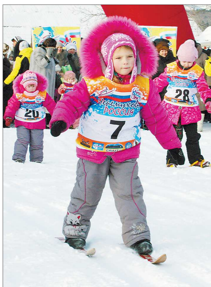
В минувшее воскресенье в мире отмечали День снега. А в России единственным снежным населённым пунктом оказался посёлок Черёмухово, что на Северном Урале

Европа чувствует себя несколько лучше, чем Америка, хотя и проигрывает в пиар-борьбе. В Европу мы поставляем энергоресурсы. Ничего другого, увы, за душой у нас нет. Раньше продавали газ по 450 долларов за тысячу кубометров, сейчас европейские страны требуют снизить цену до 300 долларов.