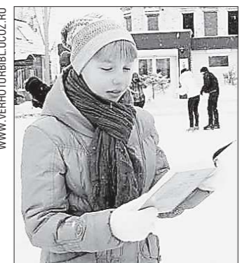
Время от времени участники акции скандировали: «Диван и стул не нужен мне – читаю даже на катке!»

Интересно, что самые маленькие участники – малыши из ясельной группы от двух до трёх лет – тоже старались самостоятельно приложить ручку к творчеству. Их фантазийные скульптуры, выполненные с помощью взрослых, получились очень интересными. Выставка действовала почти целый месяц, а сейчас все экспонаты украшают детсадовские комнаты.