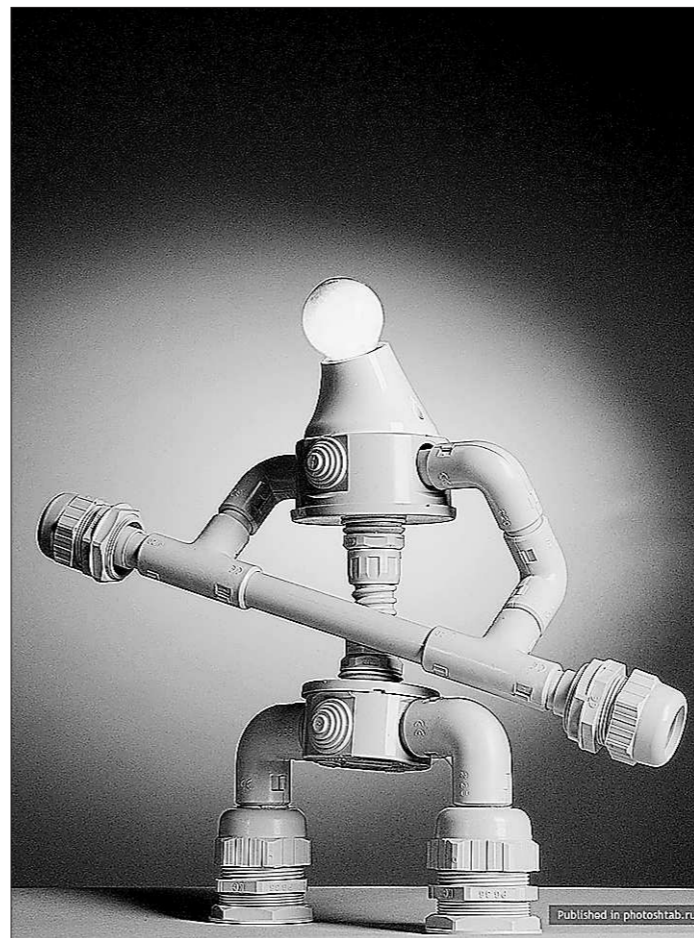
...конструкцию ЖКХ опять будут менять