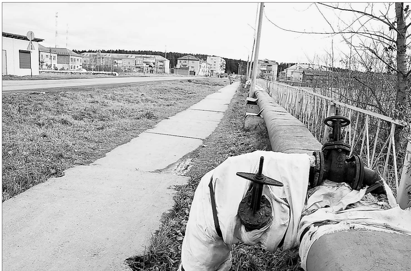
Многолетняя дорога реформ не привела к всеобщему коммунальному благополучию...