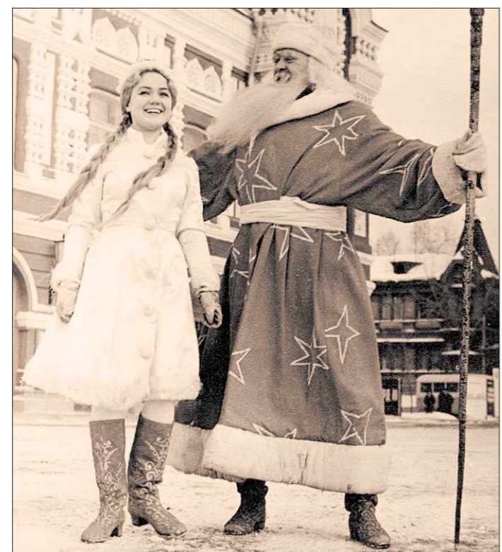
Самые красивые актрисы, Снегурочки, украшают бруталных Дедов Морозов

Подборку подготовили Ирина КЛЕПИКОВА, Наталья ПОДКОРЫТОВА, Лидия САБАНИНА