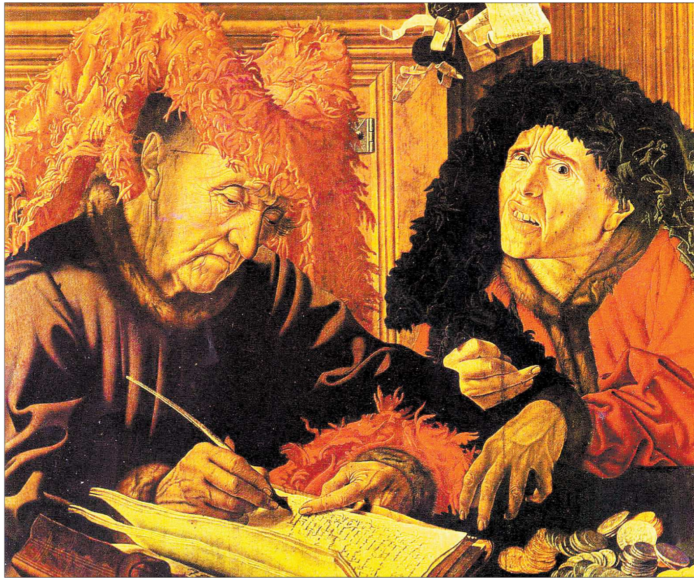
Налогообложение в Нидерландах XVI века достигло таких высот, что мясное блюдо в амстердамском трактире, ещё не дойдя до посетителя, облагалось пятнадцатью разными сборами, а рыба под соусом — тридцатью. На картине «Два сборщика податей» (1540 г.) фламандского живописца Маринуса ван Реймерсвалля ясно видно, как тяжёл был труд налоговых инспекторов эпохи Возрождения...

Накануне Нового года жильцы «Никитских ворот» мечтают, чтобы застройщик исправил все недостатки, на данный момент он ещё не приступал к этой работе. Мечтают и о том, чтобы виновников их бед наказали, и чтобы подобные истории на Урале больше не случались.