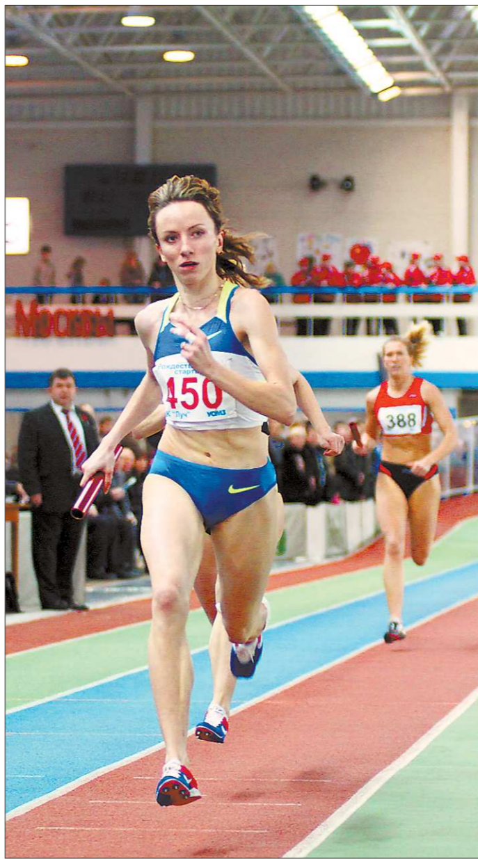
В 2011 году Мария Савинова признана лучшей легкоатлеткой Европы

—Сразу после финиша на чемпионате мира в Корее я увидела на беговой дорожке своего