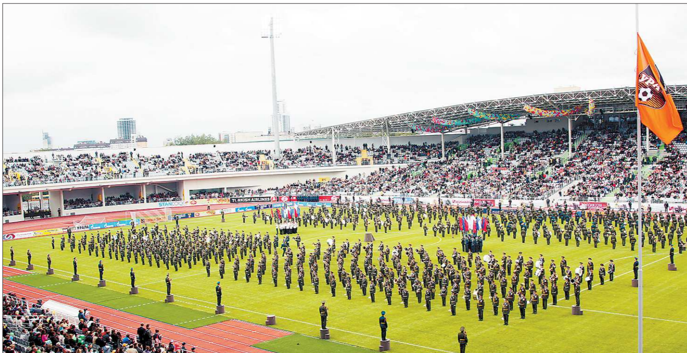
Церемония открытия Центрального стадиона в Екатеринбурге

Меняется время, меняются технологии строительства, меняются, наконец, требования, предъявляемые к спортивным сооружениям. Повторю то, о чём писал минувшим летом, — гораздо более ценный с точки зре-