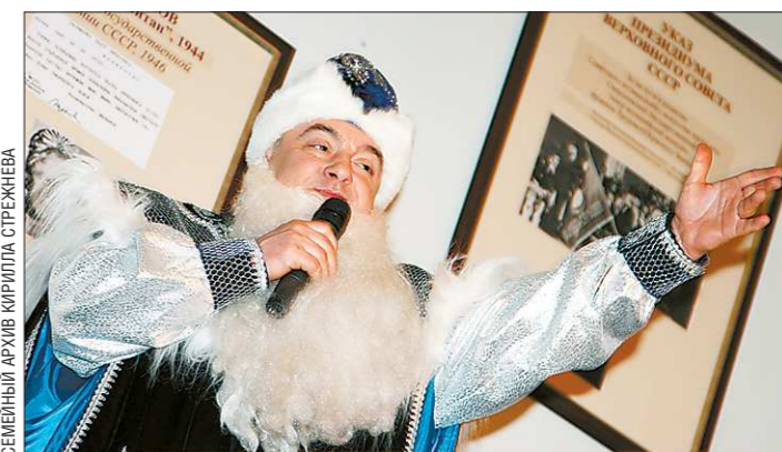
Народный артист России, но... не артист. И только единственный раз в жизни в родном театре он примерил на себя роль Деда Мороза