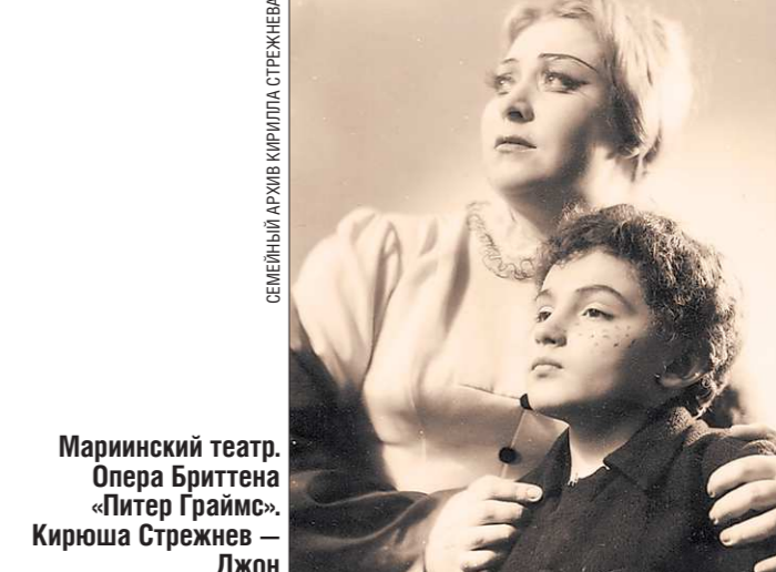
Мариинский оперный спектакль «Питер Граймс» Кирилла Стрежнева – Джон